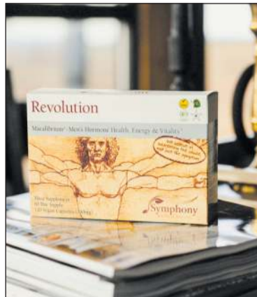
Revolution Macalibrium fyrir heilbrigði karla

Fyrir utan ráðleggingar um mataræði og lífsstíl eru ýmiss konar bætiefni sem geta hjálpað með margvísleg einkennum. Það eru mörg bætiefni á markaðnum, og ekki öll gera það sem þau lofa en ég mæli alltaf með bætiefnum sem studd eru af klínískum rannsóknum, eru af góðum gæðum og upptaka á virku efnunum séu góð. Ég geri mér grein fyrir, að þó svo að öll skilyrði eru uppfyllt, virka bætiefni misjafnlega og ekki ein tegund hentar öllum. Bætiefni á markaðnum fyrir konur á breytingaskeiðinu og sem ætluð eru til að bæta líðan geta af góðum og gildum ástæðum