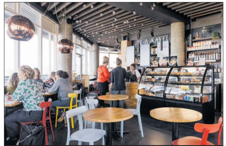
Bæjarbúar geta sótt sér frían afmælskaffibolla á Te & Kaffi í Smáralind og Hamraborginni

Og hvernig fara svo afmælisgestir að, bara mæta á eitt af kaffihúsum ykkar og óska eftir kaffi eða hvernig bera gestir sig að? „Við erum með QR kóða í afgreiðslunni sem viðskiptavinir skanna inn og fá svo sendan afmælsbolla í gegn um