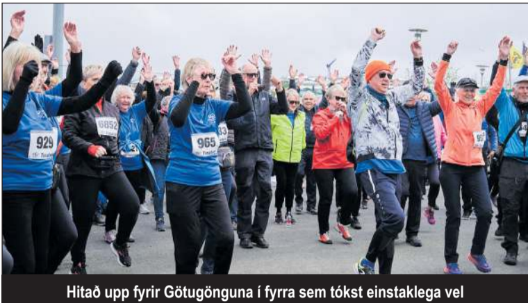
Hitað upp fyrir Götugönguna í fyrra sem tókst einstaklega vel

Pann 14. maí verður Götuganga fyrir 60 ára og eldri haldin í Kópavogi í annað sinn haldin af Virkni og Velliðan í Kópavogi.