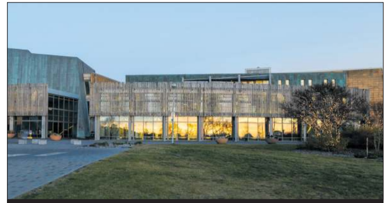
Ljósmyndin sýnir húsnæði Náttúrufræðistofu og Bókasafns Kópavogs