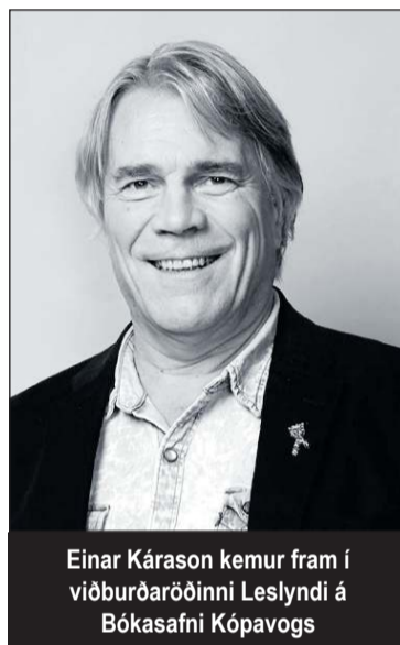
Einar Kárason kemur fram í viðburðaröðinni Leslyndi á Bókasafni Kópavogs

þar verður einnig boðið upp á lifandi sýningu í samstarfi við Íslenska dansflokkinn.