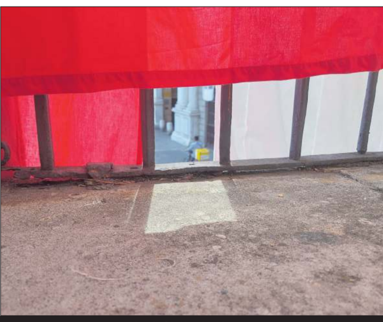
Mynd eftir Harald Jónsson

Rit Bek, „The Vulgarly of Being Three-Dimensional“ kom út 2020 og fékk Hasselblad-verðlaunin sem ljósmyndaþak ársins.