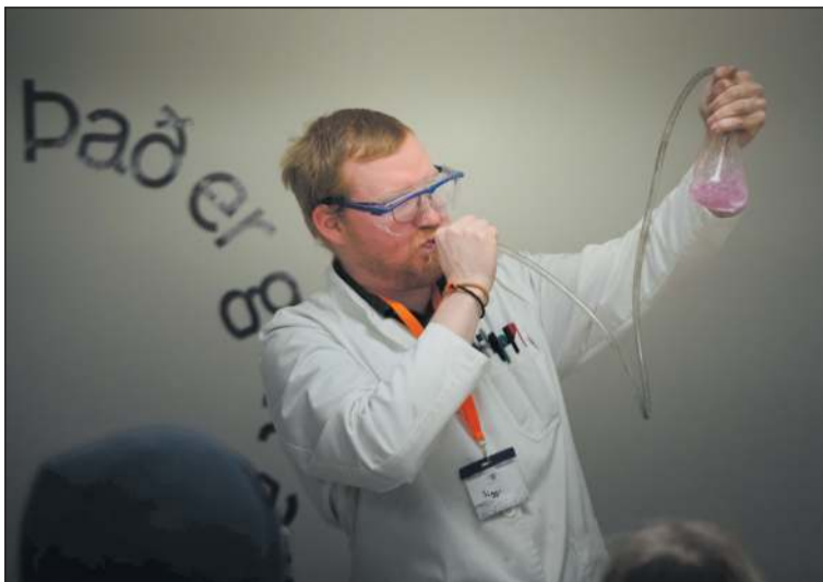
Vísindasmíða Háskóla Íslands kynnr okkur fyrir undrum vísindanna 10. febrúar í Fjölskyldustund

Á afmælisdegi ljóðskáldsins Jóns úr Vör verða verðlaun og viðurkenningar veittar í