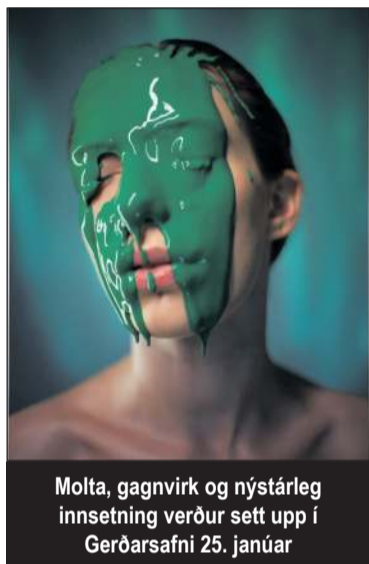
Molta, gagnvirk og nýstárleg innsetning verður sett upp í Gerðarsafni 25. janúar

Leslyndi hóf göngu sína síðastliðið haust og hefur notið mikilla vinsælda. Þar stíga þjóðþekktir bókaunnendur á stökk og deila