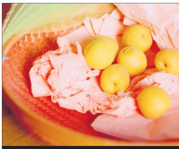
Verk eftir danska ljósmyndarann Tine Bek