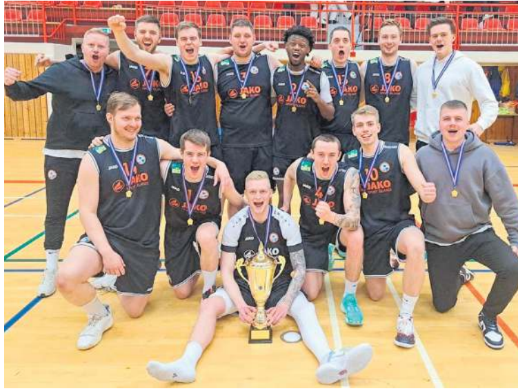
Sigurlíð Þróttar sem vann 2. deild á síðasta ári.

Árangur Þróttar verður að teljast frábær en Þróttur er á sínu fyrsta ári í næstefstu deild. Körfuknattleiksdeild Þróttar hefur minna fjármagn á milli handanna en önnur lið í deildinni og er eina liðið í deildinni sem hefur ekki útlending innan sinna raða.