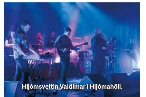
Hljóm-sveitin Valdimar í Hljómahöll.

Meðal hljóm-sveita sem hafa stigið á svið í sölum Hljómahallar má nefna Hljóma, Skítamóral, Mammút, Nýdönsk, Skálmöld,