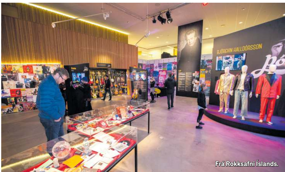
Frá Rokksafni Íslands.