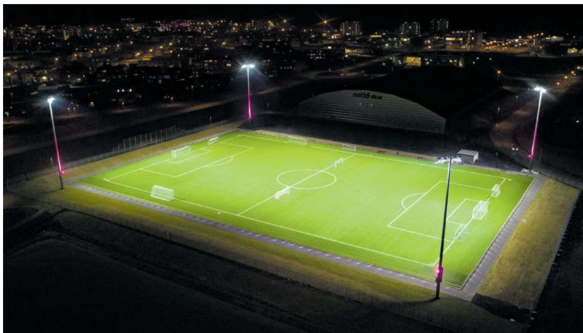
Gervigrasvöllurinn í Reykjanesbæ. Nú er tekist á um staðsetningu samskonar vallar í Suðurnesjabæ.