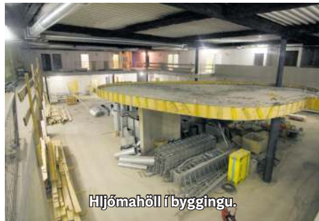
Hljómahöll í byggingu.