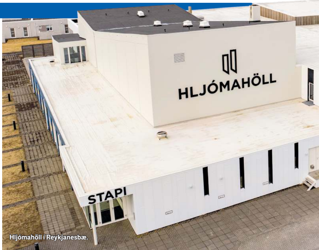
Hljómahöll í Reykjanessbæ.

Á upphafsstigum verkefnisins var rætt um að hafa rúmgóðan kjallara undir öllu húsinu, en vegna mikils kostnaðar við þá framkvæmd var fallið frá hugmyndinni. Þegar undirbúningshópurinn skoðaði erlend poppsöfn vakti það athygli hversu mörg þessara safna voru með lokuð gluggalaus rými þar sem auðvelt var að vinna með gagnvirkt margmiðlunarefni. Það var eitt af því sem arkitektinn Guðmundur lagði mikla áherslu á í sinni hugmyndavinnu. Rætt var um það fram og aftur hvort hægt væri að útbúa heilmýndir (hologram) af Hljómum og gefa fólki kost á að taka þátt í tónlistarflutningi og fá síðan