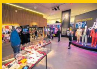
Sögu Hljómahallar má lesa á þremur síðum í blaðinu í dag.

Vínplötumarkaður verður á staðnum í tilefni dagsins og verður Tónlistarskóli Reykjanesbæjar með opið hús og sýnir aðstöðuna sína. Myndasýningar verða frá starfi Hljómahallar undanfarin tíu ár. Boðið verður upp á léttar veitingar. Þá verður ókeypis aðgangur að Rokksafni Íslands um afmælishelgina dagana 5.-7. apríl.