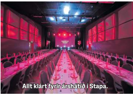
Allt klárt fyrir árs hátíð í Stapa.