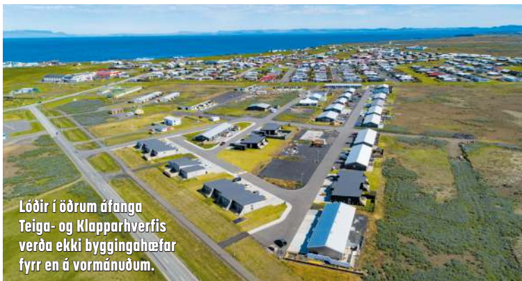
Lóðir í öðrum áfanga Teiga- og Klapparhverfis verða ekki byggingahæfar fyrr en á vormánuðum.

hlutunarreglur um lóðir í Suðurnesjabæ gera ráð fyrir því að almennt séu allar lóðir auglýstar til umsókna sem eru til úthlutunar. Ráðið getur því ekki orðið við þeirri ósk að ráðstafa sérstaklega lóðum til almennra byggingaraðila nema Suðurnesjabær felli úr gildi eða breyti núverandi reglum um úthlutun lóða.