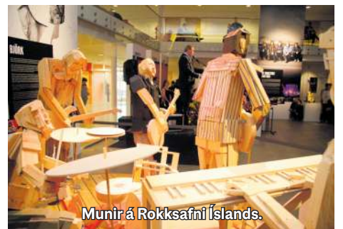
Munir á Rokksafni Íslands.