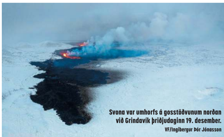
Svona var umhorfs á gosstöðvunum norðan við Grindavík þriðjudaginn 19. desember.

Frá því á Þorláksmessu hafa Grindvíkingar haft heimild til að dvelja í Grindavík allan sólarhringinn. Hættumatskort Veðurstofu Íslands hefur gildistíma til kl. 18 þann 29. desember og gildir heimild