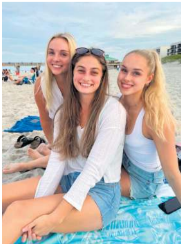
Lífið í Florida er ekki eintómt puð og púl. Það þarf líka að gefa sér tíma til að njóta.

Við fórum upp til Gonzaga fyrir nokkrum vikum, sem er í Washington-fylki á vesturströndinni. Þá þurftum við að fljúga fyrst í fjóra og hálfan tíma og svo í tvo – þetta var bara eins og að fara heim. Svo