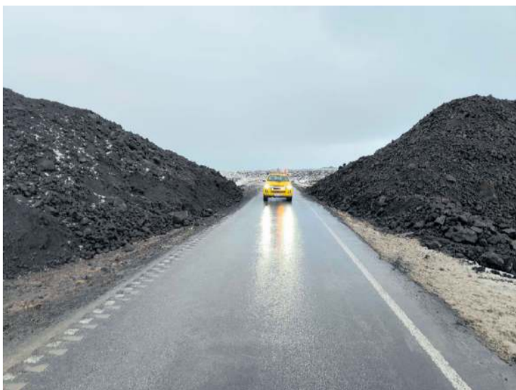
Varnargarðurinn þrengir að umferð um Grindavíkurveg.

Opnað var fyrir umferð um Grindavíkurveg fyrir íbúa Grindavíkur og viðbragðsaðila fyrir jól. Vegurinn er einbreiður í gegnum varnargarða og bílar sem koma frá Grindavík eru í rétti. Vegfarendur eru beðnir um að aka varlega og virða allar merkingar.