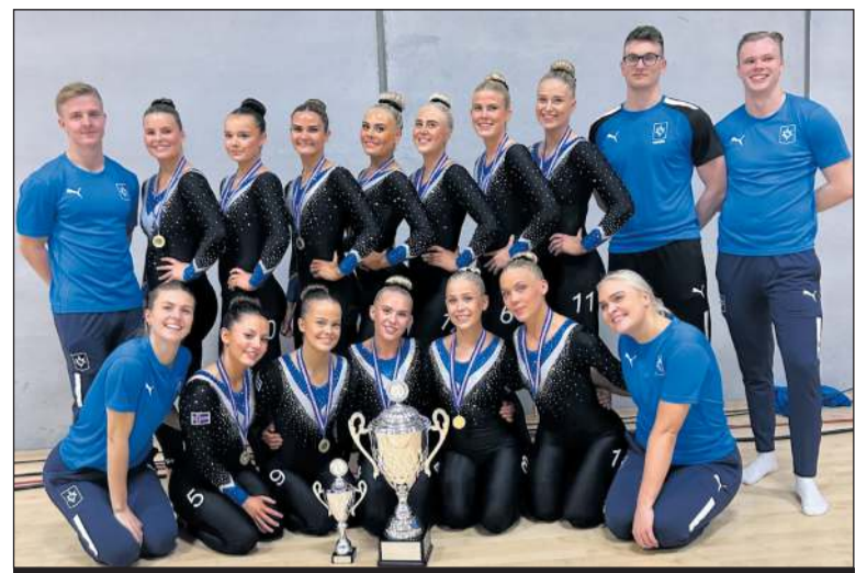
Stjarnan var að vinna sinn áttunda bikarmeistaratitil á síðustu níu árum

Alls sendi Stjarnan 10 lið á Bikarmót um helgina og urðu fjögur lið bikarmeistarar, en öll 10 liðin voru í topp þremur sætunum.