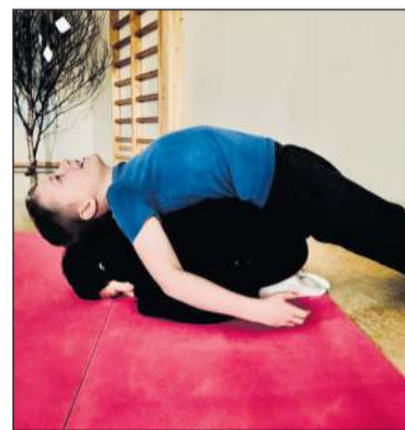
Jógadrengrir og -stúlkur á Barnaskóla Hjallastefnunnar á Víflisstöðum

Það er mikil og jákvæð viðbót að geta boðið börnum skólans upp á jógaiðkun með sínum kennurum,“ segir hún.