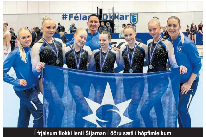
Í frjálsum flokki lenti Stjarnan í öðru sæti í hópfimleikum