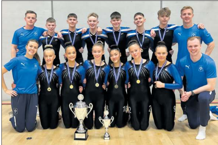
1. flokkur mix varð bikarmeistari og vann sér inn þátttökurétt á Junior NM

Stjarnan vann dýnuna af öryggi með 16.550 stig en þar fékk Gerpla 14.850. Stjarnan var einnig stigahæst á trampólíni með 15.225 stig og Gerpla var þar með 14.300 stig. Gerpla vann gólfæfingarnar með 19.050 stig en þar fékk Stjarnan 18.950.