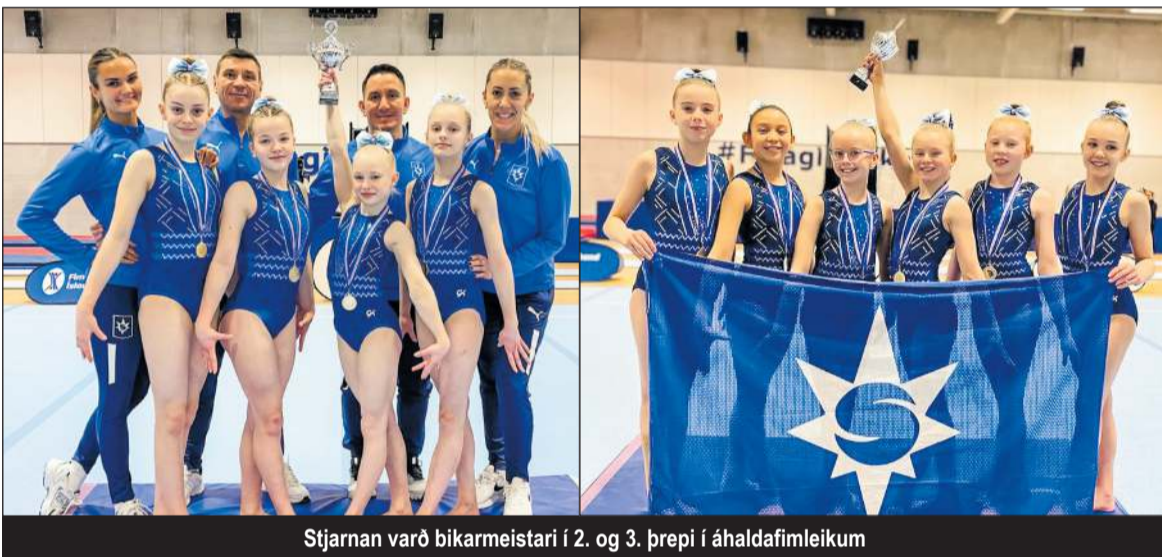
Stjarnan varð bikarmeistari í 2. og 3. þrepi í áhaldafimleikum

lið á áhaldafimleikum, frjálsar og 1. þrep og 2. flokkur og KK eldri í hópfimleikum. 1. flokkur kvenna og 3. flokkur í hópfimleikum enduðu í 3. sæti.