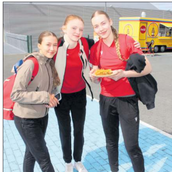
Handboltavinkonurnar Raket, Fjola og Hekla