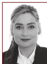
Kristín 699 0512

Stapahrauni 5, Hafnarfirði Sími: 565 9775 www.uth.is - uth@uth.is