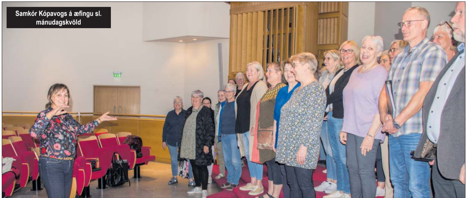
Samkór Kópavogs á æfingu sl. mánudagskvöld

Efnisskrá tónleikanna er létt, falleg og skemmtileg og er yfirskrifin „Hugur flýr heim“. Flutt verða þekkt og vinsæl lög úr ýmsum áttum um hið ljúfa líf, vorið, ástina og ættjörðina.