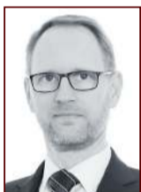
Frímann 897 2468