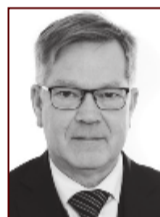
Hálfván 898 5765