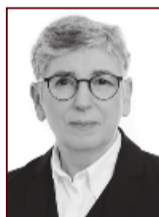
Ólöf 898 3075