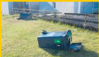
Lítið notaðar sorphunnur í Grindavík.

Um þessar mundir eru haldin heimili og gíst í tuttugu til þrjátíu húsum í Grindavík að staðaldrí.