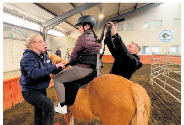
Nýi hnakkurinn veitir góðan stuðning og öryggistilfinningu.

Fallað verður um hnakkinn í þætti vikunnar