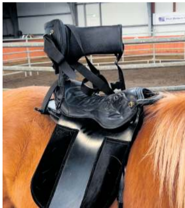
Hnakkurinn sem Hæfingarstöðin keypti fyrir hluta af styrknum frá Góðgerðarfesti Blue Car Rental.

Hestamannafélagið Máni hefur allan búnað sem þarf til að fatlaðir komist á bak. Þar hefur verið til hnakkur í mörg ár sem er sérniðinn að þörfum fatlaðra en kominn var tími á nýjan hnakk.