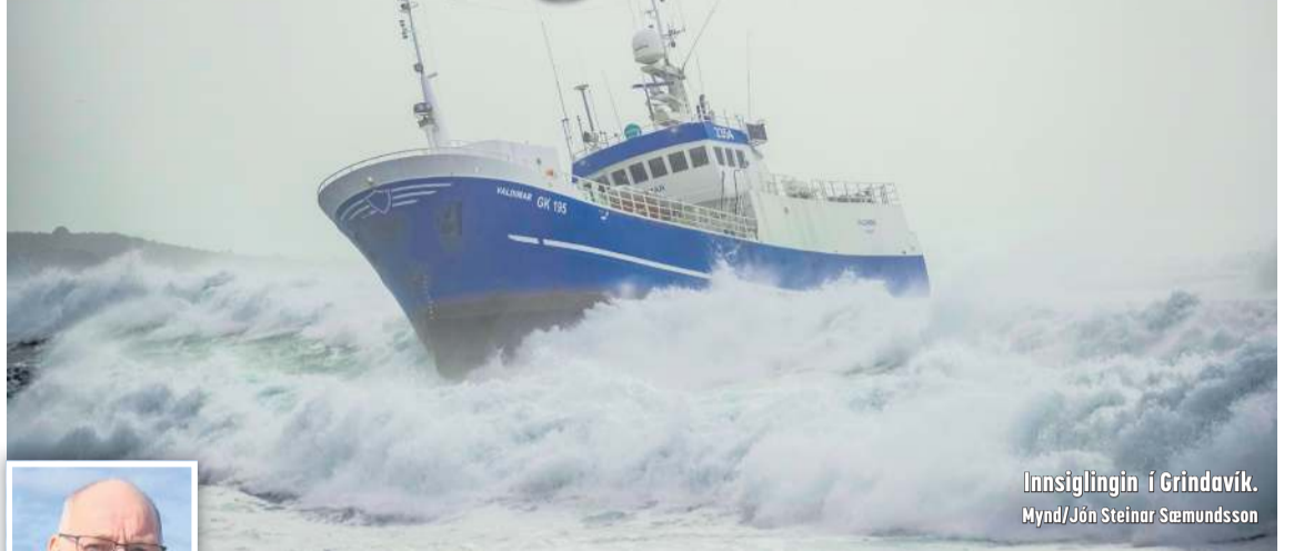
Innsiglingin í Grindavík.