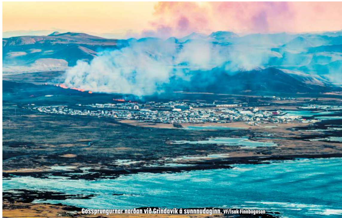
Gossprungurnar norðan við Grindavík á sunnudaginn.

Jarðskjálftavirknin var hins vegar stöðug á sunnudagsmorguninum sem bendir til þess að framrás kvikugangsins hafi stöðvast, en að hann hafi náð að bæjarmörkum Grindavíkur og jafnvel undir bæinn. Aflögunarmælingar benda eindregið til þess að sprungur innan bæjarmarkanna í Grindavík hafi gliðnað af völdum umbrotanna sem fylgdu gosinu og aðdraganda þess. Því var reiknað