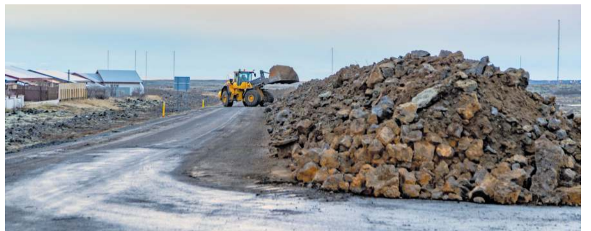
Unnið að gerð varnargarðs og leiðigarðs við Nesveg, vestan byggðarinnar í Grindavík.

Næstu dagar fara áfram í mælingar og öflun frekari gagna ásamt greiningu þeirra. Úr þeim gögnum er m.a. verið að vinna reiknilíkön til að átta sig betur á aðdraganda atburðarins og leggja mat á líklega framvindu eldgossins. Eins er verið að bera saman atburðarrásina 18. desember við eldgosið sem hófst á sunnudag til að auka skilning á umbrotunum á svæðinu og leggja mat á hvaða sviðsmyndir eru líklegastar í framhaldinu.