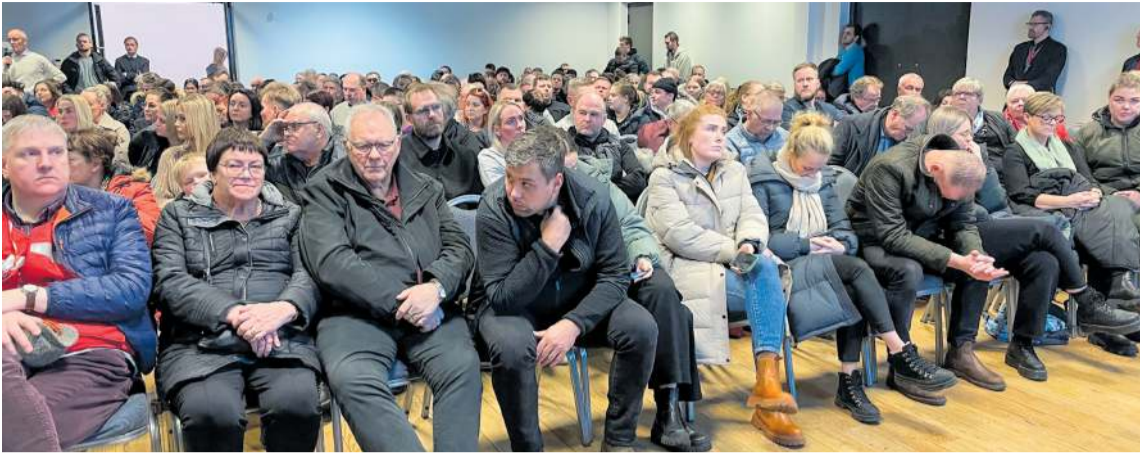
Íbúar Grindavíkur virðast margir á þeirri skoðun að ríkisvaldið kaupir af þeim eignirnar í Grindavík.