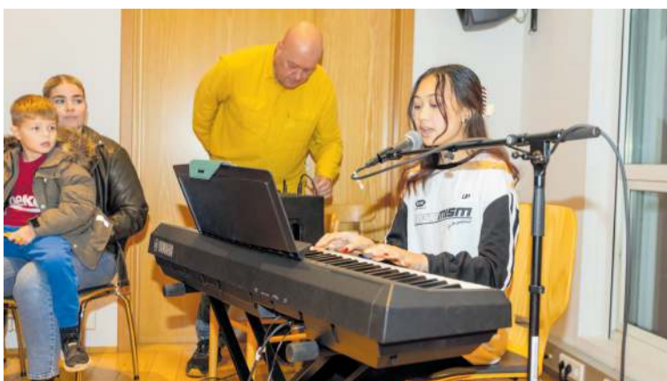
Boðið var upp á skemmtileg tónlistaratriði frá tónlistarskólunum í Suðurnesjabæ.