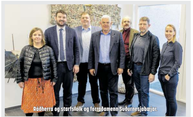
Ráðherra og starfsfólk og forráðamenn Suðurnesjabæjar.