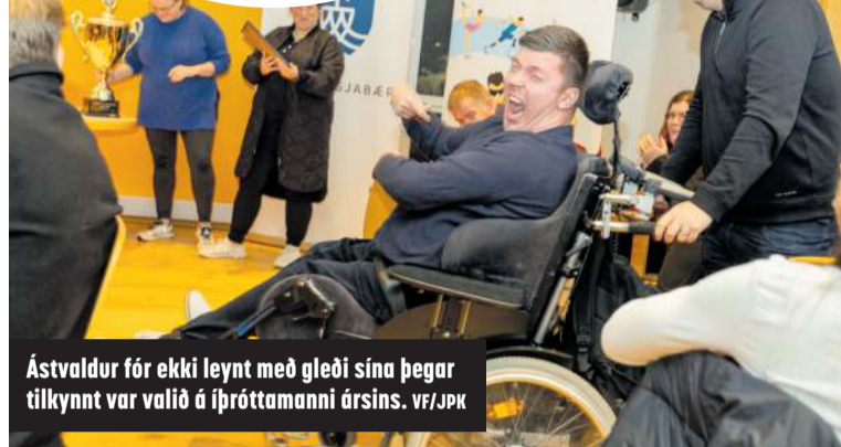
Ástvaldur fór ekki leynt með gleði sína þegar tilkynnt var valið á íþróttamanni ársins.