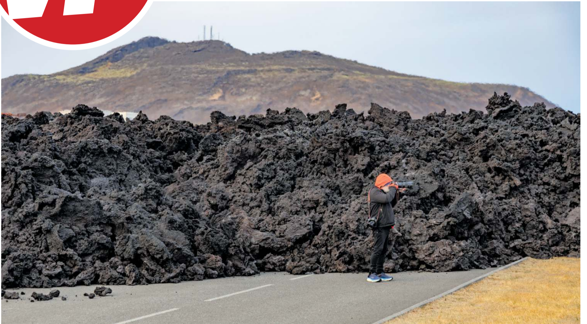
Sólarhingsgamall hraunveggurinn í Efrahópi í Grindavík.

MIDVIKUDAGUR 17. JANÚAR 2023 // 3. TBL. // 45. ÁRG.