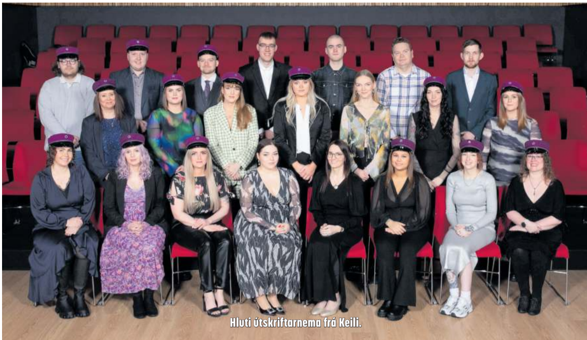
Hluti útskriftarnema frá Keili.