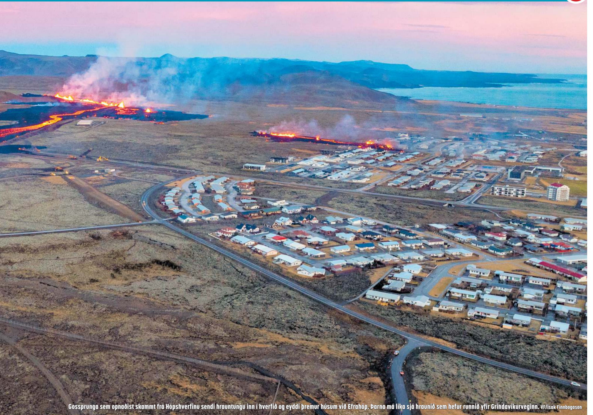
Gosprunga sem opnaðist skammt frá Hópshverfinu sendi hrauntungu inn í hverfið og eyddi þremur húsum við Efrahóp. Þarna má líka sjá hraunið sem hefur runnið yfir Grindavíkurvegin.

verulega úr aflögun og nánast stöðvaðist eftir því sem líða fór á daginn, einkum við Hagafell og norðan þess. Enn mælist þó aflögun innan Grindavíkur en hún fer minnkandi, segir í tilkynningu Veðurstofunnar kl. 18:45 á sunnudagskvöld. Minnkandi aflögun er talið vera merki þess að kvikuþrýstingur sé að ná jafnvægi. Ekki er þó útilokað að fleiri gossprungur myndist.