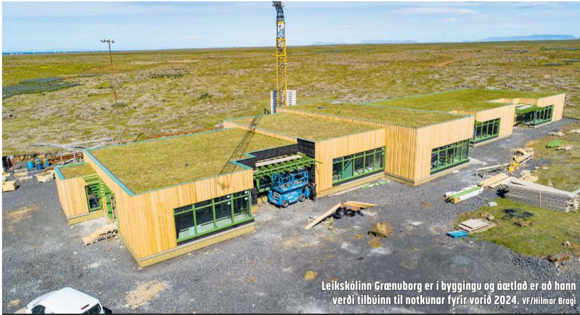
Leikskólinn Grænuborg er í byggingu og áætlað er að hann verði tilbúinn til notkunar fyrir vorið 2024.