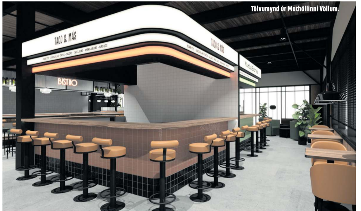
Tölvumynd úr Mathöllinni Völlum.