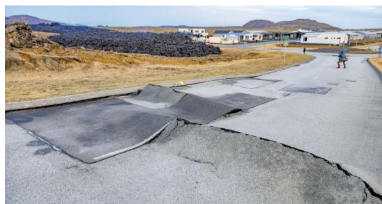
Viða um Grindavík eru skemmdir á gatnakerfinu vegna jarðhræringa.

Út frá mælingum hefur glíðnun innan bæjarmarkanna verið allt að 1,4 metrar síðasta sólar-