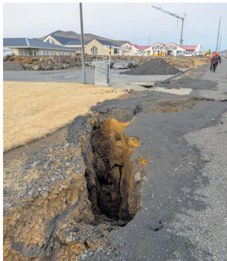
Djúpar sprungur eru víða um Grindavík. Þessi er í Hópshverfinu.