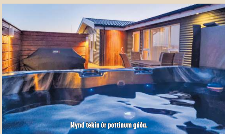
Mynd tekin úr pottinum góða.

viku svo það hefur farið ágætlega saman. Skólastarfið er komið í fastar og góðar skorður núna í safnskólunum, ég myndi segja að þetta sé að ganga mjög vel. Þjálfunin hefur líka gengið vel en auðvitað er hópurinn tvístraður út um allt svo ég hef brýnt fyrir mínum leikmönnum að þegar við keppum, séum við að berjast fyrir Grindavík. Í öllum þessum tilfinningarússibana að undanförunu hef ég reynt að forðast að vera reiður en ætli hún muni ekki blossa upp og ég rekin út úr húsi næst þegar liðið mitt er að keppa,“ sagði Unndór að lokum.