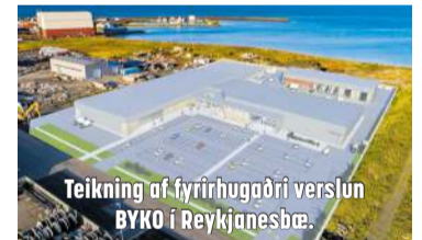
Teikning af fyrirhugaðri verslun BYKO í Reykjanessbæ.

„Í BYKO erum við meðvituð um mikilvægi þess að taka virkan þátt í samfélaginu og leggja okkar af mörkum til að bæta lífsgæði Íslendinga. Með ákvörðun okkar um að halda verði stöðugu næstu sex mánuði, viljum við ekki aðeins sýna ábyrgð okkar sem leiðandi fyrirtækis, heldur einnig vera hluti af lausninni í baráttunni gegn verðbólgunni, í samræmi við áherslur