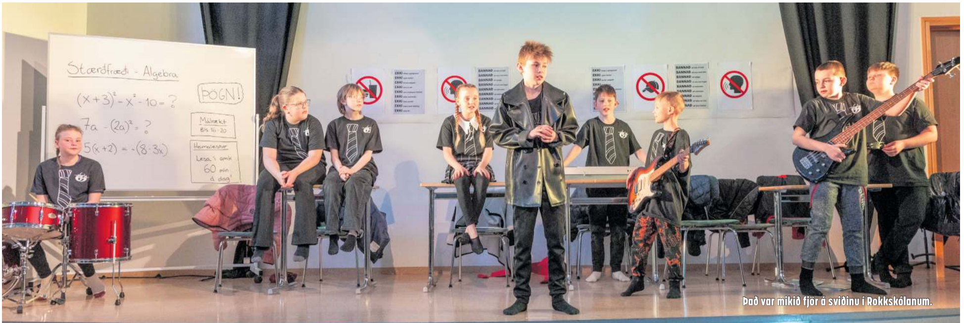
Það var mikið fjór á sviðinu í Rokkskólanum.