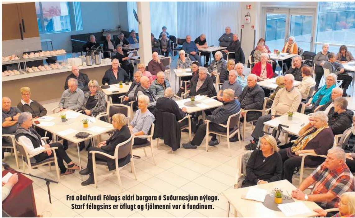
Frá aðalfundi Félags eldri borgara á Suðurnesjum nýlega. Starf félagsins er öflugt og fjölmenni var á fundinum.

Ekki mörgum árum eftir samningu Keflavíkur og Njarðvíkur þar sem Reykjanesbær varð til var ákveðið að byggja við krúndjásn Njarðvíkur, sjálfan Stapann. Ekki þótti við hæfi að húsið fengi að heita áfram Stapi, heldur var höllin skírð eftir ástkærustu hljómsveit bítlatímabilsins, Hljómum. Hljómahöllin. Nafngiftin var réttlætt með því að Stapinn væri samkomuhúsið en í Hljómahöllinni væri svo miklu meira. Nefnilega rokksafn. Frábær hugmynd og að mínu mati er Rokksafnið rós í hnappagat Reykjanesbæjar. En eins og hjá flestum söfnum þarf það meðgjöf. Miðasala stendur ekki undir rekstrarkostnaði. En það sama á líka við um sundlaugarnar í bænum. Miðasala þar stendur ekki undir rekstrarkostnaði. Það má vel vera að rekstur sundlauga flokkist undir skyldustarfsemi sveitarfélaga, en rekstur rokksafna geri það ekki. Frekar myndi ég fækka sundlaugum í sveitarfélaginu en að loka eina rokksafninu. Það er hvort eð er lítið hægt að treysta á hitaveitu næstu misserin. Í nýjustu sundlauginni í Reykjavík í Úlfarsárdal er bókasafn í anddyrinu. Því legg ég til að bókasafnið verði flutt í Vatnaveröld. Bæjarstjórn getur fengið Dag B Eggertsson sem ráðgjafa við flutningana.