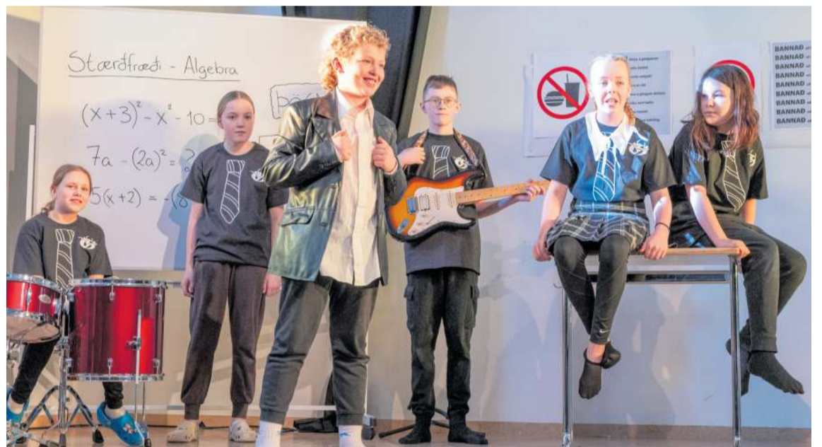
Krakkarnir voru úr þriðja til sjötta bekkjar í Sandgerðisskóla.