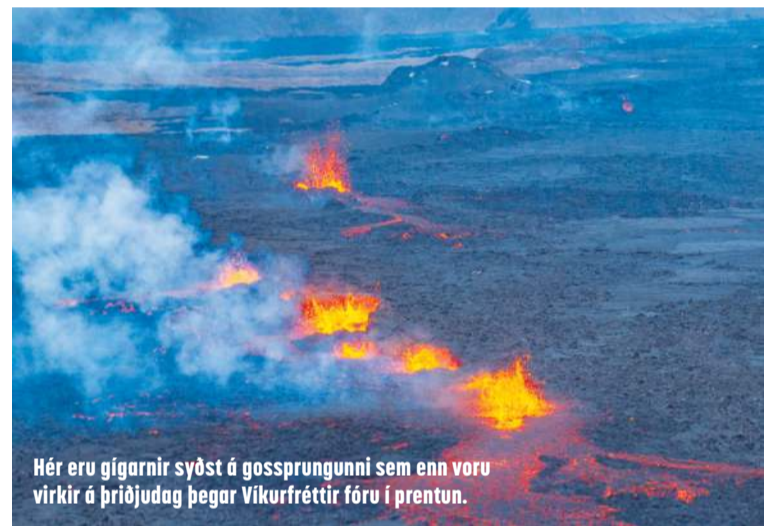
Hér eru gígarnir syðst á gossprungunni sem enn voru virkir á þriðjudag þegar Vikurfréttir fóru í prentun.

Næsta eldgos á Reykjaneskaganum hófst í Meradölum í Fagra-