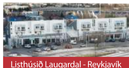
Listhúsið Laugardal - Reykjavík