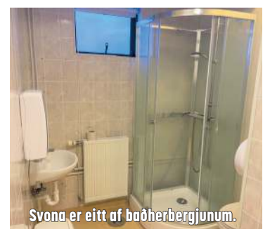
Svona er eitt af baðherbergjunum.