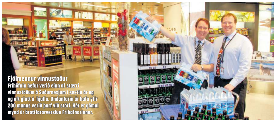
Fjölmenur vinnustaður Fríhöfnin hefur verið einn af stærri vinnustöðum á Suðurnesjum í sextíu ár og oft glatt á hjalla. Undanfarin ár hafa yfir 200 manns verið þarf við störf. Hér er gömul mynd úr brottfararverslun Fríhafnarinnar.