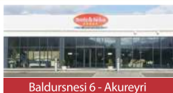
Baldursnesi 6 - Akureyri

Listhúsinu Laugardal - Sími 581 2233 | Baldursnesi 6, Akureyri Opið virka daga kl. 10:00 - 18:00 | Laugardaga 12:00 - 16:00