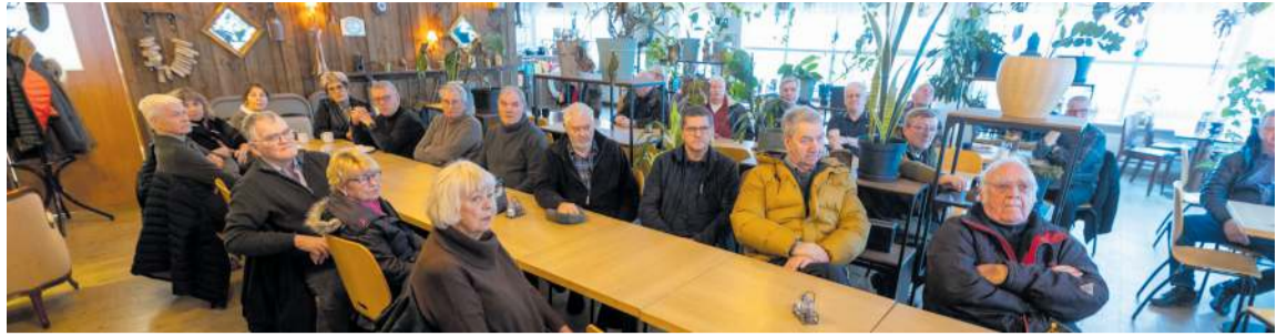
Frá sagnastund á Garðskaga síðasta laugardag. Stundirnar eru að jafnaði haldnar einu sinni í mánuði.