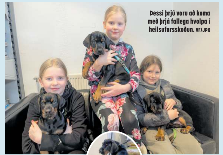
Þessi þrjú voru að koma með þrjú fallega hvalpa í heilsufarsskoðun.

fjölgað verulega samfara fólksfjölgun á svæðinu. Svo varð mikil aukning í Covid þegar næstum allir fengu sér félag,“ segir Helgi. „Stofan var fyrst á Hringbraut en árið 2008 flutti hún upp á Flugvelli og var þar þangað til að við fluttum í núverandi húsnæði í byrjun árs 2016. Við höfum reynt að gera aðstöðuna eins heimilislega og kostur er, enda á dýrunum og eigendum þeirra að líða vel hjá okkur.“