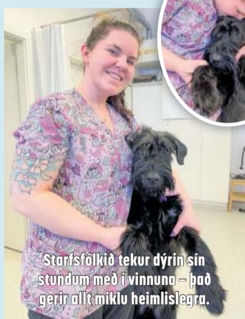
Starfsfólkið tekur dýrin sín stundum með í vinnuna – það gerir allt miklu heimilislega.

„Síðan þá hefur stofan vaxið og dafnað enda hefur gæludýrum