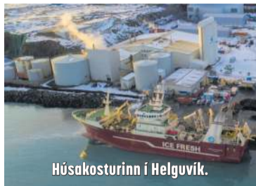
Húsakosturinn í Helguvík.

Sú saltfiskvinnsla sem verður í Helguvík, er öðruvísi en vinnslan í Grindavík og má segja að horft verði til fyrri tíðar þegar vinnsla hefst þar. „Þetta er sú vinnsluáferð sem var mest notuð í fiskvinnsluhúsum í Grindavík og víðar lengst af síðustu öld. Enn