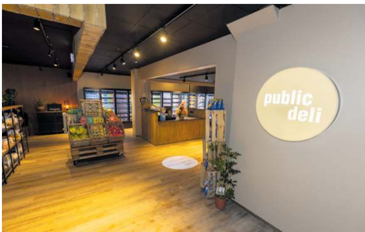
Vel hefur tekist til við innréttingar staðarins og verslunarinnar.