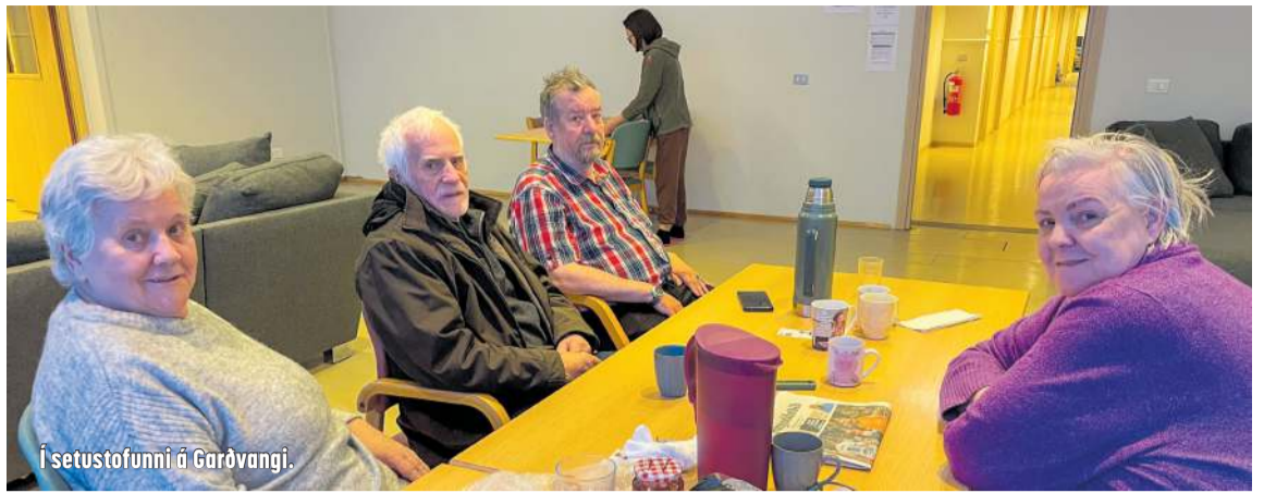
Í setustofunni á Garðvangi.