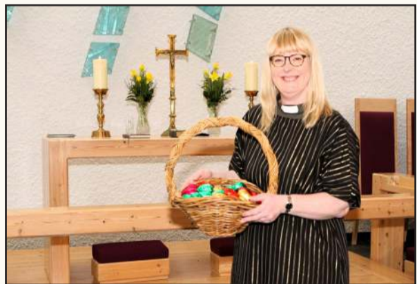
Skoðið nánar á heimasíðu kirkjunnar www.arbaejarkirkja.is

Fimmtudaginn (Skírdag) 28. mars kl. 11.00