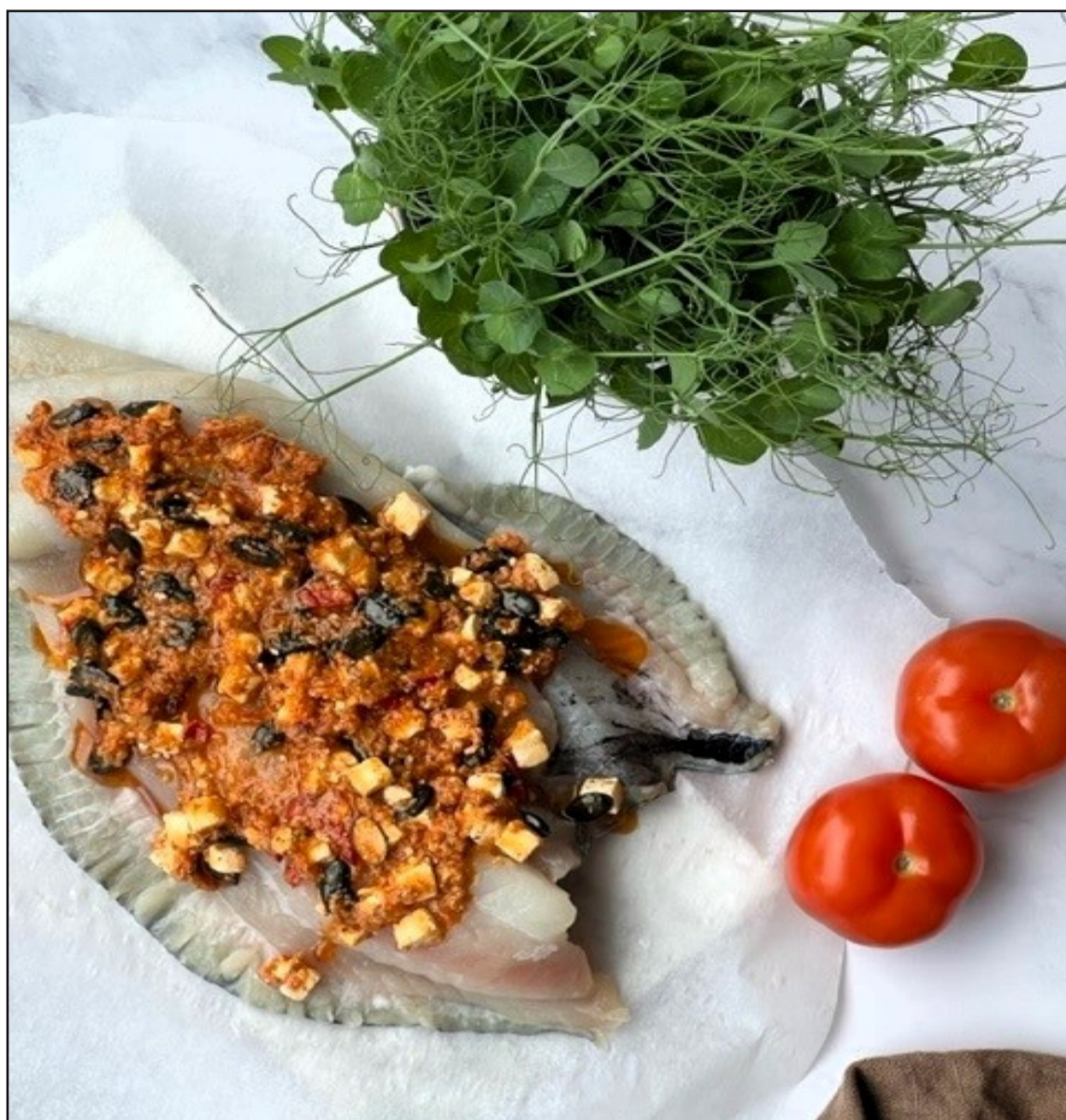
Rauðsprettan er með því besta sem hægt er að hugsa sér þegar fiskur er annars vegar.

Öllu nema fiskinum blandað saman í skál svo úr verður dásamdar pestó.