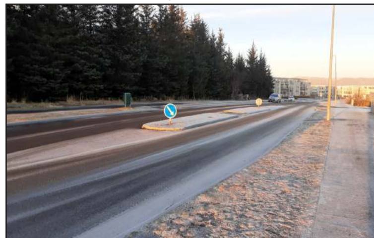
Göngubrúverun við Bugðu. Þarna þarf að koma fyrir gangbraut með skýrum merkingum og lýsingu.