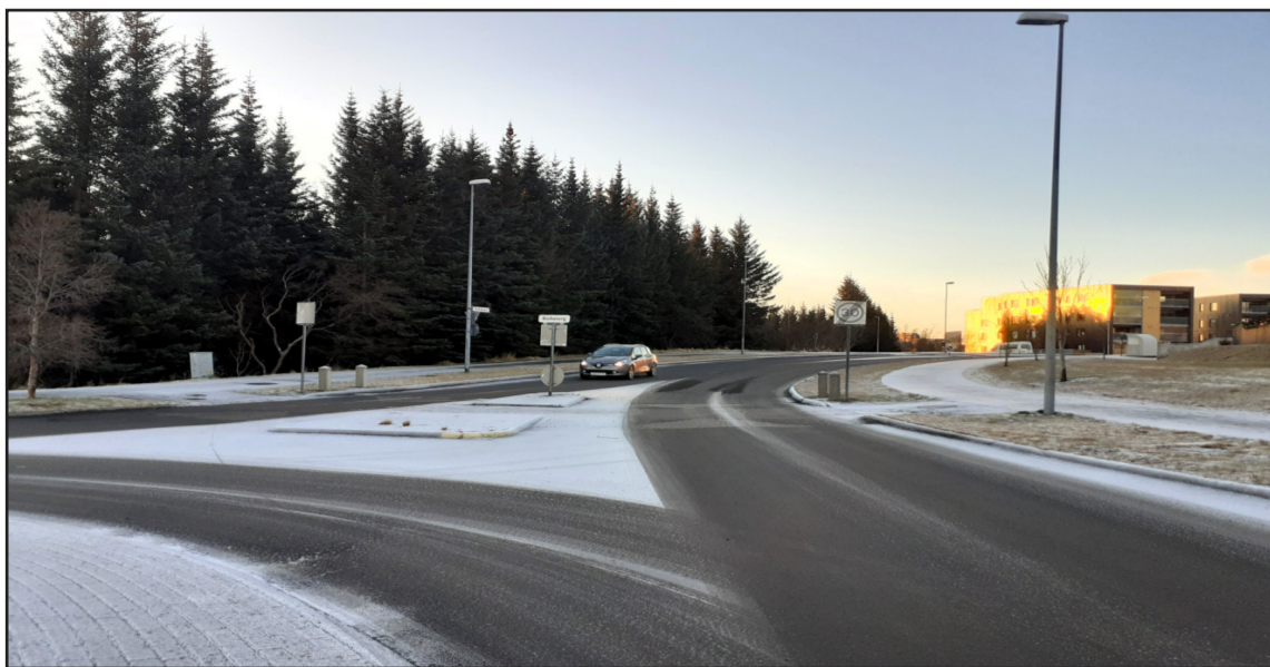
Gangbraut á Elliðabraut við Búðatorg. Þarna þarf að bæta merkingar og lýsingu.