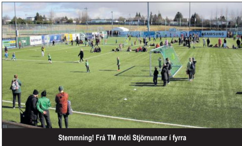
Stemming! Frá TM móti Stjórnunnar í fyrra

Þetta er 14 árið sem mótið fer fram, en keppt er í 6., 7. og 8. flokki karla og kvenna og er spilaður 5 manna bolti, en þátttakendur koma að stærstum hluta af höfuðborgarsvæðinu en einnig víðsvegar af landinu. Það sem hefur meðal annars gert mótið svona vinsæla er að viðvera hvers liðs er ekki meira en tvær klukkustundir, því stutt er á milli leikja. Úrslit leikja er ekki skráð, en liðunum er raðað í fjóra styrkleikaflokkar