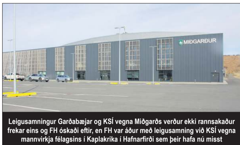
Leigusamningur Garðabæjar og KSÍ vegna Miðgarðs verður ekki rannsakaður frekar eins og FH óskaði eftir, en FH var áður með leigusamning við KSÍ vegna mannvirkja félagsins í Kaplakrika í Hafnarfirði sem þeir hafa nú misst

2. Í erindinu er rakið að KSÍ hefði sumarið 2022 óskað eftir tilboðum um leigu á æfinga- aðstöðu fyrir landslið Íslands veturinn 2022-2023. Í kjölfarið, þann 4. október 2022, hefði KSÍ gert samning við Garðabæ um af not á fjölnota íþróttahúsinu Miðgarði í Garðabæ í þrjú ár, eða til 31. mars 2025. Byggir FH á því að Garðabær haf í beitt skaðlegri undirverðlagningu í sínu tilboði og óskaði eftir því að Samkeppniseftirlitið tæki málið til skoðunar. Því til stuðnings var vísað til verðmunar á gjaldskrá Garðabæjar og þess verðs sem Garðabær bauð KSÍ. Samkvæmt uppgjöfinni verðskrá Garðabæjar, sem FH afhenti Samkeppniseftirlitinu, var það verð sem Garðabær bauð KSÍ um 34% af verði skv. fullri verðskrá fyrir leigu á Miðgarði. Byggir kvartandi kröfur sínar á 10. gr. og 16. gr. samkeppnislaga og fer fram á að eftirlitið gripi til aðgerða á grundvelli b-liðar 1.mgr. 16. gr. samkeppnislaga. Samkvæmt ákvæðinu getur eftir-