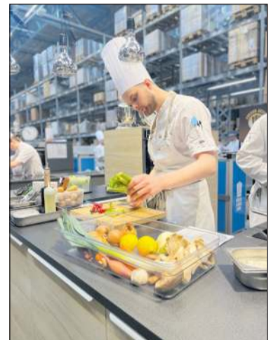
Dómarar og þátttakendur að störfum