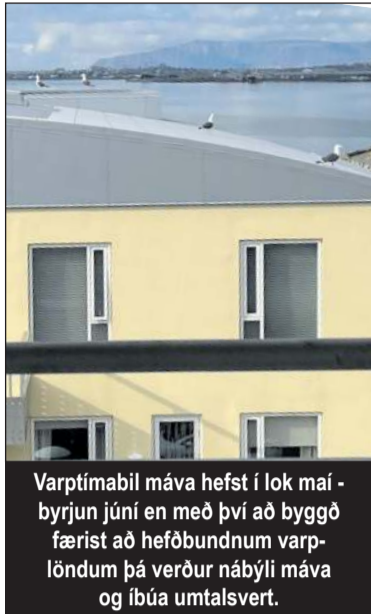
Varp tímabil máva hefst í lok maí - byrjun júní en með því að byggð færast að hefðbundnum varplöndum þá verður náþýli máva og íbúa umtalsvert.

Þegar varptími Máva hefst geta íbúar gripið til ýmissa aðgerða. Íbúar eru hvattir til þess að fylgjast með þökum sínum og öðrum stöðum sem mávar gætu nýtt sem varpstaði eða set staði. Húsfélög eru hvött til að standa saman að því að vakta húspök á fjölbýlishúsum.