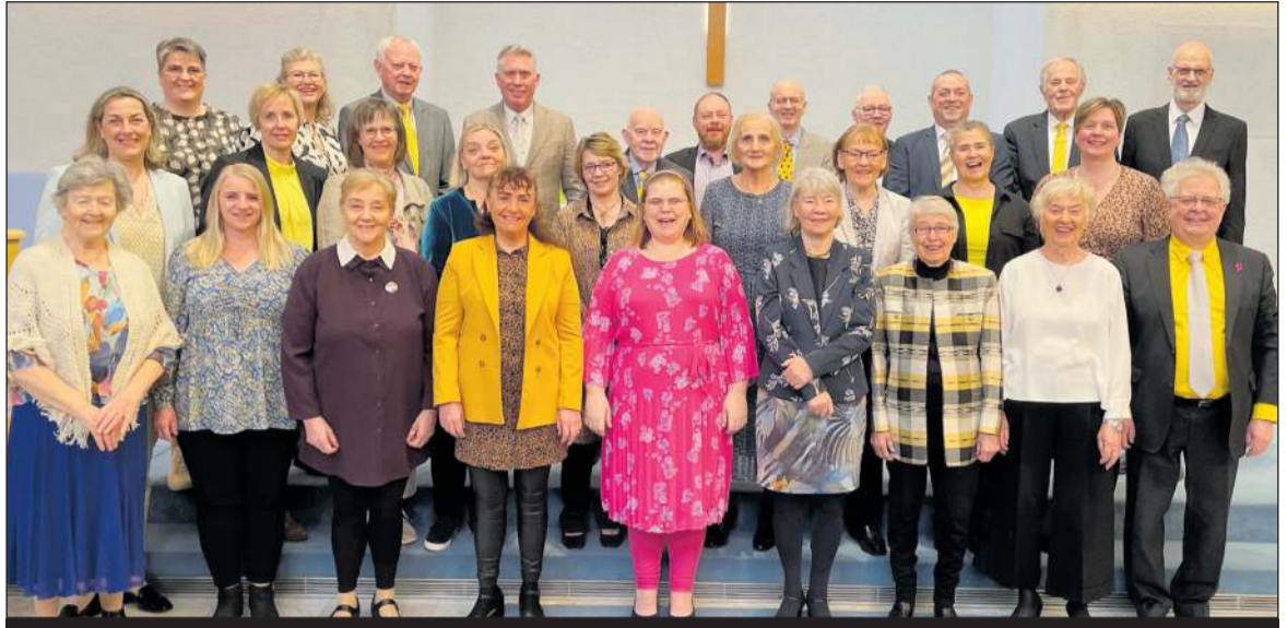
Kór Vídalínskirkju er á leiðinni í menningar- og söngferð til Búdapest í Ungverjalandi dagana 10.-17. júní

Kór Vídalínskirkju hyggst leggja land undir fót dagana 10.-17. júní n.k. í menningar- og söngferð til Búdapest í Ungverjalandi. Verið er að dusta rykið af fyrri áformum kórsins frá árinu 2020 að halda til Ungverjalands en vegna Covid-19 faraldursins þurfti að hætta við þá ferð á síðustu stundu.