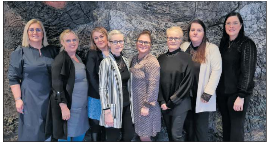
Skipulagsnefnd námsstefunnar 2024: Leikskólastjórar og aðstoðarleikskólastjórar á Heilsuleikskólanum Holtakoti á Álftanesi, Heilsuleikskólanum Garðaseli í Reykjaneshæ, Heilsuleikskólanum Heiðarseli í Reykjaneshæ og Heilsuleikskólanum Skógarási í Reykjaneshæ