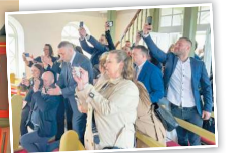
Sera Baldur segir helstu breytinguna sem hann tók eftir vera þá að nú séu ekki fengnir ljósmyndarar til að taka myndir af fermingarbörnunum, foreldrar sjá um það sjálfir í dag.