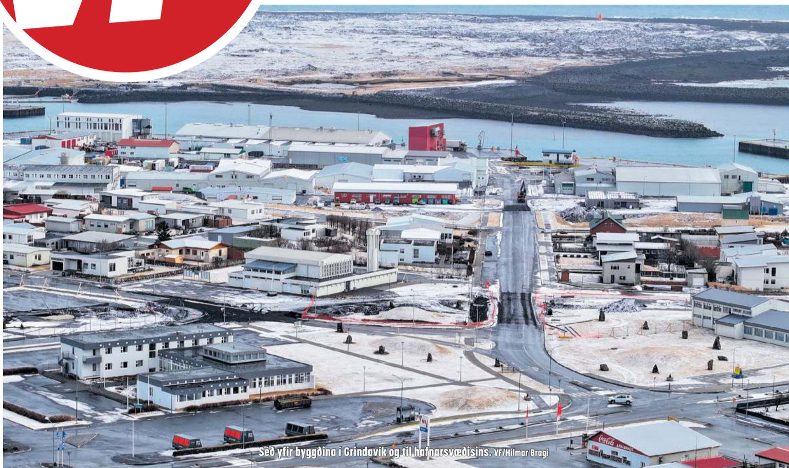
Séð yfir byggðina í Grindavík og til hafnarsvæðisins.

MIDVIKUDAGUR 13. MARS 2024 // 11. TBL. // 45. ÁRG.