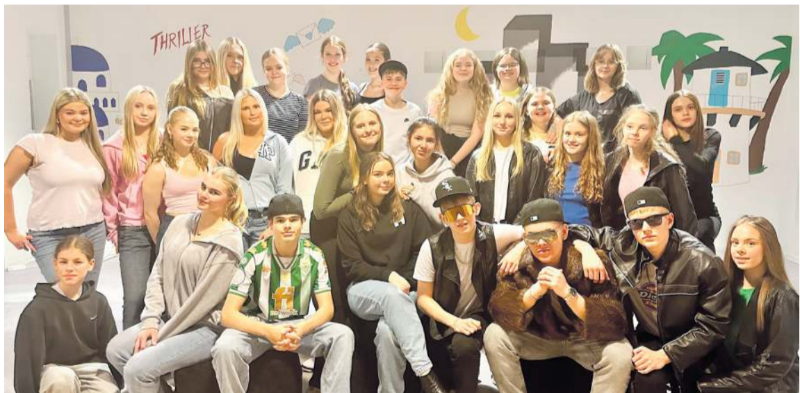
Leikhópur Heiðarskóla sem tekur þátt í uppfærslunni á afmælissýningunni.