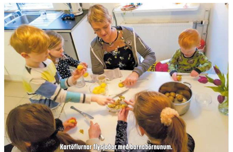
Kartöflurnar flysjaðar með barnabörnunum.