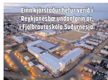
Einn kjörstaður hefur verið í Reykjanesbæ undanfarið ár, í fjölbrautaskóla Suðurnesja.