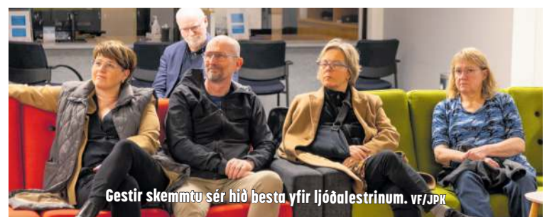
Gestir skemmtu sér hið besta yfir ljóðalestrinum.

Skáldasúð er styrkt af Uppbyggingarsjóði Suðurnesja.