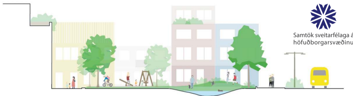
Samtök sveitarfélaga á höfuðborgarsvæðinu

Unnið verður í umsóknum jafnóðum og þær berast.