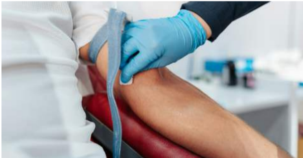
Til að mæla PSA-gildi þarf að fara í blöðrupruferð hjá lækni.

Brottnám: Gerð eru nokkur lítil göt á magann, farið inn í hann