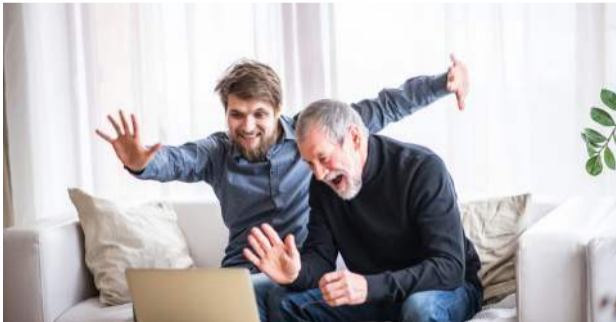
Markmið Framfarar er meðal annars að stuðla að auknum lífsgæðum hjá körlum sem greinast með krabbamein í blöðruhálskirtli og þeirra helstu aðstandendum.