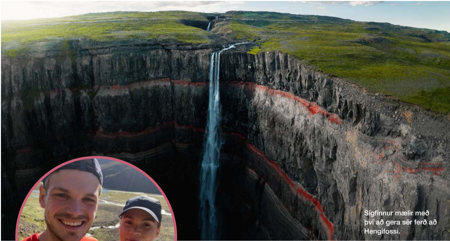
Sigfinnur mælir með því að gera sér ferð að Hengifossi.