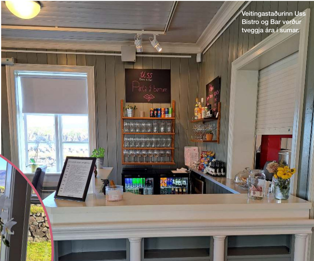
Veitingastaðurinn Uss Bistro og Bar verður tveggja ára í sumar.