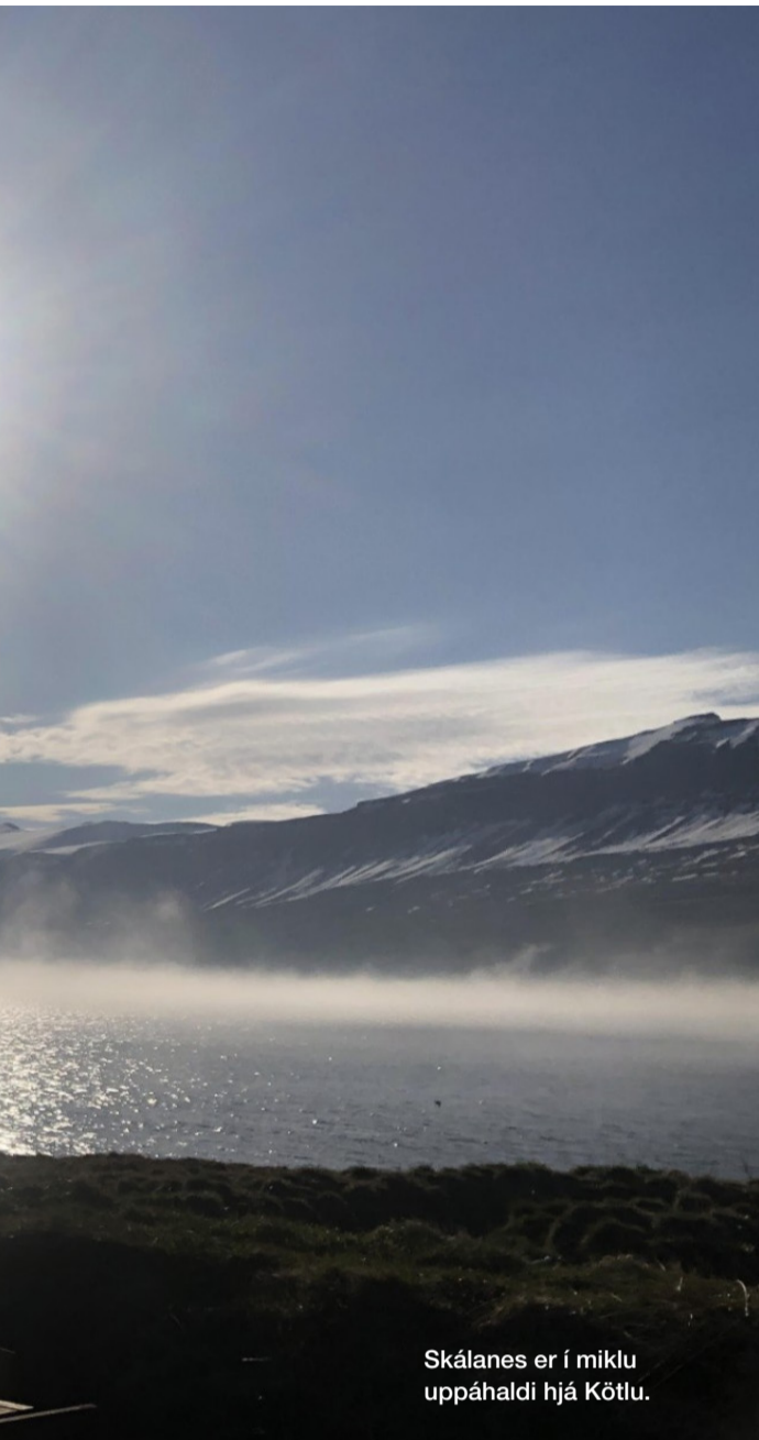
Skálanes er í miklu uppáhaldi hjá Kötlum.

bæjarstæðin og náttúran allt í kring á þessum stöðum er afskaplega falleg. Bæirnir smáir en bjóða upp á margþætta og fjölbreytta afþreyingu. Það er augljóst stolt, væntumþykja og alúð lögð í bæjarbraginn hjá þeim sem búa þarna.“