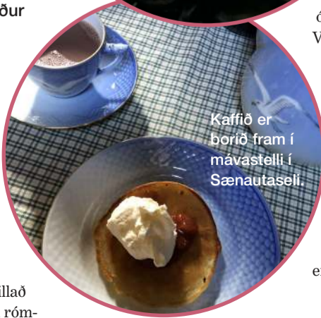
Kaffið er borð fram í mávastelli í Sænautaseli.