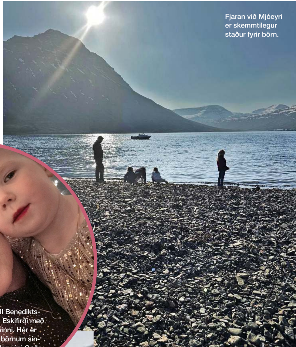
Fjaran við Mjóeyri er skemmtilegur staður fyrir börn.

göngutúr þar sem stutt er í fjöruna og smá klifur fyrir þá sem það vilja.“