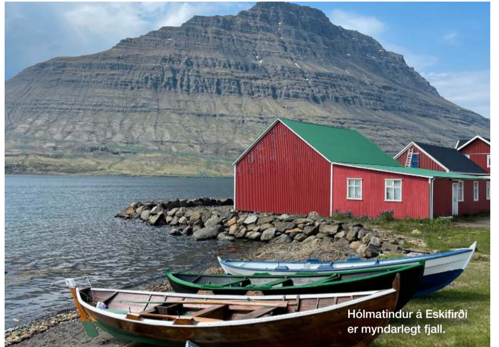
Hólmatindur á Eskifirði er myndarlegt fjall.

gönguleiðina. Nauðsynlegt er að vera á fjórhjóladrifnum bíl. Fyrst er gengið út fjallgarðinn, síðan niður bratta brekku alveg að Múlahöfn. Loks er gengið meðfram sjónum þar til komið er að útsýnisstaðnum þar sem Perriðbjarg blasir við. Ég mæli með því að fólk fari frá útsýnisstaðnum og alla leið niður á Langasand til að njóta fegurðarinnar enn betur. Gangan er í heildina um 11 km með 820 metra heildarhækkun.