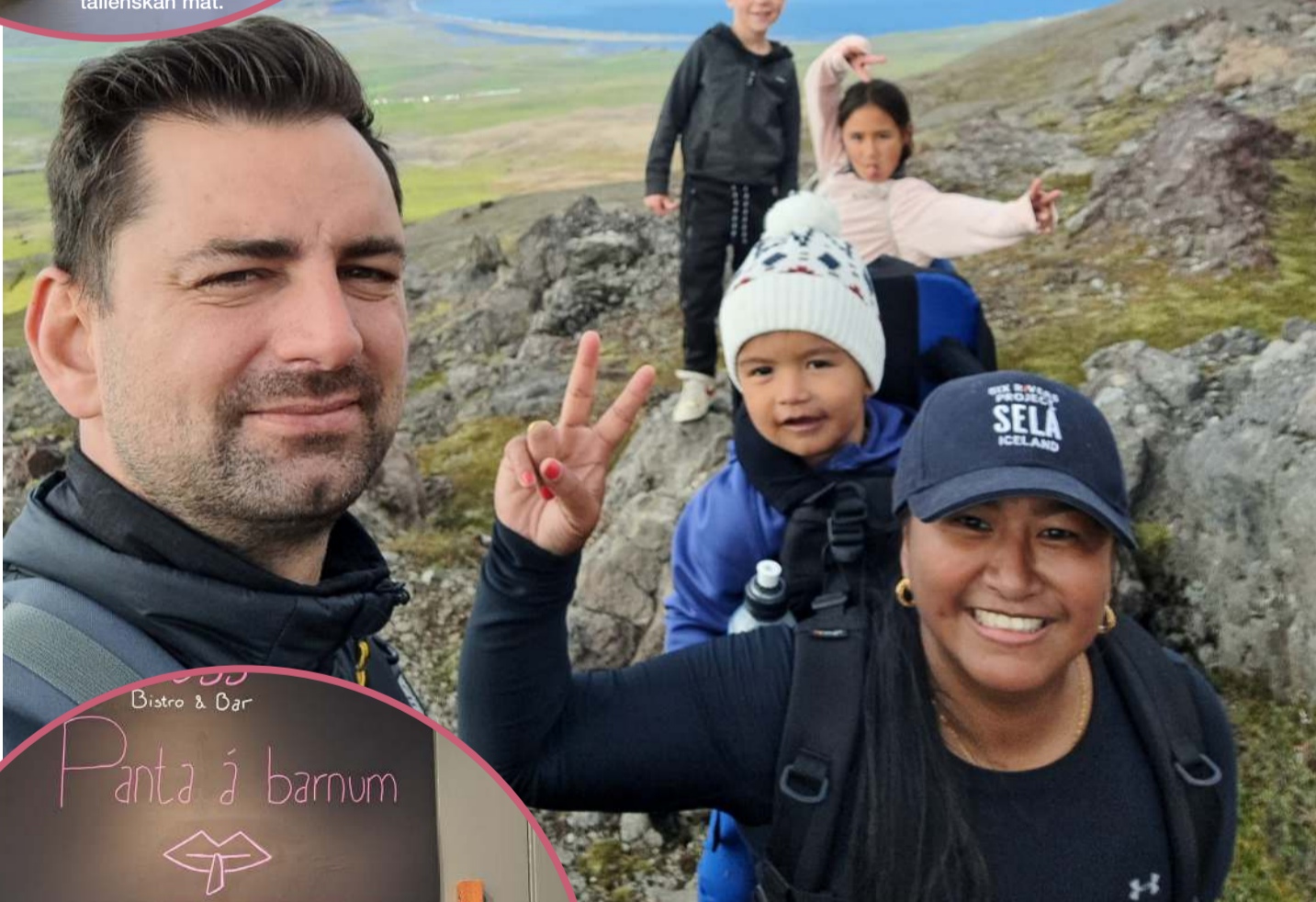
Selja í fjallgöngu með fjölskyldunni. Hún segir margar skemmtilegar gönguleiðir í nágrenni Vopnafjarðar.