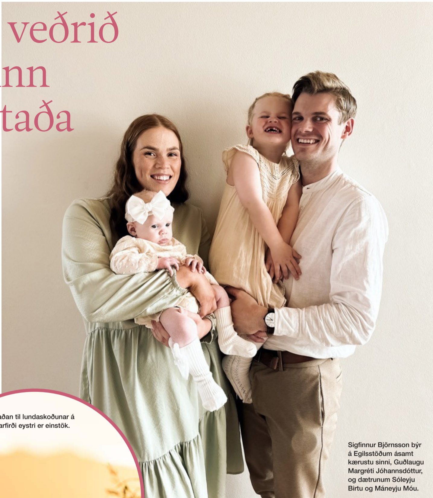
Aðstaðan til lundaskoðunar á Borgarfirði eystri er einstök.

„Í fyrsta lagi vaknar þú í 20 stiga hita í sól og