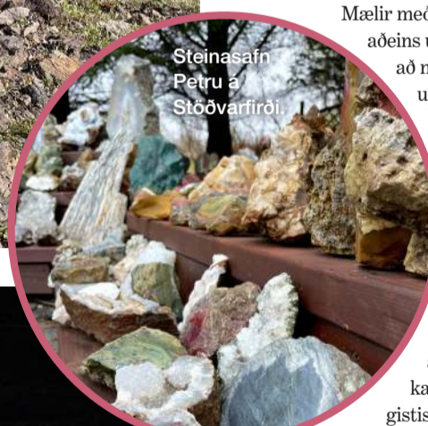
Steinasafn Petru á Stöðvarfirði.

Þegar hún er spurð hvar sé best að hvíla sig og hlaða batterín á svæðinu svarar hún ákveðin: Mjólfjörður. „Þar er mesta orku að finna þegar kemur að því að hlaða batterín, ekki síst síðsumars þegar berin eru komin. Að sitja í berjalyngi á góðum sumardeggi í fallegri brekku í Mjólfirði er ein sú besta hugleiðsla sem hægt er að hugsa sér,“ bætir hún brosandí við að lokum.