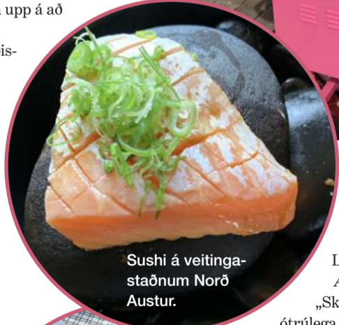
Sushi á veitingastaðnum Norð Austur.

„Á sumrin er það morgunkaffibollinn úti á palli í sólskini, krakkarnir í sundfötum leikandi sér með vatn og drullu, kötturinn malandi við hliðina á mér og fuglasöngurur allt í kring. Skógarferð upp í Hallormsstaðaskóg með nesti, buslað í Lagarfljóttinu, stoppað í ís á Egilsstöðum, keyrt aftur yfir Fjarðarheiðina, vinirnir hittir fyrir framan Hótel Öldu í spjall og spil. Grillað um kvöldið út með firði annaðhvort á róm-