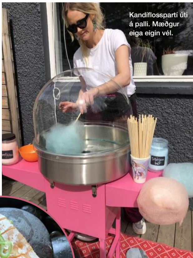
Kandífflosspartí úti á palli. Mæðgur eiga eigin vél.