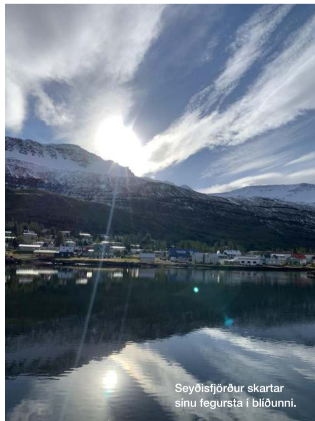
Seyðisfjörður skartar sínu fegursta í blíðunni.

antísku stefnumóti eða í góðra vina hópi. Kveiktur varðeldur, spilað á gítar og sungið. Já, eða kvöldinu eytt á góðum tónleikum eða menningarviðburði. Horft síðan á sólarlagið sitjandi á árbakkanum hjá Lóninu, vafin í teppi og alsæl með daginn.“ Áttu uppáhaldsnáttúruperlu og af hverju? „Skálanes mun alltaf hafa vinninginn þar í mínum huga, ótrúlega fallegur staður, sem og að labba upp með fossunum í Vestdalnum á Seyðisfirði. Mæli heils hugar með því.“