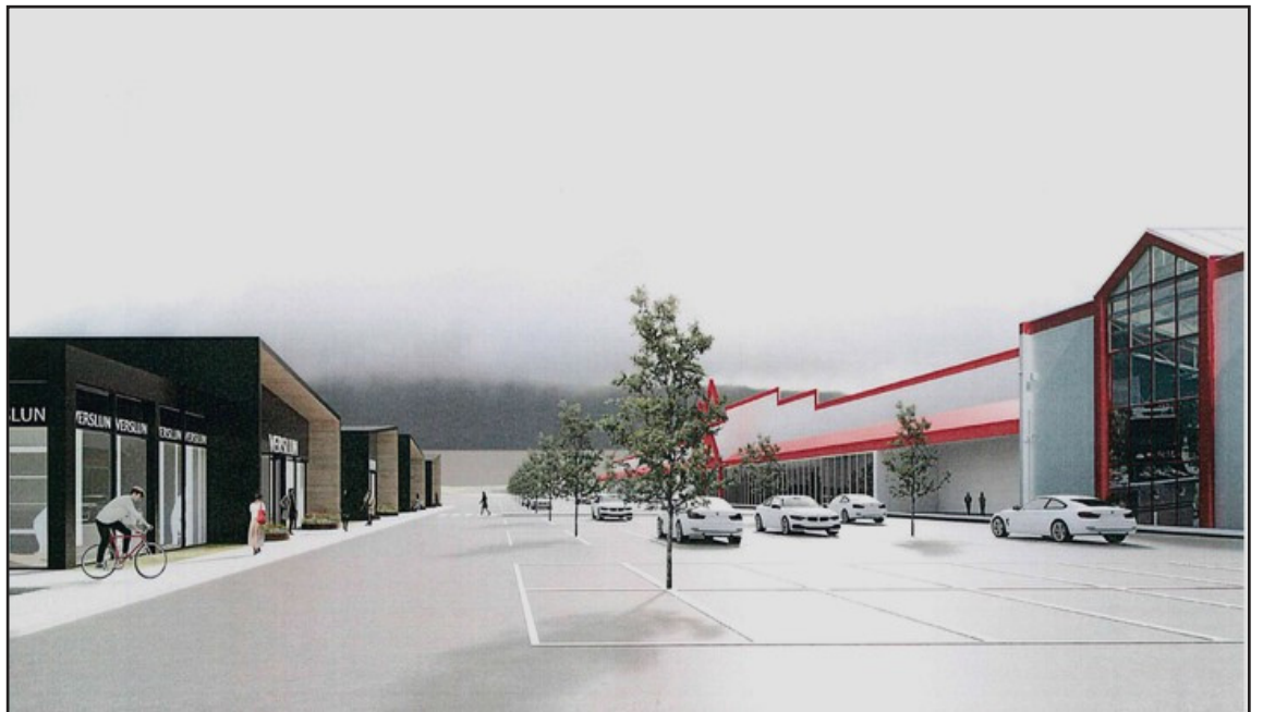
Tölvumyndir af fyrirhugaðri stórverslun á Bauhaus-reit.