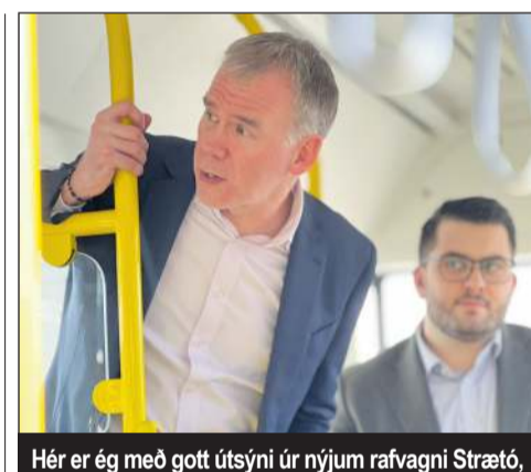
Hér er ég með gott útsýni úr nýjum rafvagni Strató, en ég hef einnig haft það fyrir sið að hlaupa um bæinn og fylgjast með framkvæmdum okkar og uppbyggingunni sem er á mikilli siglingu.