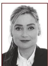
Kristín 699 0512

Staphrauni 5, Hafnarfirði Sími: 565 9775 www.uth.is - uth@uth.is