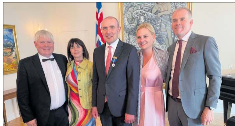
Móttaka á Bessastöðum. Forseti Íslands ásamt formanni Lkl. Álftaness, bæjarstjóra Garðabæjar og eiginkonum þeirra.