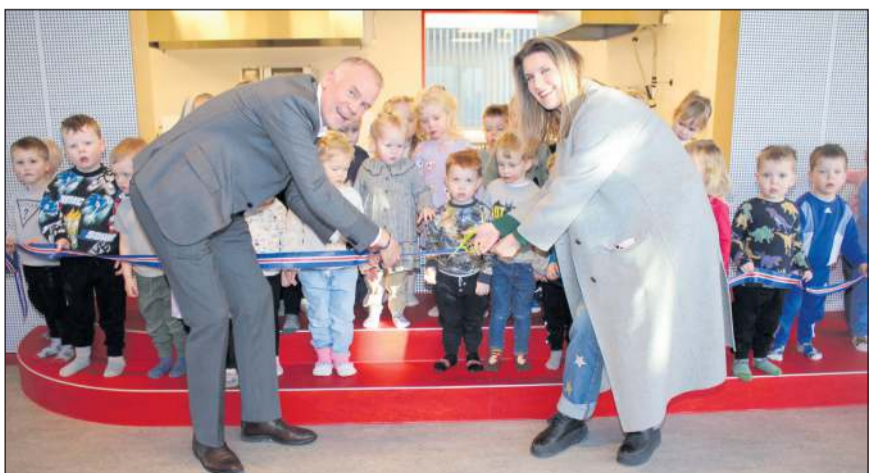
Urriðaból við Holtsvæg opnaði í vor, einn glæsilegasti leikskóli landsins. Sá þriðji sem við opnum á kjörtímabilinu, en fyrst opnaði Urriðaból við Kaupþún, svo leikskóladeild Sjálandsskóla.