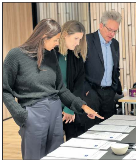
Fulltrúar í bæjarráði og fyrrverandi Bæjarritari rýna tilboð í byggingarrétt lóða í Hnoðraholti.