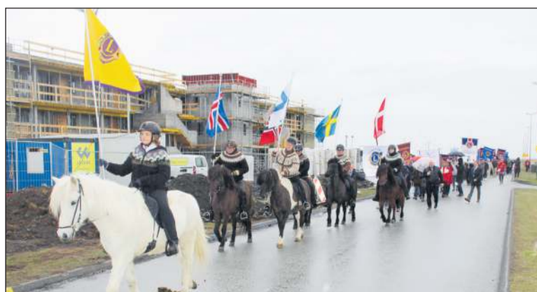
Við setningu Lionsþingsins. Fánaberar riðu í fararbroddi skrudgöngunnar