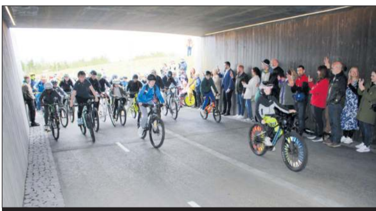
Á dögnum voru ný undirgöng á Arnarnesi vígd, en krakkar í Sjálandsskóla gerðu það á hjólunum sínum. Fjölmargar göngu og hjólaleiðir hafa verið teknar í gagnið undanfarin tvö ár.