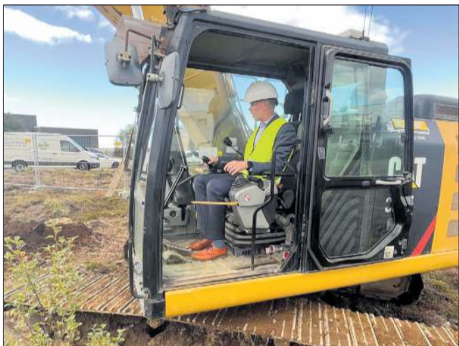
Skóflustunga fyrir búsetukjarna í Brekkúási 2. Hann opnaði haustið 2023 við mikla gleði.