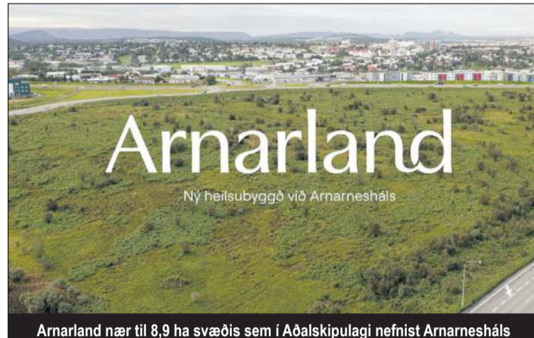
Arnarland nær til 8,9 ha svæðis sem í Aðalskipulagi nefnist Arnarnesháls