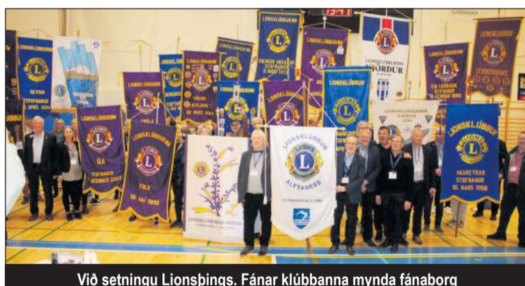
Við setningu Lionsþings. Fánar klubbanna mynda fánaborg

Lions er stærsta alþjóðlega þjónustuhreyfing heims. Í dag starfa yfir 1,4 milljónir Lionsfélaga í 46.000 klúbbum í 206 löndum.