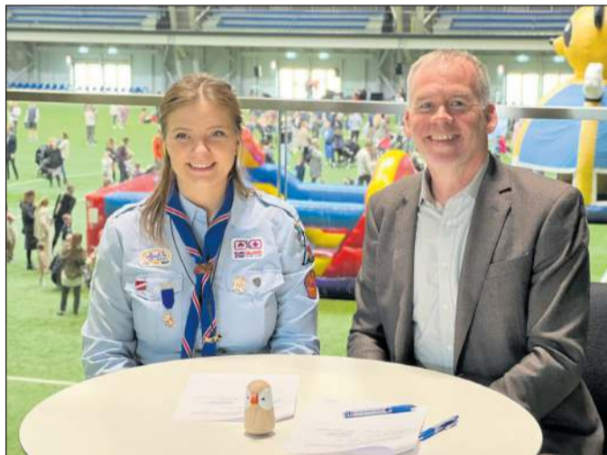
Miðgarður er frábært fjölnota íþróttahús. Á sumardaginn fyrsta var þar mikið um að vera og við gerðum samstarfssamning við Skátana. Við höfum lagt áherslu á gott samstarf við frjálsu félagsamtökin í bænum.