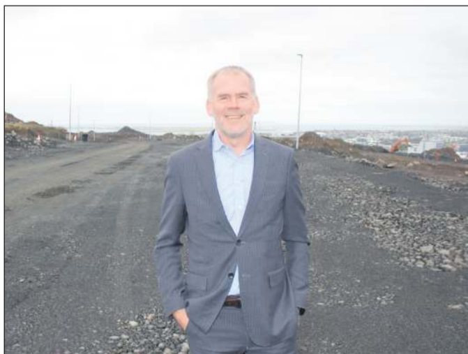
Uppbyggingin í bænum gengur vel. Hér er ég í Hnoðraholti en lóðir þar voru afar vinsælar þegar þær fóru á sölu. Sömuleiðis gengur uppbygging hverfa á Álftanesi mjög vel.