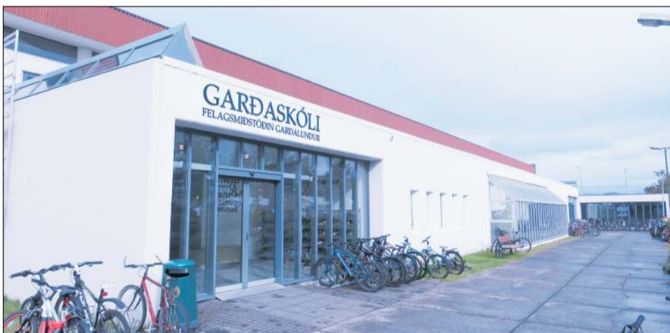
Mikil orka og áhersla hefur farið í endurbætt skólahúsnæðis í Garðabæ á síðustu tveimur árum. Við teljum okkur vera á góðum stað, en umfangsmiklar framkvæmdir eru í gangi í Garðaskóla.