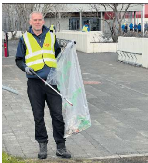
Plukkað á Álftanesi