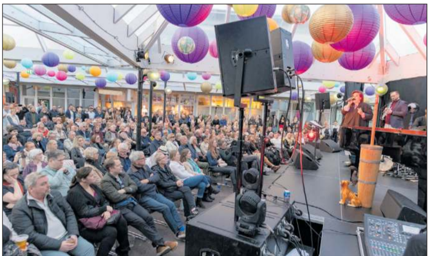
Jazzþorpið er komið til að vera og eflist áfram. Menningarstarf Garðabæjar er sterkt og margar aðrar hátíðir mætti nefna.