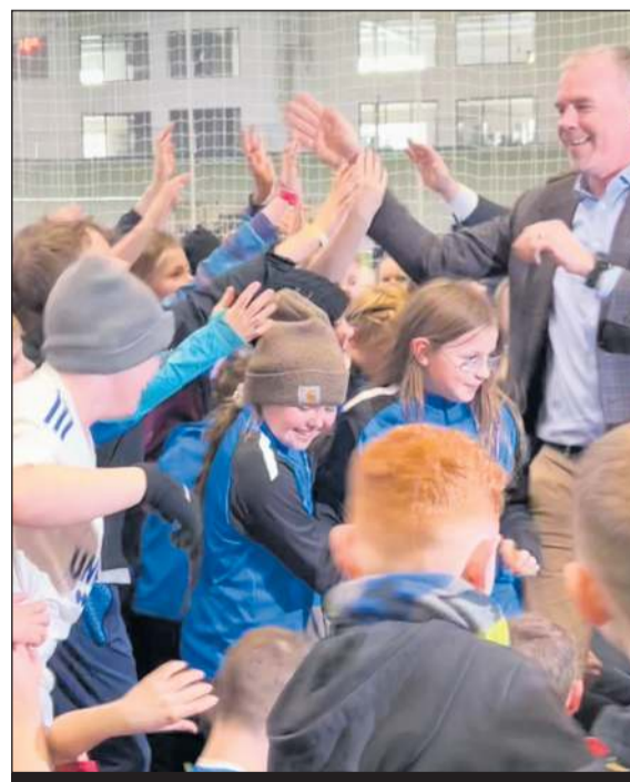
Þetta hefur verið skemmtilegur tími, einna skemmtilegast hefur samtalið við ungu kynslóð bæjarins verið. Þessir krakkar innsigliðu samning við Stjórnuna með fimmu!