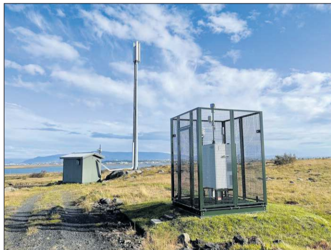
Loftgæðamælirinn okkar á Garðahrauni er byrjaður að mæla.