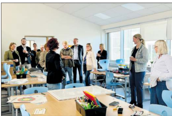
Heimsókn bæjarráðs í endurbætt húsnæði Álftanesskóla.