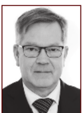
Hálf dán 898 5765