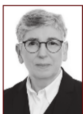
Ólöf 898 3075