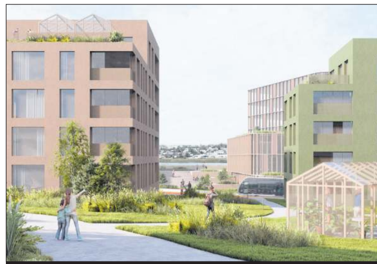
Samkvæmt tillögunni verður byggðin blanda af 3-6 hæða fjölbýlishúsum ásamt atvinnu-, verslunar og/eða þjónustuhúsnæði næst Hafnarfjarðarvegi

Vilja styrkja nærumhverfið og bæta lífsgæði þeirra sem sækja svæðið Meginmarkmið skipulagsins er að leggja grunn að öflugu borgarumhverfi sem styrkir nærumhverfið og bætir lífsgæði bæði þeirra sem sækja svæðið, starfa og búa á svæðinu og í nálægð við það. Helstu áherslur eru á starfsemi og uppbyggingu sem styður við virkan lífsstíl og blandaða byggð.