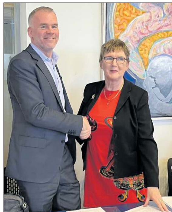
Samstarf Garðabæjar og FEBG hefur verið mjög farsælt. Við höfum einnig umbylt aðstöðu fyrir félagsstarf eldra fólks í bænum og í haust verður opnunartími Jónshúss lengri.