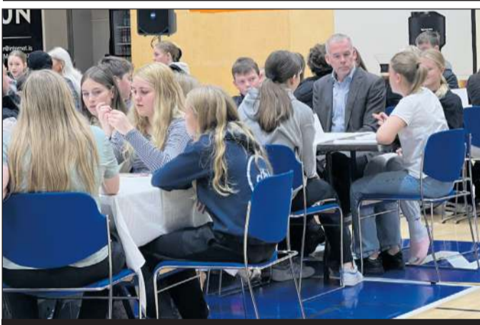
Ég laumaði mér inn á ungmennabýing í Ásgarði þar sem 100 ungmenni ræddu málefni bæjarins og lögðu línurnar. Ungmennaráð Garðabæjar og ÍTG vinna úr hugmyndum þeirra og koma í framkvæmd.