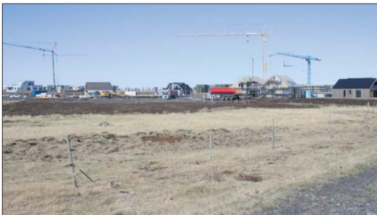
Samtals bærust 161 tilboð í byggingarétt lóða við Kumlamýri

Tilboðin verða skráð, flokkuð nánar og tekin til afgreiðslu á fundi bæjarráðs þriðjudaginn 11. júní 2024.