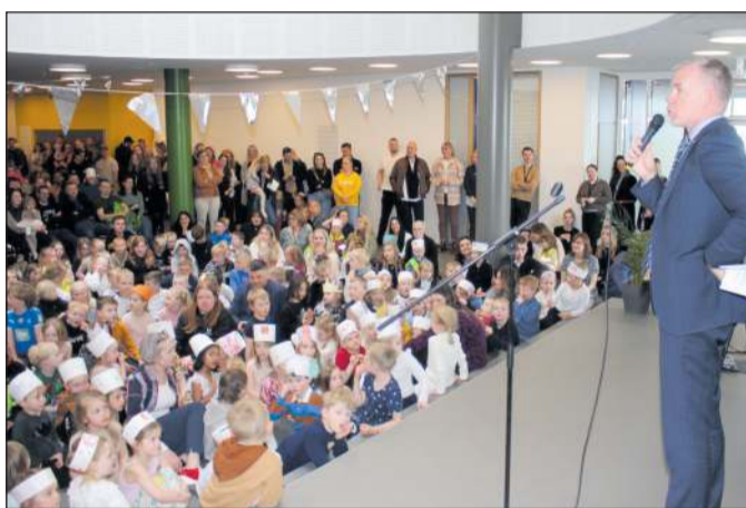
Vígsla Urriðaholtsskóla og sex ára afmæli. Nú er búið að taka annan áfanga í notkun og framkvæmdir við þann þriðja hefjast fljótlega.