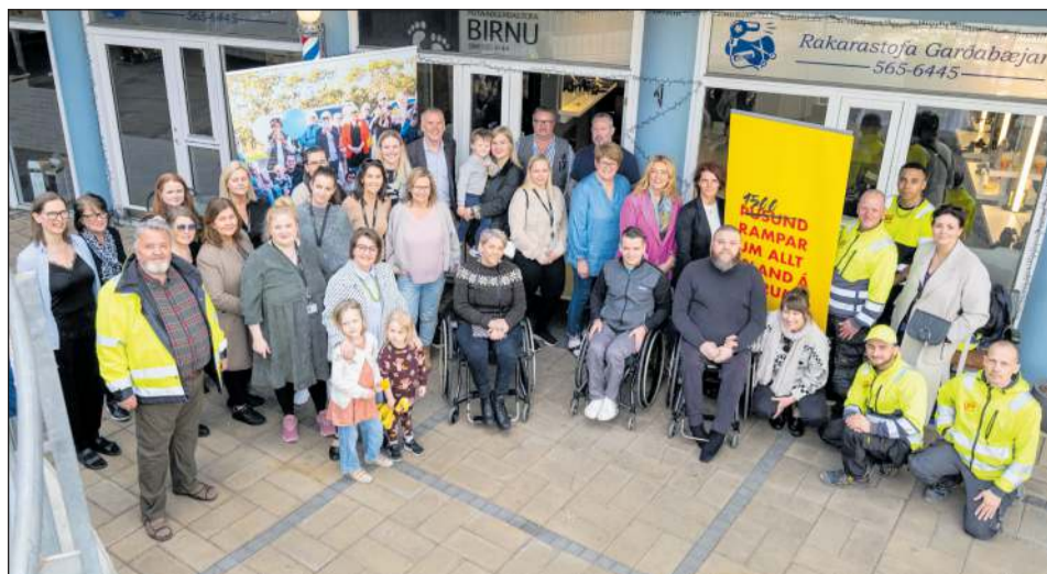
Vorið 2023 römuðum við upp Garðatorg. Rampur númer 450 á Íslandi er við Rakarastofu Garðabæjar.