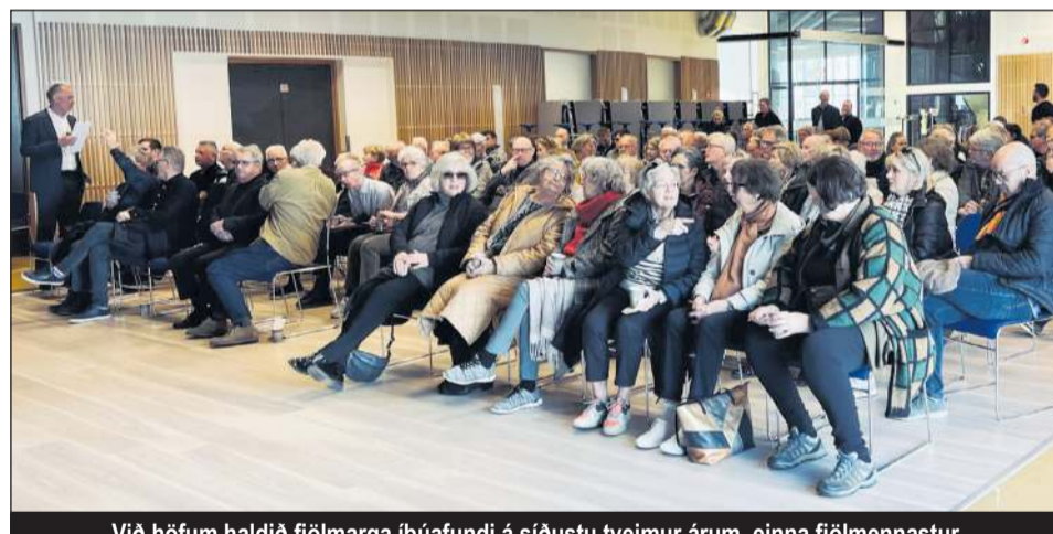
Við höfum haldið fjölmarga íbúafundi á síðustu tveimur árum, einna fjölmennastur og fjörugastur var þó fræðslufundur um máva í landi Garðabæjar. Íbúar hafa tekið höndum saman og sinnt sínu hlutverki vel í baráttunni við mávana.