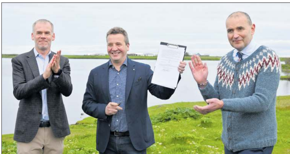
Fríðlýsing Bessastaðanes var góður áfangi. Nýverið fríðlýstum við einnig Urriðakotshraun.