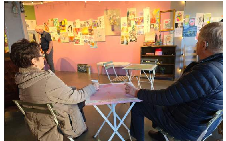
Haustsýning Gróskufélaga heldur áfram næstu tvær helgar og að sjálfsgöðu verður

heitt á könnunni og bakkelsi á borðinu. Þetta er nokkuð áhugaverð og óvenjuleg sýning þar sem skissur, flæðandi skemmtilegt upphengi og notaleg stemming og svo var boðið upp á ljóðupplestur sl. sunnudag. „Hér er ró og hér er friður og gott að setjast niður.“