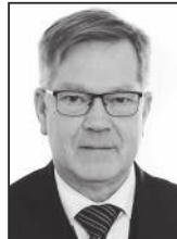
Hálfván 898 5765