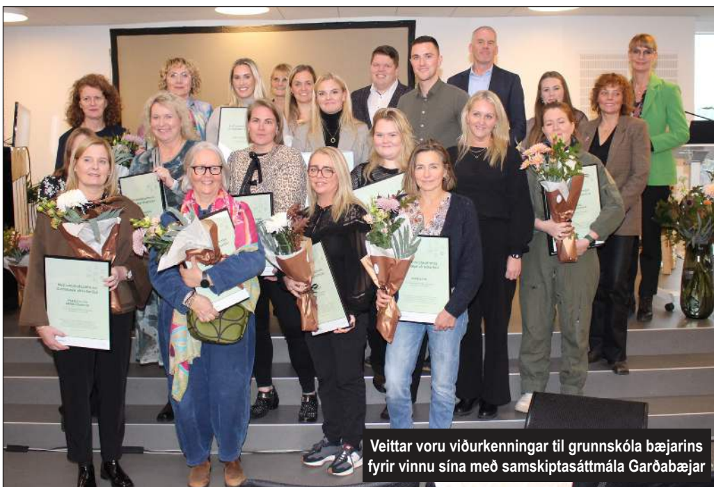
Veittar voru viðurkenningar til grunnskóla bæjarins fyrir vinnu sína með samskiptasáttmála Garðabæjar

Þá var komið að málstofum dagsins þar sem kennurum og starfsfólki í leik- og grunnskólum Garðabæjar gafst tækifæri á að hlýða á áhugaverð erindi um verkefni sem hlotið hafa styrki úr þróunarsjóðum leik- og grunnskóla í Garðabæ undanfarin ár.