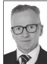
Jón 793 4455

Stapahrauni 5, Hafnarfirði Sími: 565 9775 www.uth.is - uth@uth.is