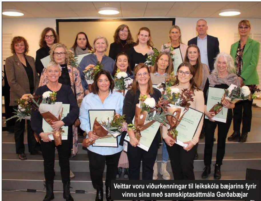
Veittar voru viðurkenningar til leikskóla bæjarins fyrir vinnu sína með samskiptasáttmála Garðabæjar