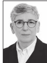
Ólöf 898 3075