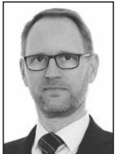
Frímann 897 2468