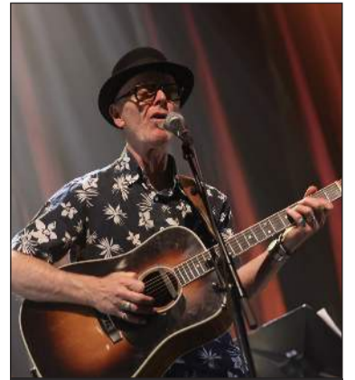
KK kemur fram á stórtónleikumunum