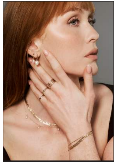
Módel með 14kt gull og demantskartgripri frá Lovísu/BY•L

Ög hönnun þín snýr ekki eingöngu að konum því þú hefur einnig hannað skart fyrir karlmann og Unisex - ekki rétt? „Jú, það er rétt, fyrsta herralínan okkar leit dagsins ljós í sumar. Línan í herraskartinu heitir Stormur og hefur hún fengið frábærar viðtökur. Í henni eru hálsmen, keðjur, armbönd og hringir úr bæði silfri og svo 14kt gulli og í einstaka gripum eru svartir demantar.”