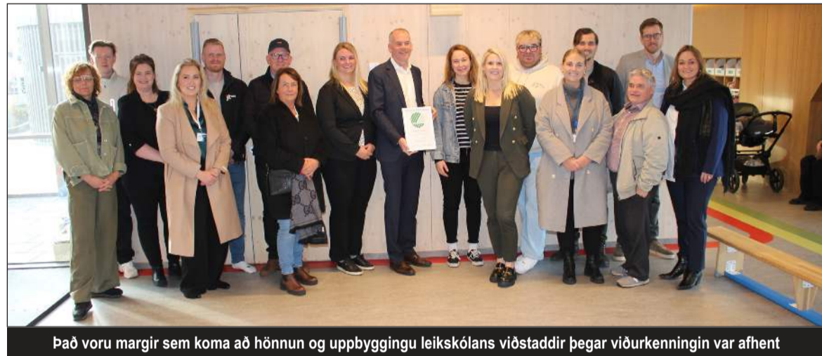
Það voru margir sem koma að hönnun og uppbyggingu leikskólans viðstaddir þegar viðurkenningin var afhent