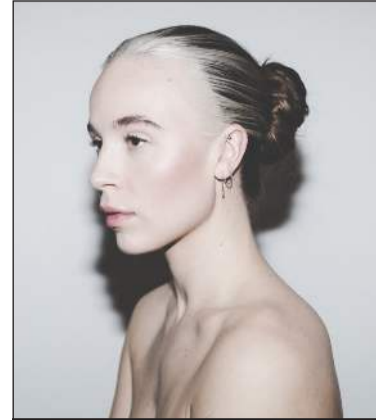
Hin magnaða söngkona GDRN mun stíga á sviði á Rökkvunni

Á Rökkvunni má sjá fjölbreytta flóru listafólks. Myndlist, handverk, dans og tónlist er meðal þess sem gestir mega búast við á hátíðinni í ár. Tónlist er þó kjarni Rökkvunnar, en hátíðin nær hápunkti sínum á stórtónleikum sem byrja klukkan 19:30 í glerhýsinu á Garðatorgi. Þar koma fram Kusk og Óviti, KK, JóiPé og GDRN.