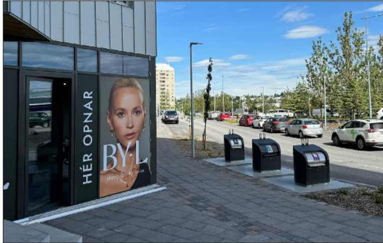
BY•L er staðsett á móts við Smáralind

En af hverju ákvaðstu að færa þig um set og yfir í Silfursmárann? „Það var komið að næsta skrefi hjá okkur, við höfum vaxið og dafnað fallega þökk sé okkar frá-