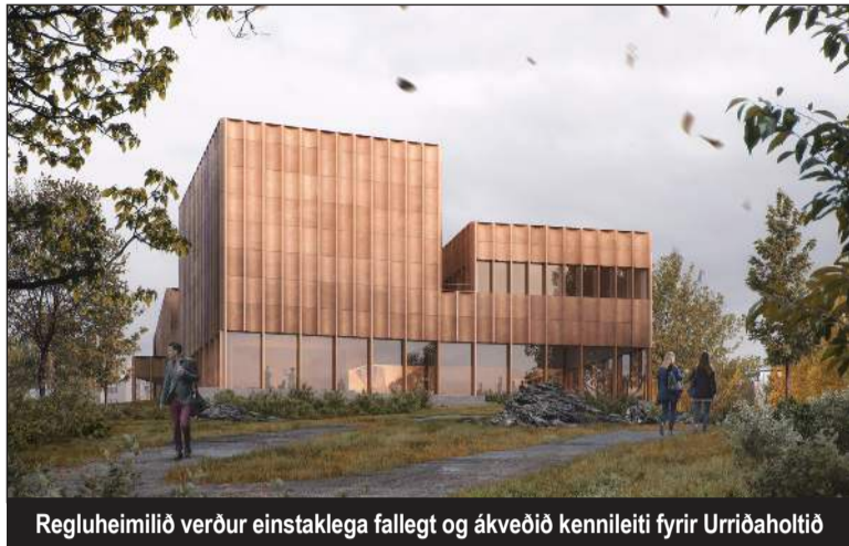
Regluheimilið verður einstaklega fallegt og ákveðið kennileiti fyrir Urriðaholtið

„Tillagan sýnir vandaða og hlýlega byggingu sem fangar vel hugmyndina um regluheimili. Aðlögun að umhverfi og staðaranda er góð og heildarútkoman faguð og góð byggingarlist. Greinargerð gefur til kynna góða þekkingu á meginatriðum sjálfbærni og hvernig vinna megi útfra þeim forsendum við útfærslu byggingarinnar.“