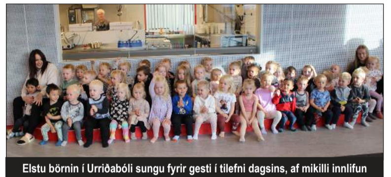
Elstu börnin í Urriðabóli sungu fyrir gesti í tilefni dagsins, af mikilli innlifun

Eins og áður segir er Urriðaholtið vistvottað samkvæmt BREEAM communities staðlinum, sem er vistvottun skipulags og styður við vottanir fram-