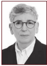
Öluf 898 3075

Stapahrauni 5, Hafnarfirði Sími: 565 9775 www.uth.is - uth@uth.is