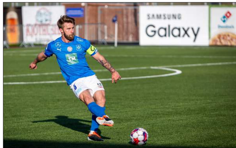
Guðmundur fyrirliði Stjórnunnar biðlar til alls Stjórnufólks að fjölmenna á Hlíðarenda á mánudaginn og styðja liðið í komandi orrustum í úrslitakeppninni

En Stjórnmenn eru allir upp til hópa stemmdir fyrir úrslitakeppninni og það hlýtur að vera góð tilfinning að hafa þetta í sínum höndum þ.e.a.s. undir ykkur komið hvort þið tryggjið ykkur Evrópusæti að ári, ef fjórða sætið dugar? „Já, það er auðvitað alltaf best. En okkar fókus liggur alltaf í næsta leik og frammistöðu. Þetta er gömul og góð klisja, en við horfum bara einn leik fram í tímann. Það hefur alltaf reynst okkur best. Mig langar síðan að biðla til alls Stjórnufólks að fjölmenna með okkur á Hlíðarenda og styðja liðið í komandi orrustum,“ segir fyrirliði Stjórnunnar að lokum.