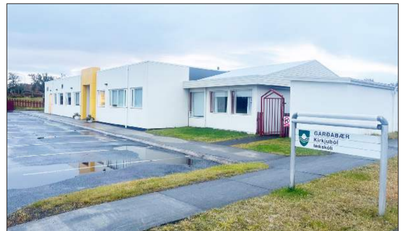
Núna eru alls 100 börn sem fædd eru árið 2023, þ.e. í janúar til ágúst, í 13 leikskólum í Garðabæ og leikskólinn Kirkjuból er einn þeirra

• Vala leikskólakerfi heldur utan um flest sem viðkemur umsókn og leikskólavöl barnsins.