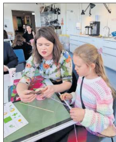
Fjölskyldustundir í Hönnunarsafninu eru fyrsta sunnudag í mánuði