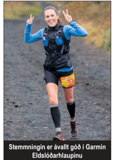
Stemningin er ávallt góð í Garmin Eldslóðarhlaupinu

Hægt er að hlaupa 10 km eða 29 km. Lengri brautin er frá Vífilstöðum í Garðabæ, að Vífilstaðavatni, inn að Búrfellsgjá, þar upp að Helgafelli og aftur til baka að Vífilstöðum. Brautin er hugsuð þannig að hún sé áskorun fyrir lengra komna en um leið falleg og auðfarin, með minni hækkan en gengur og gerist í stóru utanvegahlaupunum. Þá er líka hugsuð styttri keppnisbraut með það að leiðarljósi að í lok sumars geti þetta verið skemmtilegt hlaup þar sem byrjendur og lengra komnir geti átt frábæran dag saman í Heiðmörkinni.