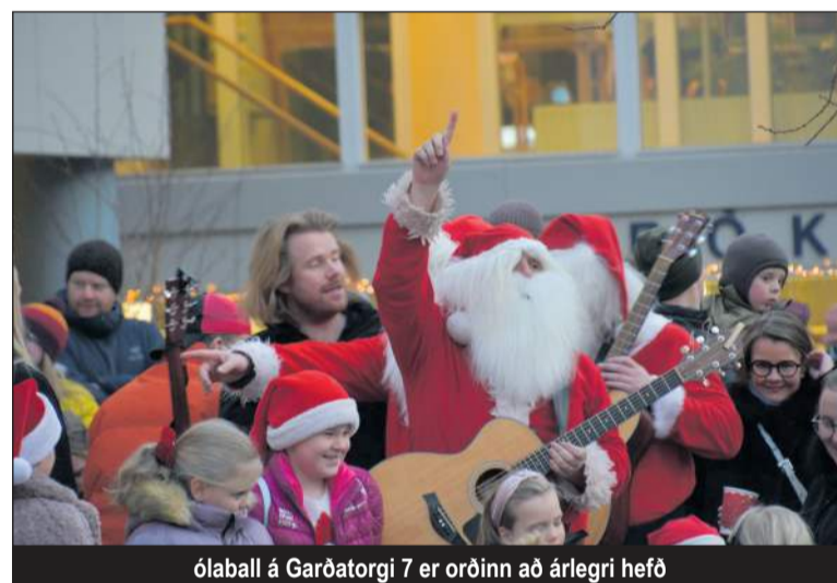
Ólaball á Garðatorgi 7 er orðinn að árlegri hefð