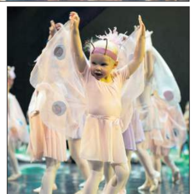
söngleikjadans og jazz/modern tíma fyrir alla.“