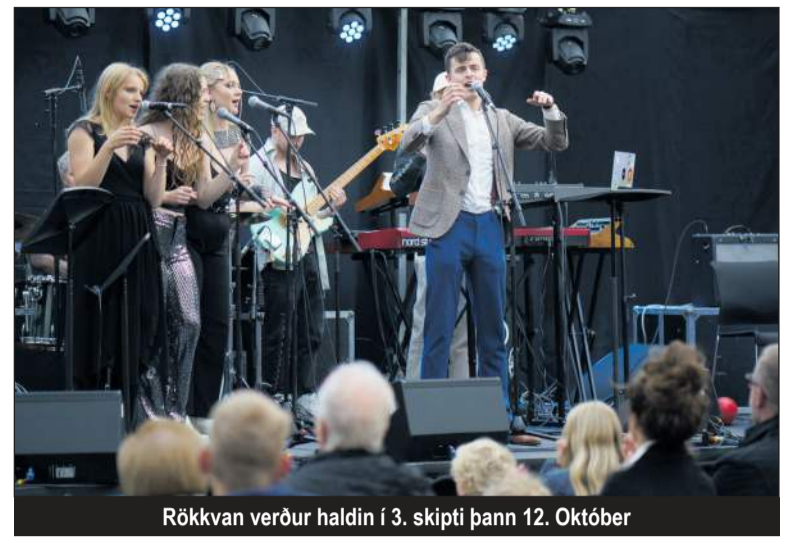
Rökkvan verður haldin í 3. skipti þann 12. Október

Nú eru aðventutónleikar Þýska sendiráðsins orðnir að föstu samstarfsverkefni við Menningu í Garðabæ og það er alltaf