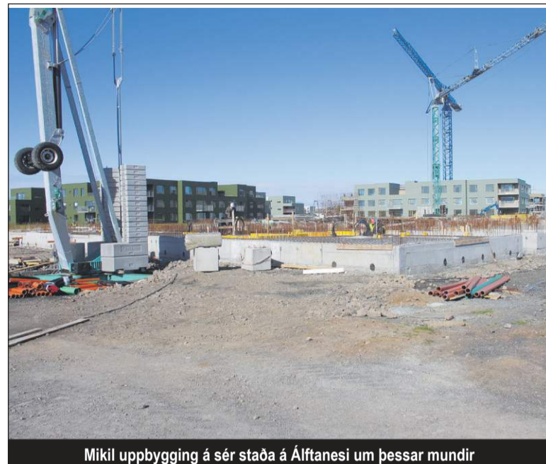
Mikil uppbygging á sér staða á Álfanesi um þessar mundir

Mælaborð fyrir íbúðir í byggingu birtir samantekin gögn og tölningar fyrir íbúðarhúsnæði úr Mannvirkjaskrá HMS. Í mælaborðinu eru birtar upplýsingar um íbúðir í byggingu, byggingaráform og fullbúnar íbúðir, eftir tegund húsnæðis, stærðarflokkun og framvindu.