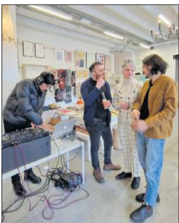
Viðburðir í tengslum við sýningar á Hönnunarsafninu fara reglulega fram.

Þá bendir bæjarráð á mikilvægi afreksstarfs og hvetur ríkisstjórn Íslands og Afrekssjóð ÍSÍ að stuðla að frekari eflingu afreksstarfs meðal íslenskra íþróttamanna meðal annars með greiðslu vinnutaps þjálfara, starfsmanna og íþróttafólks vegna þátttöku á Ólympíuleikum og öðrum alþjóðlegum mótum.