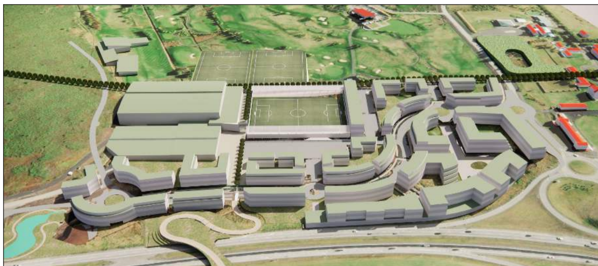
Á kynningarfundinum sl. þriðjudag var fjallað um framtíðarsýn hverfisins, skipulag og uppbyggingu, en hverfið er staðsett á einstökum stað við Miðgarð og Golfklúbb Kópavogs og Garðabæjar (GKG) og mun sameina náttúru, nútímalegt skipulag og fjölbreyttar íbúðir fyrir fólk sem sækist eftir útivist og gæðum

Nýtt og spennandi íbúðahverfi er í uppbyggingu í Garðabæ – Vetrarmýri. Hverfið er staðsett á einstökum stað við Miðgarð og Golfklúbb Kópavogs og Garðabæjar (GKG) og mun sameina náttúru, nútímalegt skipulag og fjölbreyttar íbúðir fyrir fólk sem sækist eftir útivist og gæðum. Á kynningarfundinum sl. þriðjudag var fjallað um framtíðarsýn hverfisins, skipulag og uppbyggingu.