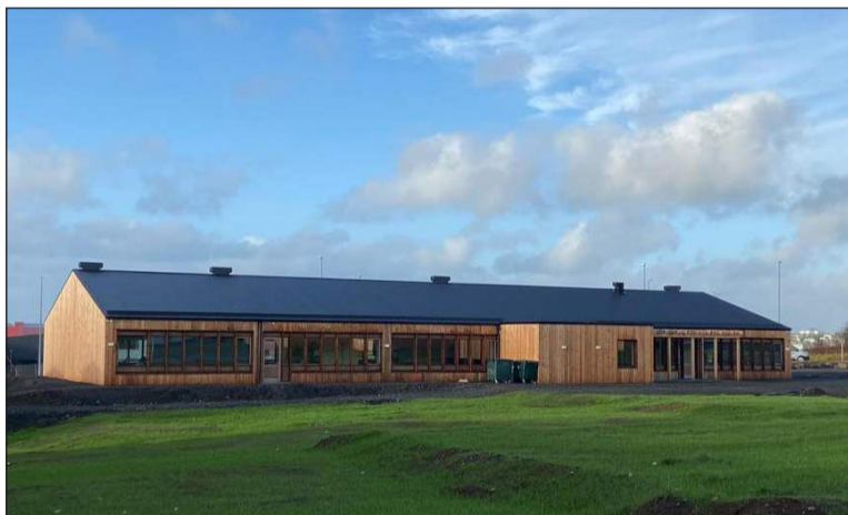
Alþjóðaskólinn er í nýju og glæsilegu húsnæði að Þórsgrund

Við erum stolt af því að hafa hlotið alþjóðlega faggildingu hjá Council of International Schools (CIS) og Middle States Association (MSA). Að auki erum við viðurkenndur IB skóli!