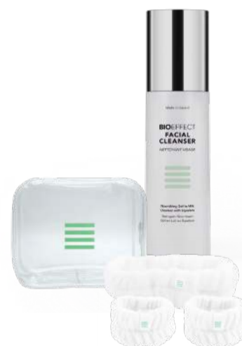
Nýi andlitshreinsirinn og hár- og úlnliðsbönd fylgja. 6.990 kr.