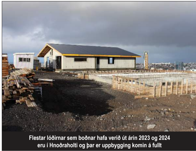
Flestar lóðirnar sem boðnar hafa verið út árin 2023 og 2024 eru í Hnoðraholti og þar er uppbygging komin á fullt

Í minnisblaðinu kemur m.a. fram að Garðabær hafi í ákveðnum tilvikum þegar fasteignir í eigu bæjarins hafa samkvæmt ákvörðun bæjarráðs verið auglýstar til sölu eða lóðir auglýstar til úthlutunar leitað til fasteignasala varðandi umsjón með sölufæri og móttöku tilboða. „Tilvik er varðar sölu á íbúðarhúsnæði í eigu bæjarins eru örfá og verður því hér eingöngu gerð grein fyrir þeim tilvikum þegar fasteignasalar hafa komið að sölufæri í tengslum við úthlutun á byggingarrétti lóða.“ Á fundi bæjarráðs 13. júní 2023 voru samþykktir úthlutunarskilmálar vegna sölu á byggingarrétti lóða í 1. áfanga Hnoðrahólts norður. Um var að ræða 7 einbýlishúsalóðir, 20 lóðir fyrir par/raðhús og 10 lóðir fyrir fjölbýlishús með 83 íbúðum.