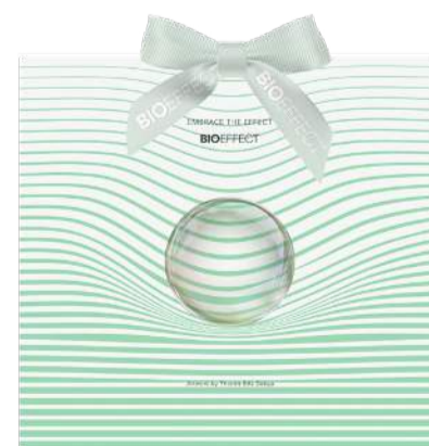
BIOEFFECT gjafapoki. 790 kr.