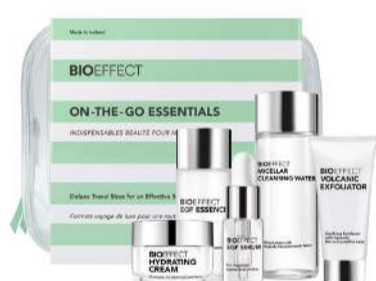
On-The-Go Essentials. 7.990 kr.