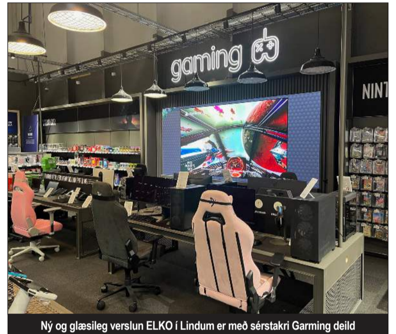
Ný og glæsileg verslun ELKO í Lindum er með sérstakri Gaming deild

Komumst ekki langt í að eiga ánægðustu viðskiptavinina nema að eiga líka ánægðasta starfsfólkið Og er spennan og eftirvænting á meðal starfsfólksins að opna í raun nýja glæsilega verslun? „Starfsfólkið okkar hefur staðið sig eins og heitur í þessu erfiða framkvæmdaumhverfi sem verið hefur síðustu mánuði. Þau eiga öll hrós skilið og get ég fullyrt að þau hlakkar til að fá nýrri og betri verslun til að vinna í næstu árin. Mikið var lagt upp úr að gera alla aðstöðu starfsfólks mun betri en áður var. Starfsfólk okkar fær nú mun betri loftræstingu, stærra og betri kaffiaðstöðu, kósý-herbergi til að slaka á eftir mat, betri skrifstofur fyrir stjórnendur og betri baksvæði til að vinna í þjónustumálum. Við komumst ekki langt