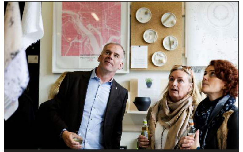
Myndir frá sýningunum fjórum í Hönnunarsafninu og sú fimmta opnar 8. nóvember