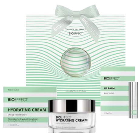
Vinsæla Hydrating rakakremið, BIOEFFECT varasalvi og gjafapoki fylgir. 12.990 kr.