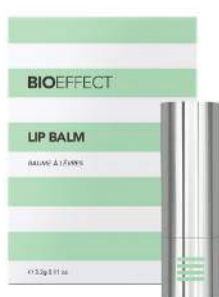
BIOEFFECT varasalvi. 3.890 kr.