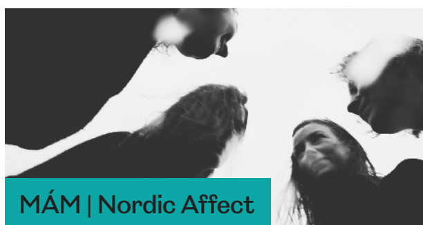
MÁM | Nordic Affect