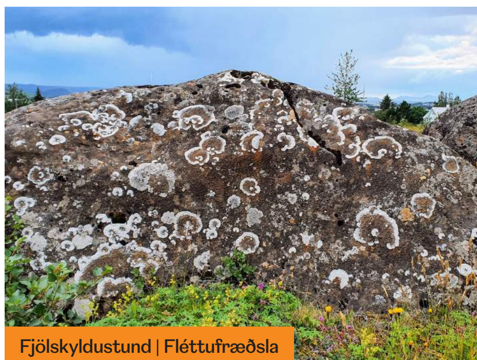
Fjölskyldustund | Fléttufræðsla