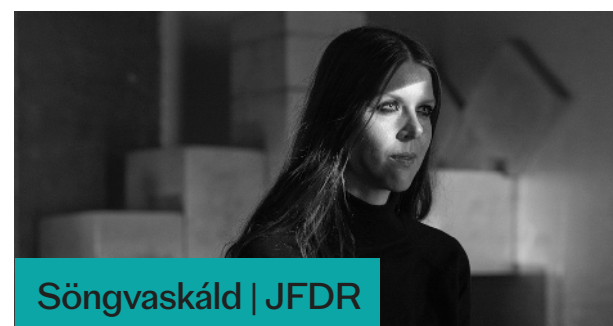
Söngvaskáld | JFDR