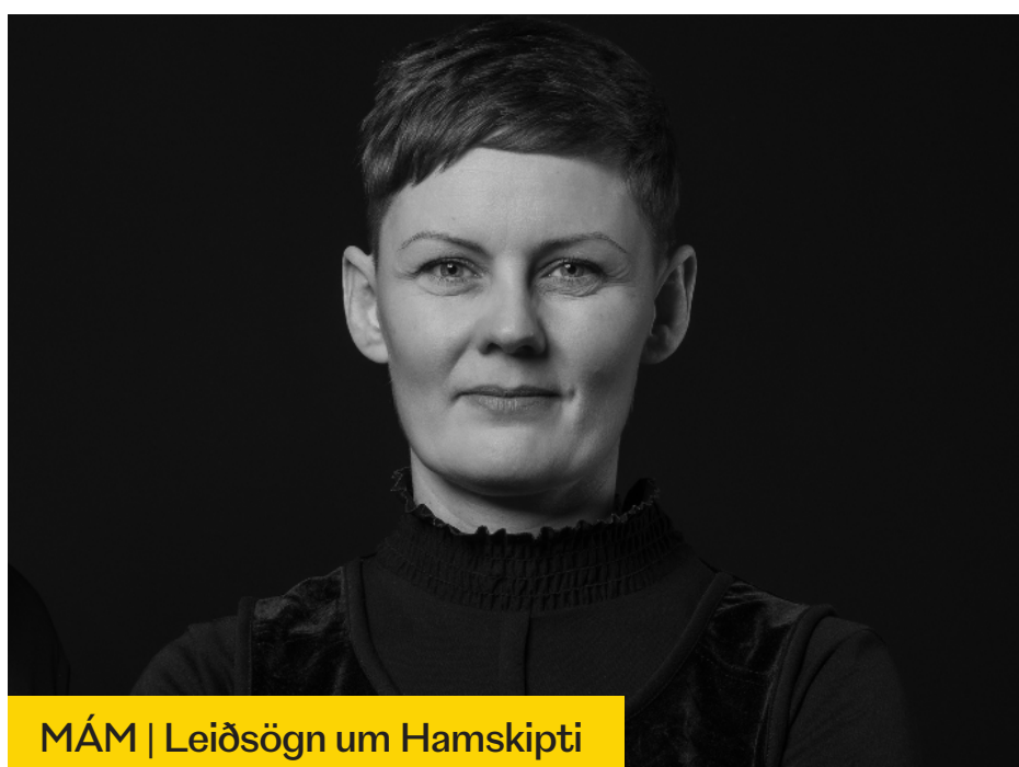
MÁM | Leiðsögn um Hamskipti