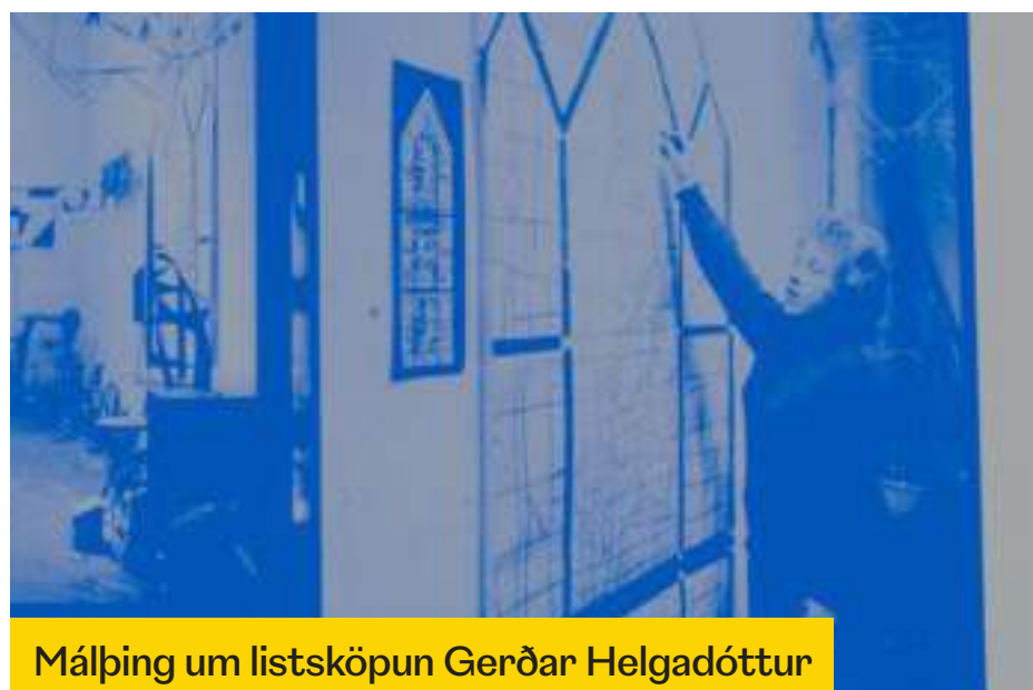
Málþing um listsköpun Gerðar Helgadóttur