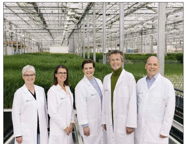
Starfsfólk BIOEFFECT og ORF Líftækni