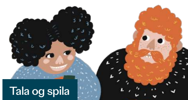
Tala og spila