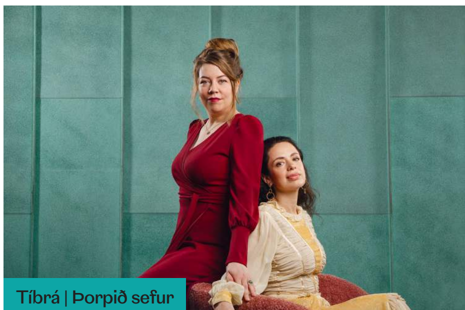
Tíbrá | Þorpið sefur