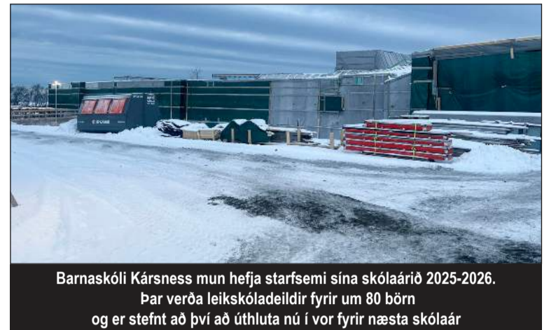
Barnaskóli Kársness mun hefja starfsemi sína skólaárið 2025-2026. Þar verða leikskóladeildir fyrir um 80 börn og er stefnt að því að úthluta nú í vor fyrir næsta skólaár

Barnaskóli Kársness mun hefja starfsemi sína skólaárið 2025-2026. Þar verða leik-