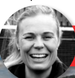
Raket Loga Fararstjóri