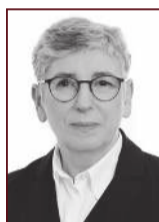
Ólöf 898 3075

Stapahrauni 5, Hafnarfirði Sími: 565 9775 www.uth.is - uth@uth.is