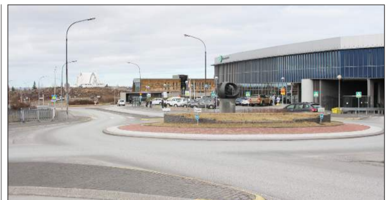
Kópavogsbær auglýsir um þessar mundir þrjár nýjar stjórnendastöður