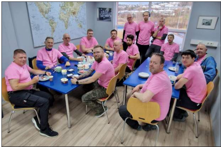
Piltarnir á Réttingarverkstæði Jóa á Dalvegi tóku að sjálfsgöðu virkan þátt og klæddust bleikum bolum, til að sýna konum stuðning og samstöðu

Bleiki dagurinn var haldinn á dögnum, en hann er haldinn til stuðnings fyrir allar þær konur sem greinst hafa með krabbamein og aðstandendur þeirra.