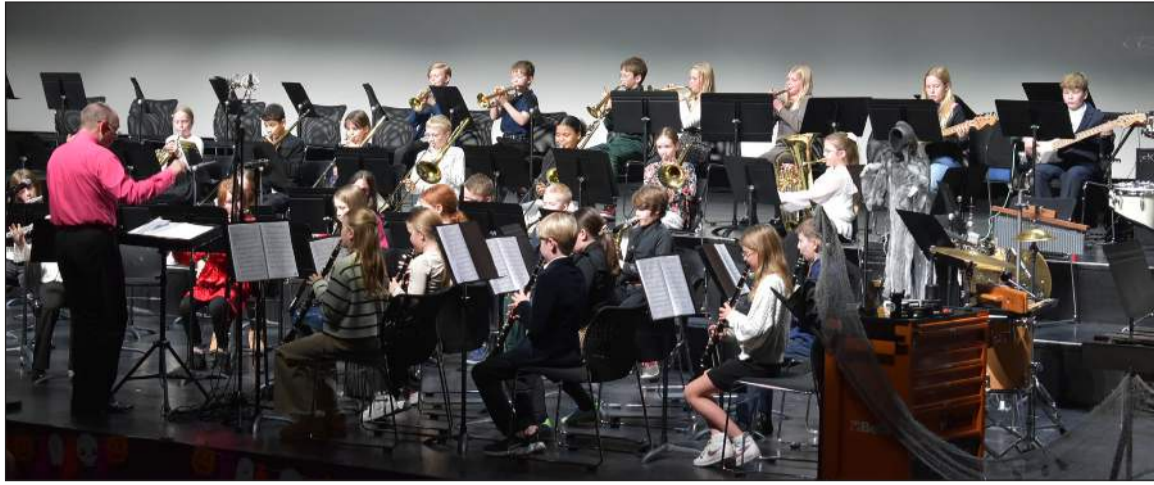
„The Troll King“ og „Dark Ride“