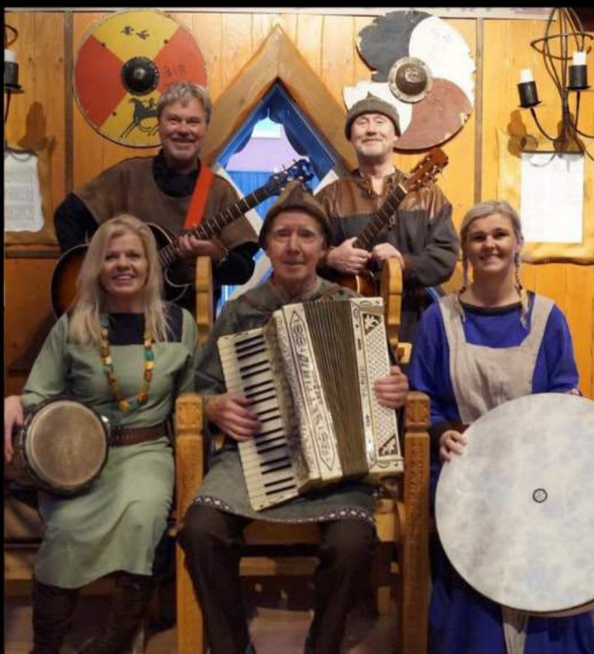
Víkingasveitin okkar spilar fyrir matargesti

Bókanir og fyrirspurnir: birna@fjorukrain.is