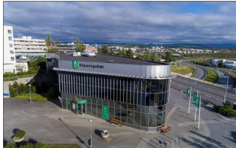
Viðsnúningur er á rekstri frá fyrra ári en rekstrarniðurstaða samstæðu Kópavogsbæjar fyrri hluta árs 2024 er jákvæð um 528 milljónir króna, gert hafði verið ráð fyrir rekstrarhalla upp á 318 milljónir króna

Árshlutareikningurinn sem nær yfir tímabilið 1. janúar til 30. júní 2024. Reikningurinn er óendurskoðaður og ókannaður en gerður í samræmi við lög og reglugerðir, en þó þannig að ekki eru samdar sérstakar