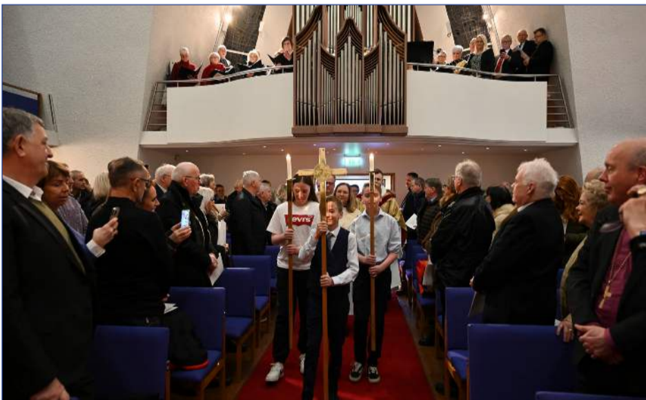
Við upphaf guðsþjónustu. Ljós og kerti borin inn

Hin vikulega sunnudagsguðsþjónusta er haldin út um allan heim, það gerum við einnig í Kópavogskirkju okkur til uppbyggingar og blessunar. Hvem einasta sunnudag allt árið um kring, söfnumst við saman í Kópavogskirkju og við bjóðum þér að vera með okkur. Guðsþjónustan er nær alltaf kl. 11.00 nema annað sé auglýst á heimasíðu okkar eða samfélagsmiðlum.