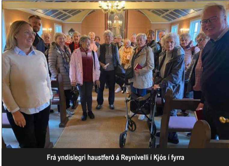
Frá yndislegri haustferð á Reynivelli í Kjós í fyrra

Þriðjudaginn 17. september, fer "Mál dagsins" í Kópavogskirkju í árlega haustferð.