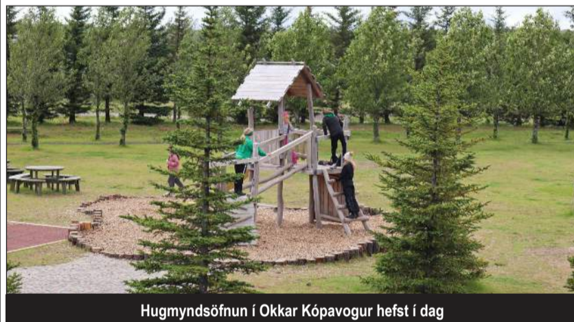
Hugmyndasöfnun í Okkar Kópavogur hefst í dag

340 milljónum varið í framkvæmd verkefna Hugmyndasöfnun í Okkar Kópavogur hafin