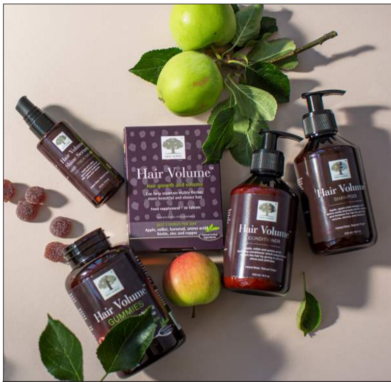
Hair Volume töflurnar er eitt vinsælasta hárbættiefnið bæði í Evrópu og í Bandaríkjunum

Hair Volume vítamínlinan fæst bæði í töflum og hlaupi. Töflurnar innihalda náttúrulega vaxtarvakann Procyanidin B2 sem unnin er úr eplum. Töflurnar næra rætur hársins með biótíni sem hvetur hárvöxt og eykur umfang hársins, kopar sem hjálpar við að viðhalda hárlit ásamt aminósýruna L-cysteine sem kemur í veg fyrir hárrurrk og viðheldur áferð og þykkt. Að auki inniheldur varan eplasafa, sink sem stuðla að viðhaldi eðlilegs hárs og þykkt úr hirsu sem er bæði ríkt af steinefnum og B-vítamínum og hefur það að markmiði að gera hárið líflegra og fallegra. Hair Volume hlaupin henta svo einstaklega vel fyrir öll þau sem ekki vilja gleypa töflur. Hlaupin eru sérlega bragðgöð en þau innihalda eplapykki í bland við hirsu, piparrót, biótín, pantótensýru og sink. Biótín og sink stuðla að eðlilegu viðhaldi hárs.