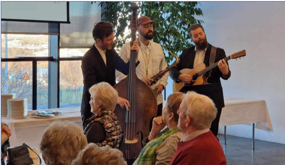
Myndin sýnir sönghópinn "Prísta" leika fyrir gesti í "Máli dagsins" á góðri stund í október í fyrra