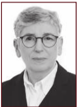
Ólöf 898 3075

Stapahrauni 5, Hafnarfirði Sími: 565 9775 www.uth.is - uth@uth.is