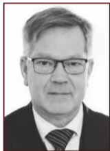
Hálfán 898 5765