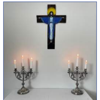
Kapellan okkar er hlýleg og er inni í safnaðarheimilinu Borgum

Bæna- og blessunarhópur kemur saman á mánudögum kl. 17.30-18.45. Þetta er sjálfsprottinn hópur sem nýtur þess að koma saman einu sinni í viku og eiga griðarstað í safnaðarheimilinu og að dvelja saman í friði fyrir amstri dagsins. Allir eru velkomnir og enginn er skyldugur að taka þátt en geta notið þess að vera bara með.