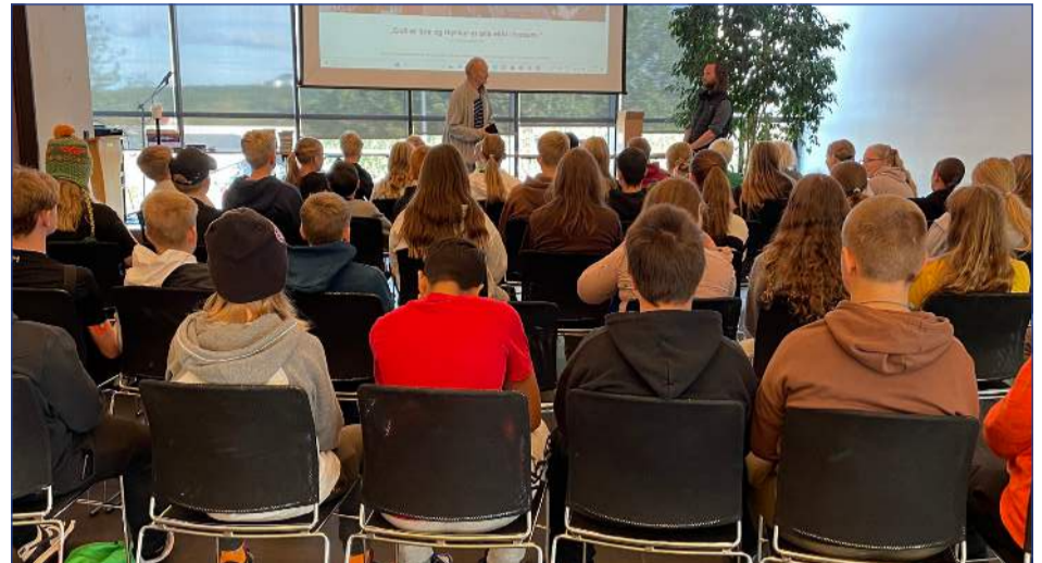
Krakkarnir á síðsumarfermingarnámskeiðinu stóðu sig vel og skemmtu sér vel!

Fermingarfræðslan er hafin í Kópavogskirkju. Síðsumarsnámskeiðið fór af stað 20. 21. og 22. ágúst fyrir þau sem það hentaði. Vetrarfermingarfræðslan verður síðan vikulega í haust á tímum sem verða tilkynntir síðar.