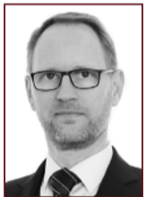
Frímann 897 2468