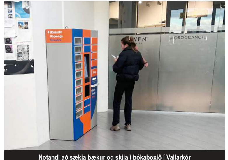
Notandi að sækja bækur og skila í bókabóxið í Vallarkór

Boxið virkar eins og pósthólfurinn sem hafa verið að spretta upp út um allt land á undanföllum árum þar sem hægt er að sækja pakka í box. Þetta er einföld leið fyrir lánþega safnsins að nálgast nýjustu og vinsælustu bækurnar, en í boxinu verða alltaf tíu nýir titlar, eins er hægt er að skila lánsbókum. Hægt er að taka frá bók og sækja hana í boxið. Bækurnar eru þá fráteknaðar á leitir.is og kemur starfsfólk bókanum í Bókabóxið. Bókinni verður