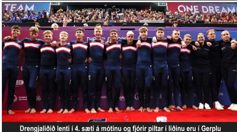
Drengjalliðið lenti í 4. sæti á móttinu og fjórir piltar í liðinu eru í Gerplu