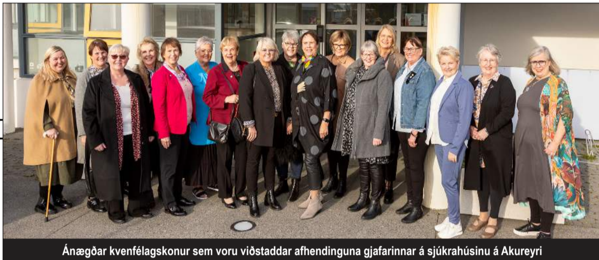
Ánægðar kvenfélagskonur sem voru viðstaddir afhendinguna gjafarinnar á sjúkrahúsinu á Akureyri

Nánar um söfnunina á www.gjofitillallrakvenna.is og nánari fréttir á www.kvenfelag.is