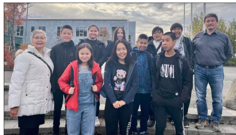
Kópavogsbær hefur í samstarfi við Kalak staðið fyrir sundkennslu fyrir grænlenk börn frá austurströnd Grænlands síðan árið 2006

„Verkefnið er ótrúlega skemmtilegt og gefandi fyrir alla sem að því standa. Þetta er eitt af mínum uppáhaldsverkefnum og svo