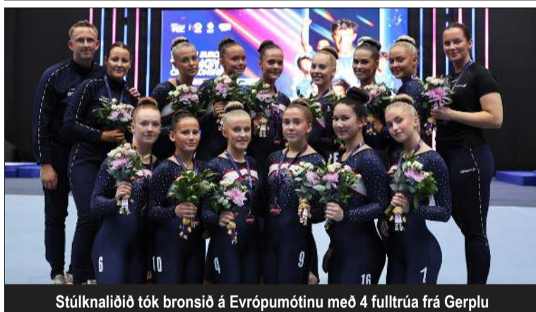
Stúlknaliðið tók bronsið á Evrópumóttinu með 4 fulltrúa frá Gerplu