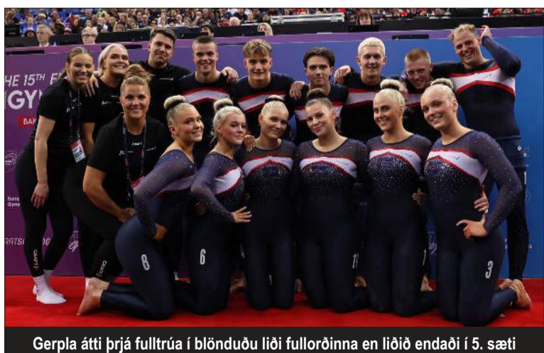
Gerpla átti þrjá fulltrúa í blönduðu liði fullorðinna en liðið endaði í 5. sæti

Stúlknaliðið vann til bronsverðlauna eftir harða baráttu við Svíþjóð og Danmörk.