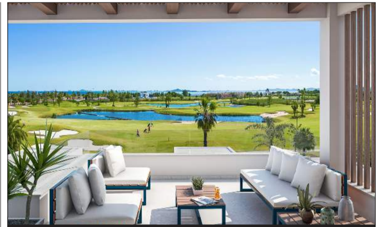
Á kynningarfundinum Novus Habitat í GKG verður kynnt fjölbreytt úrval fasteigna