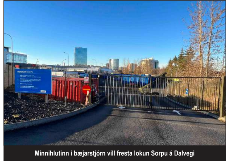
Minnihlutinn í bæjarstjórn vill fresta lokun Sorpu á Dalvegi

Bæjarstjóri Kópavogs hefur sett fram kröfu um að endurvinnslustöð Sorpu á Dalvegi víki ekki síðar en 1. september 2025. Við Kópavogsbúum og öðrum sem nýta þjónustu endurvinnslustöðvarinnar blasir allt að fjögurra ára stórfelld þjónustuskerðing. Ekki liggja fyrir hugmyndir um nýtingu svæðisins við Dalveg eftir lokun Sorpu en athugun á því er í burðarliðnum. Gera má ráð fyrir að vinnsla nýrra hugmynda taki 1-2 ár hið skemmsta áður en hægt verður að byrja uppbyggingu á svæðinu. Engin nauðsyn er á að loka á starfsemina fyrr en að nýrri uppbyggingu kemur.