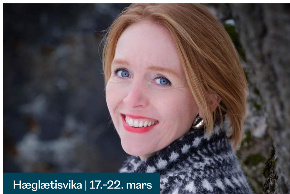
Hæglætisvika | 17.-22. mars