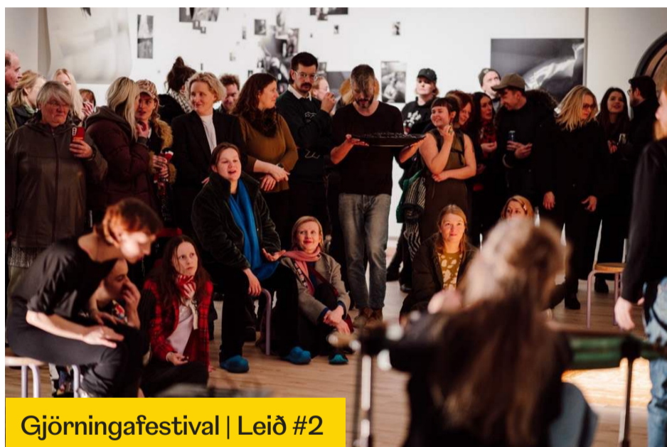
Gjörningafestival | Leið #2