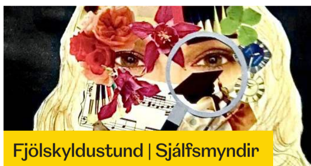
Fjölskyldustund | Sjálfsmyndir