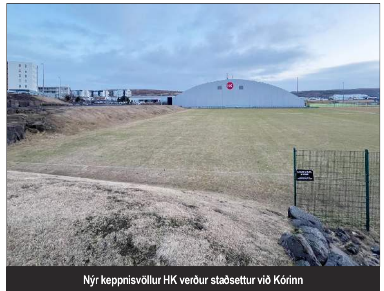
Nýr keppnisvöllur HK verður staðsettur við Kórinn

Heildarkostnaður nemur því 2.204.708.910 kr., þar með talið 20% óvissuþáttur, eða 319.523.030 kr.