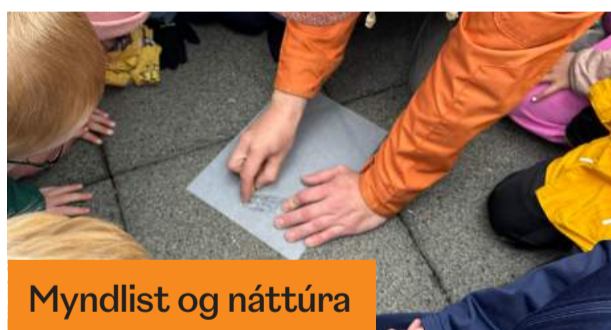
Myndlist og náttúra