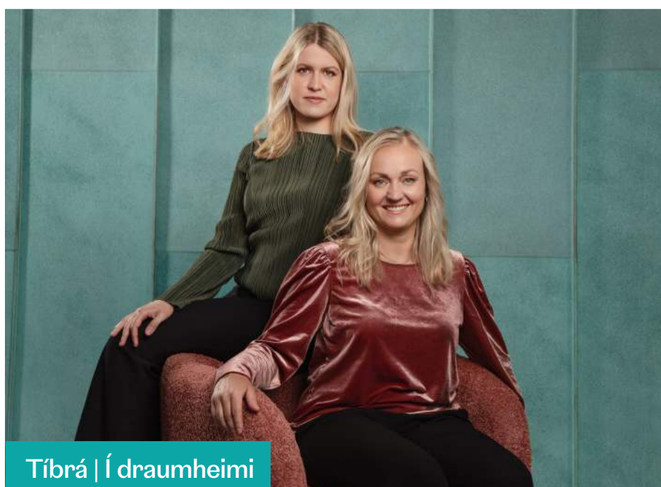
Tíbrá | Í draumheimi