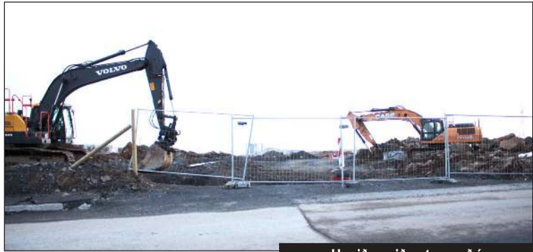
Unnið er við gatnagerð í Vatnsendahvarfi um þessar mundir

Tekið var á móti tilboðum í gegnum útboðsvef Kópavogsbæjar, Tendsign. Þess má geta að haldinn var sérstakur kynningarfundur um útboðskerfið sem mæltist vel fyrir. Allar spurningar og svör við þeim voru gerðar aðgengilegar í Tendsign í framhaldinu.