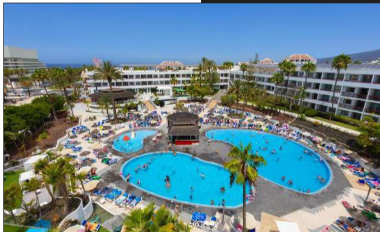
Hótél La Siesta er gott 4 stjörnu hótél fyrir miðju á amerísku ströndinni

En hvernig er aðstaðan og hótelið sem þið bjóðið upp á? „Við dveljum á La Siesta hótelinu sem er mjög gott 4 stjörnu hótél