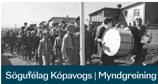
Sögufélag Kópavogs | Myndgreining