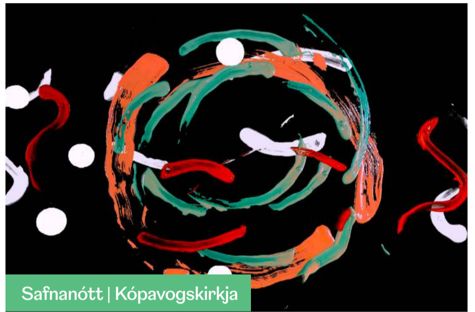
Safnanótt | Kópavogskirkja