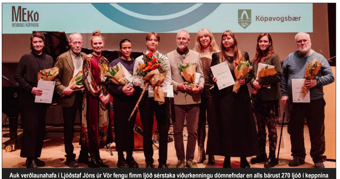
Auk verðlaunahafa í Ljóðstaf Jóns úr Vör fengu fimm ljóð sérstaka viðurkenningu dómnefndar en alls bárust 270 ljóð í keppnina

eins og konu sem er spáð sjódauda en flytur samt inn í hús þakið skeljum