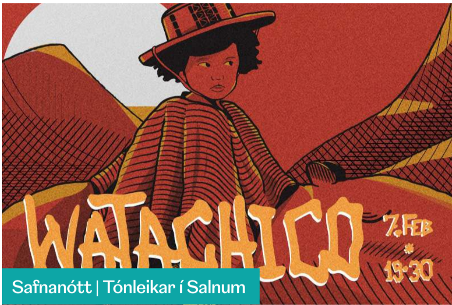
Safnanótt | Tónleikar í Salnum