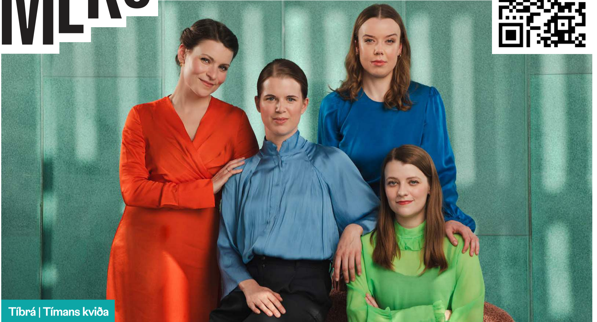
Tíbrá | Tímans kviða