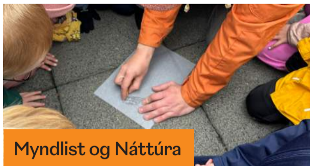
Myndlist og Náttúra