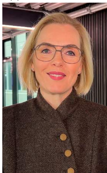
Guðrún Hafsteinsdóttir, dómsmálaráðherra og fyrsti þingmaður Suðurlandshéraðs

heimsótti ég fjöldahjálparstöðvarnar og samhfingarmiðstöðina í Reykjavík og líka í Reykjanesbæ. Í Reykjanesbæ tókum við eftir hve íbúar voru duglegir að koma með veitingar, föt, teppi og annað til að hlúa að viðbragðsaðilunum sem voru að hlúa að þeim sem þurftu að yfirgefa heimilin sín. Fólkið hér var að passa upp á að viðbragðsaðilarnir gætu örugglega sinnt sínu starfi, við sáum ekkert svona lagað í höfuðborginni. Ég var stolt af því sjá samheldnina hér í Reykjanesbæ.“