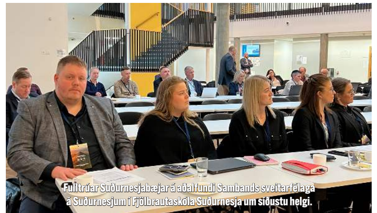
Fólkráar Suðurnesjabæjar á aðalfundi Sambands sveitarfélaga á Suðurnesjum í Fjölbrautaskóla Suðurnesja um síðustu helgi.

Skilgreiningarvandi á hvað telst barn með fjölþættan vanda, ásamt fækkun úrræða af hendi ríkisins veldur því að grá svæði hafa myndast milli ríkis og sveitarfélaga þegar kemur að þjónustu við börn með fjölþættan vanda. Það hefur skapað kerfislegan vanda og ábyrgð á þjónustu við þennan hóp lagst á herðar sveitarfélaga. Sveitarfélög hafa verið nauðbeygð til þess að mæta þjónustubörf- inni með því að kaupa þjónustu af einkareknum úrræðum á borð við Klettabæ, Heilindi og Vinakot. Kostnaður sveitarfélaganna vegna slíkra samninga er gríðarlegur eða um 150 milljónir fyrir hvern samning á ársgrundvelli.