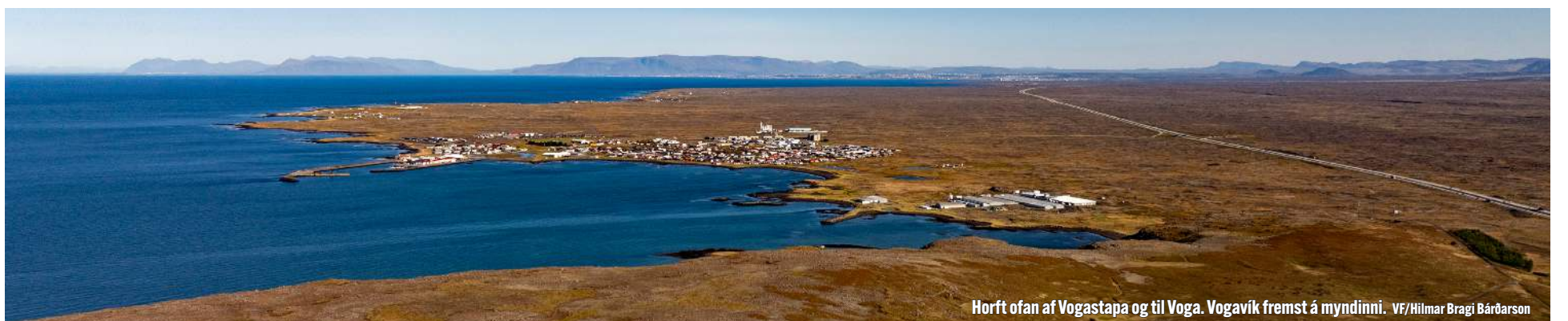
Horft ofan af Vogastapa og til Voga. Vogavík fremst á myndinni.

Stóra sviðsmyndin sem horft er á hjá Veðurstofu Íslands er að á meðan kvikusöfnun heldur áfram undir Svartsengi þarf að búast við nýju kvikuhlaupi og jafnvel eldgosi á Sundhnúks-gígaröðinni. Erfitt er að fullyrða hvaða sviðsmyndir eru líklegastar, hvort að gjósi næst norðan megin eða sunnan megin á gígaröðinni. Bergrún sagði að við verðum að vera viðbúin því að næsta gos verði kröftugra en fyrri gos. Mikilvægt sé að íhuga mótvægisáðgerðir í tengslum við áhrifamestu sviðsmyndir.