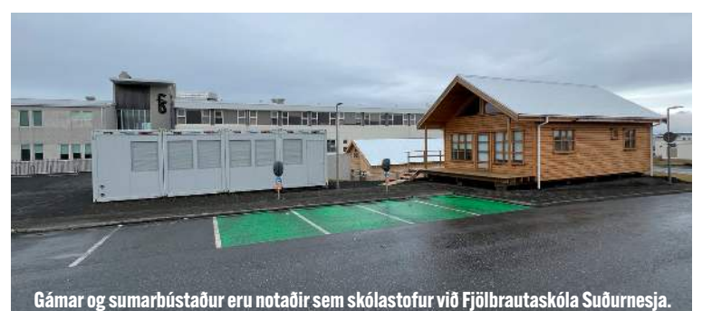
Gámar og sumarhústaður eru notaðir sem skólastofur við Fjölbrautaskóla Suðurnesja.