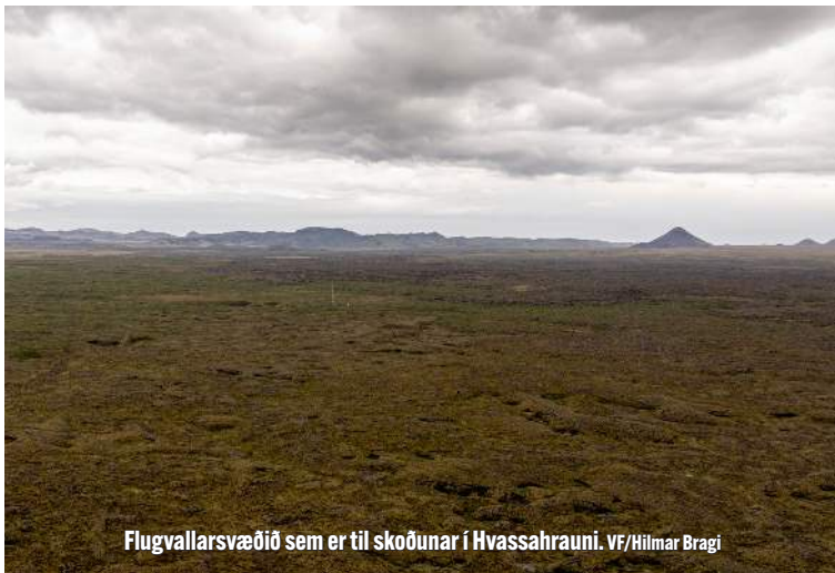
Flugvallarsvæðið sem er til skoðunar í Hvassahrauni.