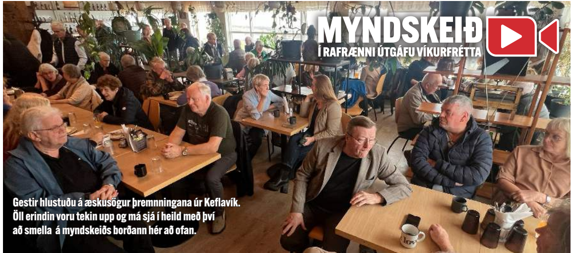
Gestir hlustuðu á æskusögur þremningana úr Keflavík. Öll erindin voru tekin upp og má sjá í heild með því að smella á myndskaiðs borðann hér að ofan.

Húsfyllir var á Sagnastund á Garðskaga síðasta laugardag þar sem þrjú Keflvíkingar mættu og sögðu sögur frá bernskuárum sínum í Keflavík upp úr miðri síðustu öld.