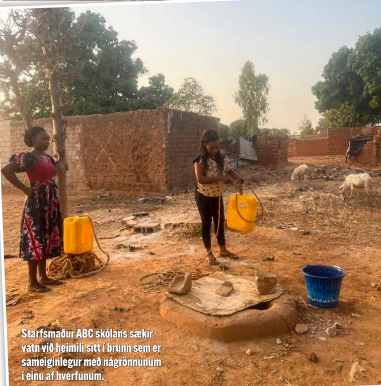
Starfsmaður ABC skólans sækir vatn við heimili sitt í brunn sem er sameiginlegur með nágrennum í einu af hverfunum.