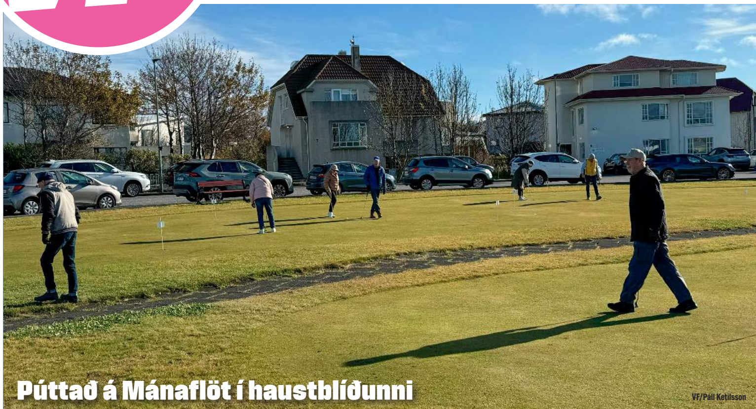
Púttað á Mánafliot í haustblíðunni

DREIFT Á SUÐURNESJUM OG Á HÖFUÐBORGARSVÆÐINU • ÓKEYPIS EINTAK