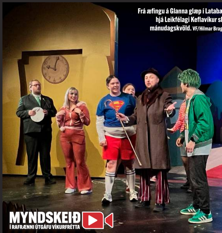
Frá æfingu á Glanna glæp í Latabæ hjá Leikfélagi Keflavíkur sl. mánudagskvöld.