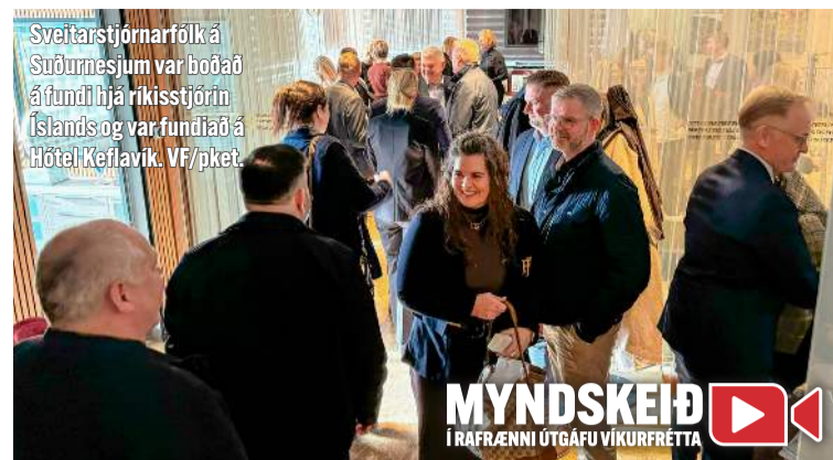
Sveitarstjórnarfolk á Suðurnesjum var boðað á fundi hjá ríkisstjórn Íslands og varfundiað á Hótel Keflavík.

Það verður breyting á Grinda- víkurnefndinni, við erum á loka- metrunum með að útfæra þessar breytingar en lyklatríði í því er að styrkja nefndina á þessum tímamótum. Við vitum að það hefur skort á ákveðna greiningargetu í nefndina, við viljum valdefla hana og nota þá fjármuni sem henni er ætluð, með betri hætti,“ sagði Krístrún að lokum.