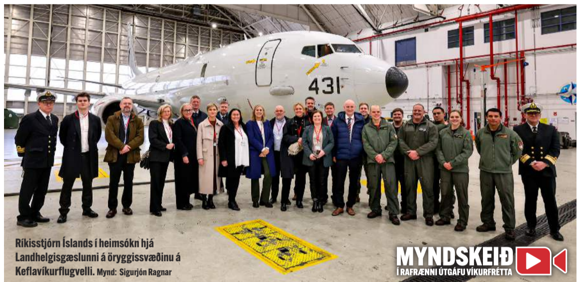
Ríkisstjórn Íslands í heimsókn hjá Landhelgisgæslunni á öryggissvæðinu á Keflavíkurflugvelli.

„Ég veit að þetta mál var nánast komið í höfn hjá síðustu ríkisstjórn þegar ákveðið var að efna til kosninga í haust. Það er jákvætt að núverandi ríkisstjórn fylgi þessu máli eftir og klári það. Það er gríðarlega gott mál.“