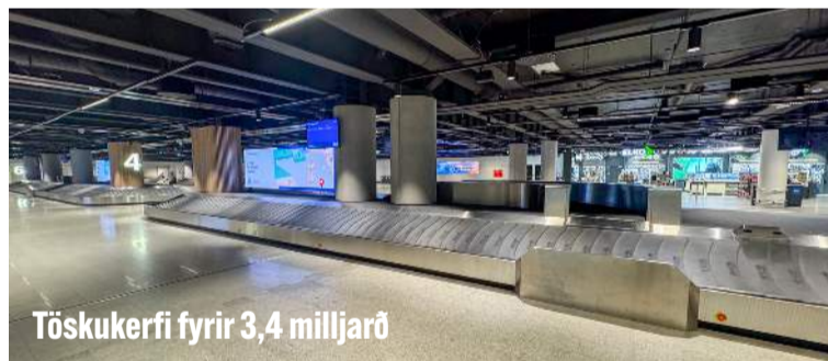
Töskukerfi fyrir 3,4 milljarð

Töskusalur hefur verið stækkaður en hluti af nýjungunum er nýtt farangurskerfi í kjallaranum (neðri mynd) sem farþegar sjá ekki en það kostaði 3,4 milljarð króna.