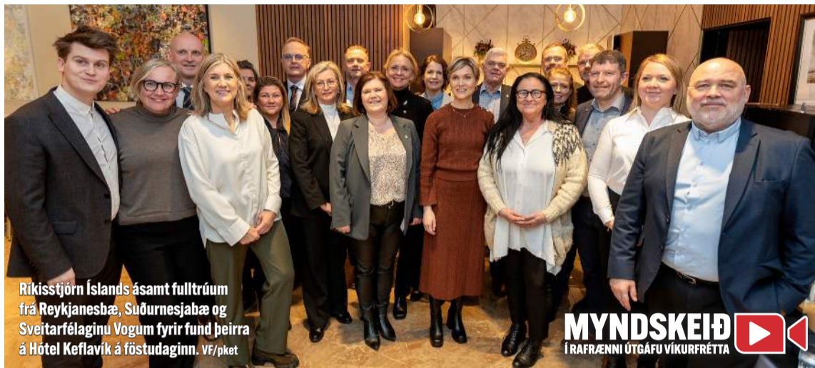
Ríkisstjórn Íslands ásamt fulltrúum frá Reykjaneshæ, Suðurnesjabæ og Sveitarfélaginu Vogum fyrir fund þeirra á Hótel Keflavík á föstudaginn.

Í neyðarkalli Suðurnesjabæjar kom fram að tvö börn með fjölpættan vanda geta kostað Suðurnesjabæ 330 milljónir króna á ári. Um er að ræða ræða búsetuúræði fyrir tvo einstaklinga í einkareknum úrræðum og er áætlað að