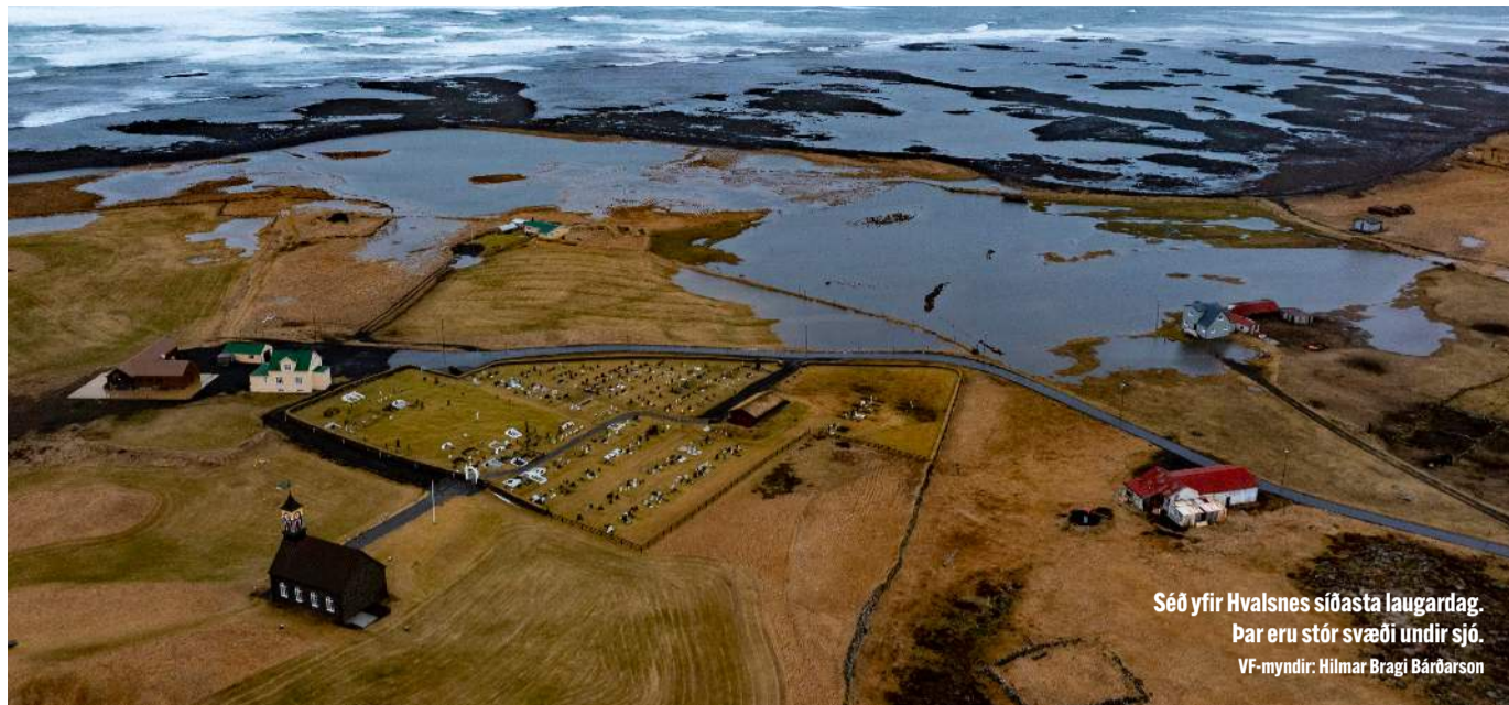
Séð yfir Hvalsnes síðasta laugardag. Þar eru stór svæði undir sjó.