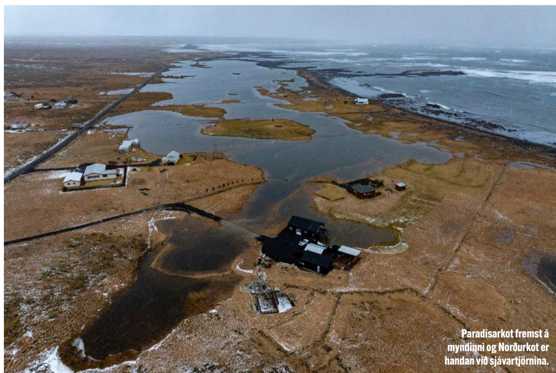
Paradísarkot fremst á myndinni og Norðurkot er handan við sjávarfjörna.

Nýsprautun ehf. • Njardarbraut 15 • 260 Reykjanesbæ Upplýsingar: Sverrir s. 896-1717 • nysprautun@nysprautun.is