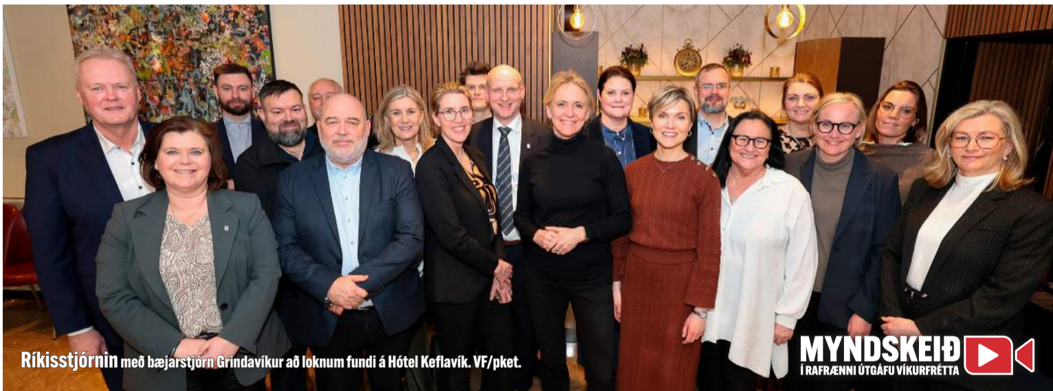
Ríkisstjórnin með bæjarstjórn Grindavíkur að loknum fundi á Hótel Keflavík.

Aukningin með Grindvíking- unum inn í skólana nemur 27%. Bæjarstjórnin segir að málið hafi verið leyst með samvinnu kennara og fleiri, hliðrað til og farið í að- gerðir til að taka vel á móti nýjum nemendum en myndað var teymi vegna málsins. M.a. þurfti að fjölga starfsfólki. „Lendingin hlýtur að vera sú að íbúar flytji lögheimili sitt í það sveitarfélag þar sem það býr. Það er verið að nýta hvern fermetra í þessum byggingum. Nú er það sprungið en það var líka einungis hugsað sem tímabundin eða bráða- birgða lausn. Það er vilji fyrir því að fara í hönnun viðbyggingar og við gerðum ráð fyrir því í okkar plönun en þessi mikla fólksfjölgun setti þau plön úr skorðum. Það var kominn tími á innviðauppygg- ingu, það fer líka að koma þörf í leikskóla og víðar, t.d. í stjórnsýsl- unni hjá okkur sem erum í þjón- ustu í sveitarfélaginu. Við erum hlaupandi á öllum vígstöðvum og gerum okkar besta.“