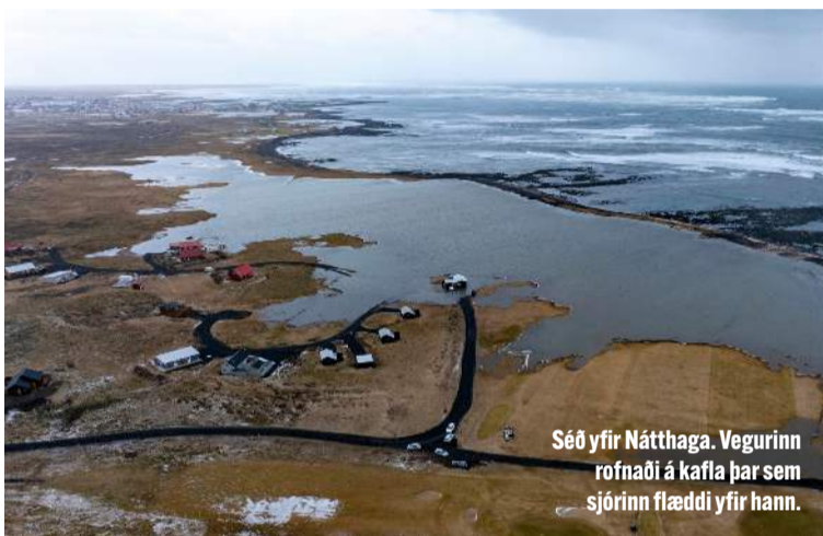
Séð yfir Nátthaga. Vegurinn rofnaði á kafla þar sem sjórinn flæddi yfir hann.