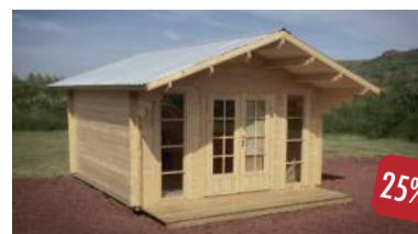
GESTAÚS án fylgihluta