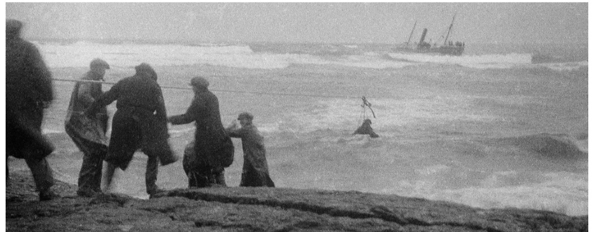
Mynd frá sýningunni í vélahúsinu við Reykjanesvíta. Áhöfn Trocadero bjargað 1936. Myndin er frá Ljósmyndasafni Reykjavíkur, tekin 6. september 1936 af Einarri Einarssyni.

Sýningin var opin á Safnahelgi á Suðurnesjum og mun svo opna aftur fyrir almenning með vorinu 2025 í síðasta lagi að sögn Eiríks.