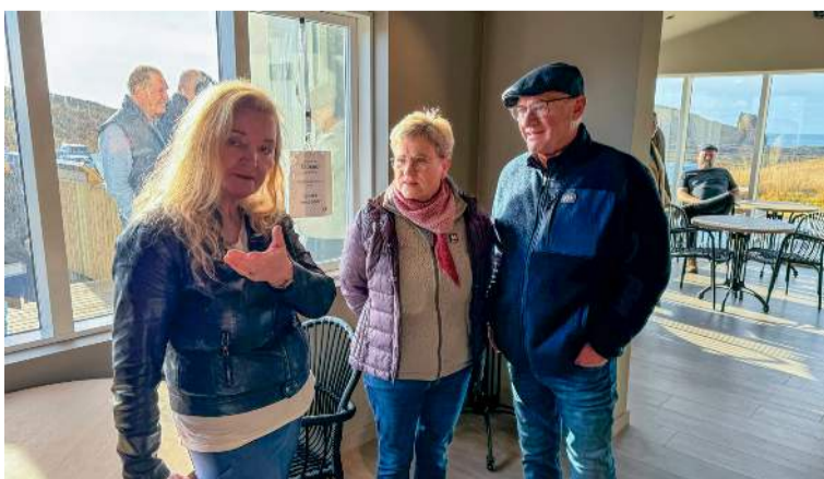
Í gestastofunni við Reykjanesvíta.