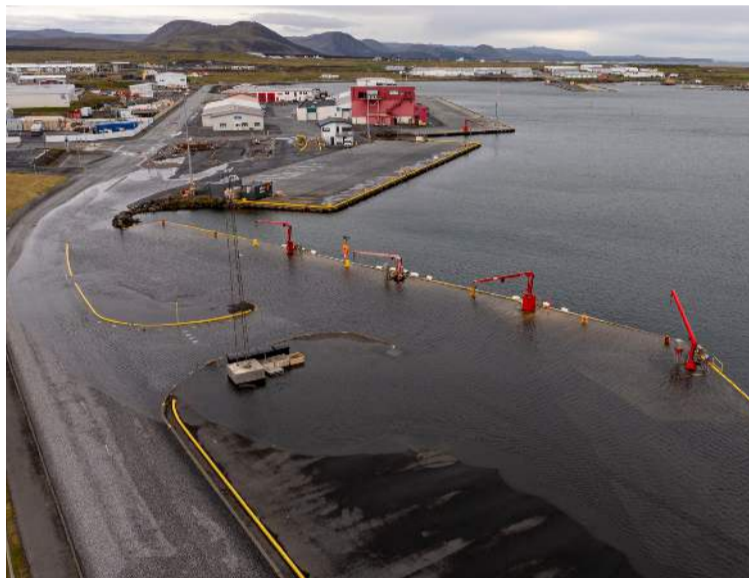
Há sjávarstaða í Grindavík seint í sumar. Sjór flæddi upp á bryggjur.