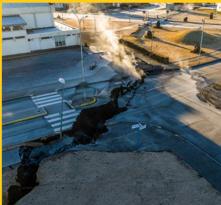
Það verður ekki haldið í þessa sprungu.

Á vef Grindavíkurbæjar er óskað eftir hugmyndum og ábendingum frá Grindavíkum varðandi það hvaða ummerki jarðhræringanna Grindavíkingar vilja varðveita, og þá í hvaða formi. Ábendingar má senda inn í gegnum vef bæjarfélagsins.