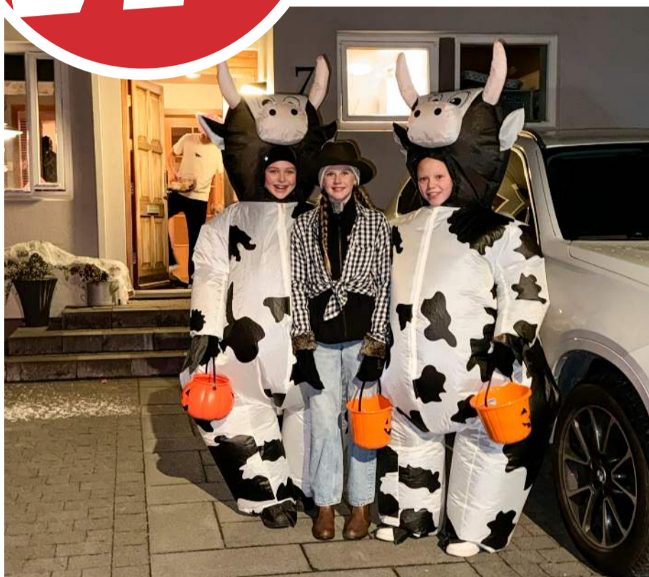
Það voru skrautlegar verur á ferli á Suðurnesjum á Hrekkjavökunni. Þær voru ekki allar hræðilegar. Tvær kýr ásamt kúreka urðu á vegi ljósmyndara, sem og tveir ungir menn sem höfðu verið handsamaðir af grænum geimverum.

DREIFT Á SUÐURNESJUM OG Á HÖFUÐBORGARSVÆÐINU • ÓKEYPIS EINTAK