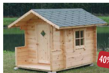
BARNAHÚS án fylgihluta