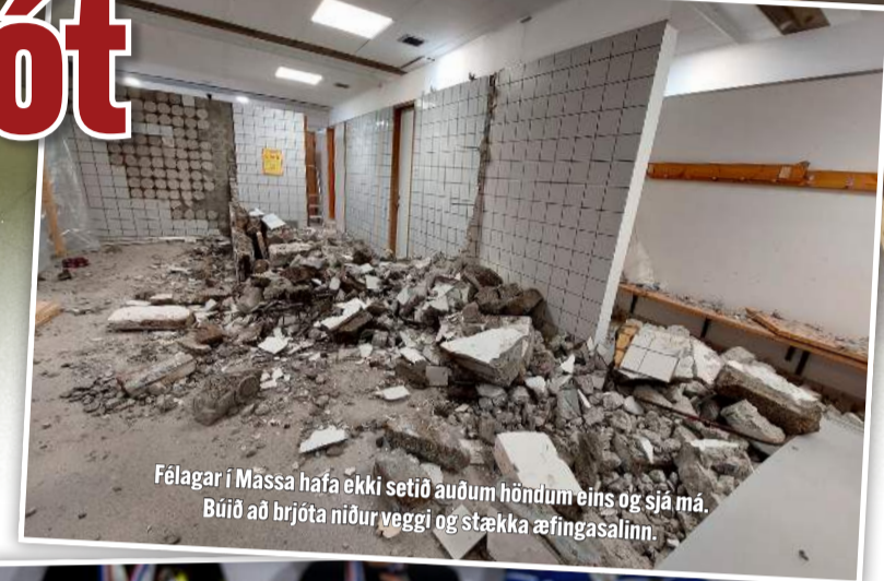
Félagar í Massa hafa ekki setið auðum höndum eins og sjá má. Búið að brjóta niður vegg og stækka æfingasalinn.