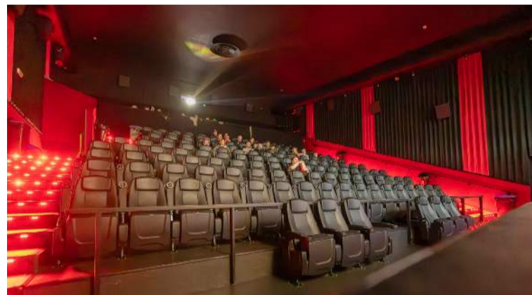
Netverjar hafa grátið örlög kvikmyndahússins. Þeir virðast hins vegar hafa setið heima þegar lokasýningin fór fram í Sambíóinu við Hafnargötu í Keflavík.

stórum hópi fólks sem sækir í nýpoppað popp.