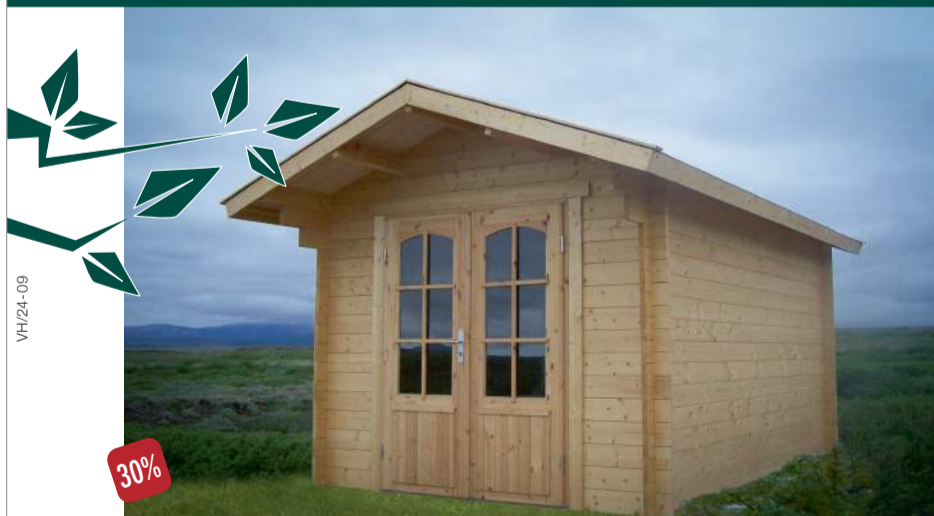
GARÐHÚS án fylgihluta

Allt að 40% afsláttur | Allt á að seljast, fyrstur kemur fyrstur fær | Ekki missa af þessu!