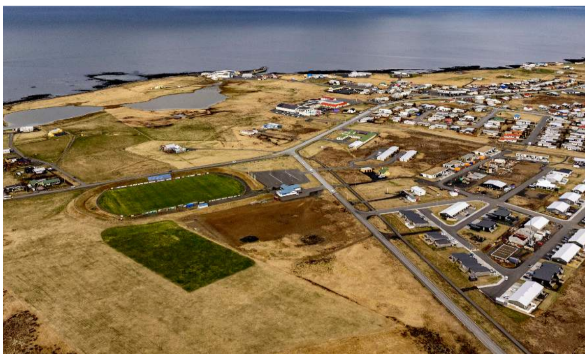
Að ofan: Ljagrænn knattspyrnuvöllurinn í Sandgerði síðasta sumar.