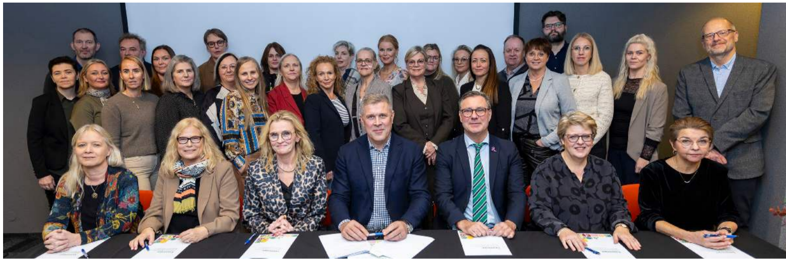
Frá undirritun samningsins í Reykjanesbæ í síðustu viku.

Veðurstofan hefur undan-farið lagt mat á hversu mikið magn af kviku þarf að bættast við undir Svartsengi til að koma af stað næsta atburði. Matið hefur verið uppfært frá því í síðustu viku, út frá nýjum líkanreikningum sem byggðir eru á GPS-mælingum og gervitunglagögnum. Út frá þessu nýja mati á kviku-söfnuninni má reikna með að líkur fari að aukast á nýju kvikuhlaupi og jafnvel eld-gosi í lok nóvember. Kosið verður til Alþingis laugardaginn 30. nóvember.