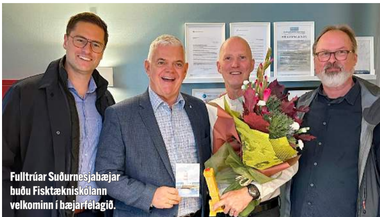
Fulltrúar Suðurnesjabæjar búðu Fisktækniskólann velkominn í bæjarfélagið.