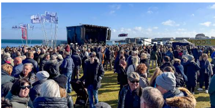
Hátíðarsvæðið á Bakkalág var þétt skipað á laugardegnum þar sem gestir Ljósanætur nutu dagskrár í veðurblíðunni, þó svo ferskir vindar hafi blásið í fánana fyrri hluta dags.