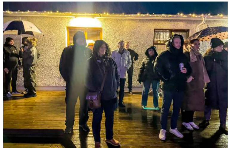
Regnhlífar komu að góðum notum á heimatónleikum á föstudagskvöldinu en veðurguðirnir ákváðu að ausa aðeins yfir hátíðargesti áður en sólinni var sleppt lausri á laugardeginum.