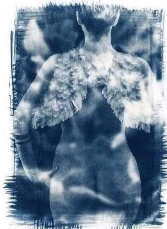
Verk eftir Adam unnið með cyanotype.

Sýning Adams í ár snýst um afgreiðslufólk í verslunum á Hafnargötunni. Áður fyrir þekktu flestir andlit afgreiðslufólks verslana en með tilkomu vefverslana og með breyttum neysluvenjum er eins og mörg af þessum andlitum séu að verða okkur ókunn. „Sýningin í ár er líka endurtekning á verkefni sem ég vann í samstarfi við tvo aðra árið 2009. Þá mynduðum við afgreiðslufólk í litlu samfélagi í Póllandi og margir vissu ekki einu sinni að þar væru verslanir. Í ár rölti ég á milli verslana á Hafnargötu og bauð þeim sem vildu að taka þátt. Fólk varð oft svolítið hvumsa þegar ég mætti í verslanirnar og spurði af hverju þau ættu að vera með. „Af því að verslunin er hérna og ég var að bjóða þér að vera með,“ svaraði ég. Þegar upp var staðið tóku 29 verslanir þátt í sýningunni.“