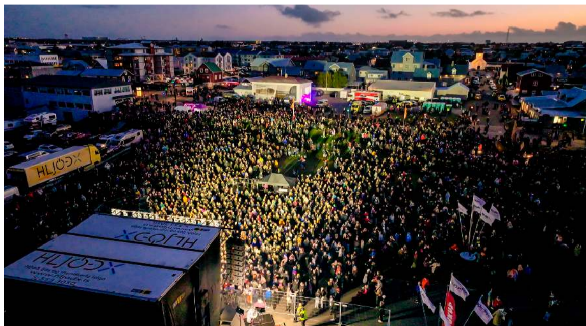
Um 30.000 manns voru á hátíðarsvæðinu þegar mest var á laugardagskvöldinu. Það átti eftir að fjölga talsvert eftir að þessi mynd var tekin.

hafi tekið þátt í dagskrá laugardagsins enda margt til skemmtunar. Hátíðin hófst formllega að venju á fimmtudegi með opnun fjölda listsýninga en um hundrað aðilar tóku þátt. Á föstudag var tónlistardagskrá á ráðhústorginu og boðið upp á kjötsúpu frá Skólamat. Heimatónleikar voru á sex stöðum. Veðurguðirnir voru í óstuði þegar leið á kvöldið en voru í góðu skapi annars alla hátíðina og hafði það mikið að segja á laugardegi þegar þúsundir fóru í árganga-