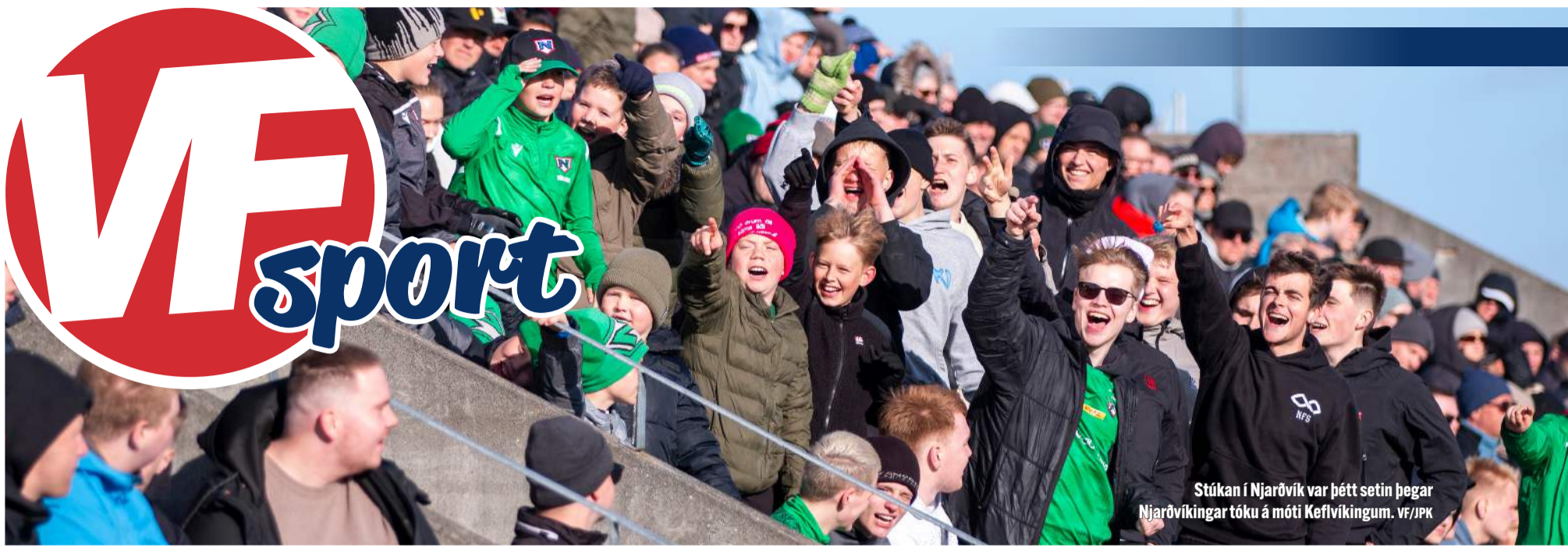
Stúkan í Njarðvík var þétt setin þegar Njarðvíkingar tóku á móti Keflvíkum.