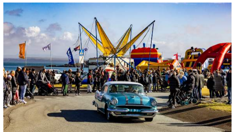
Mótorhjól og fornbílar óku í fylkingu niður Hafnargötu og voru sýnd við Keflavíkurtúnið.

göngu og enn fleiri mættu á frá-bæra tónleika um kvöldið. Margir notuðu sunnudaginn til að fara á listsýningar, sögugöngu í Keflavík og tónleika í Höfnum og í Keflavíkirkirkju.