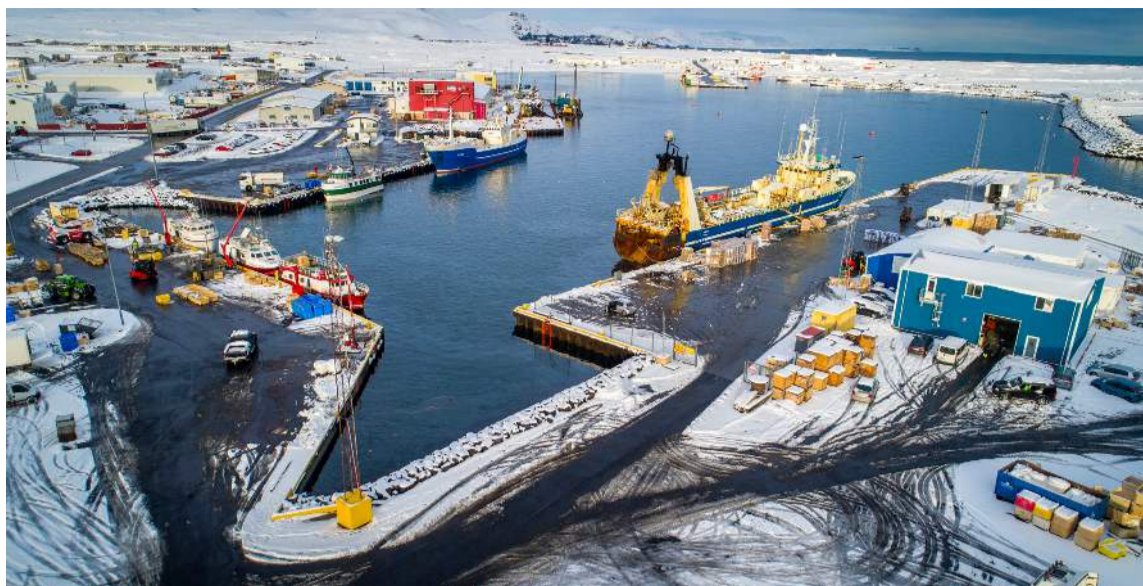
Frá Grindavíkurhöfn í byrjun apríl 2018.