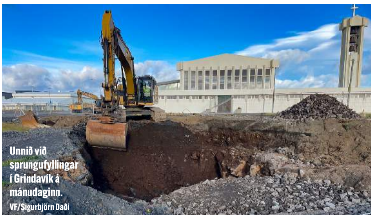
Unnið við sprungufyllingar í Grindavík á mánudaginn. VF/Sigurbjörn Daði

Ljósmyndarinn Adam Dereszkiewicz setti upp áhugaverða ljósmyndasýningu á Ljósanótt þar sem afgreiðslufólk við Hafnargötu í Reykjanesbæ voru viðfangsefni sýningarinnar. Sjá síðu 10.