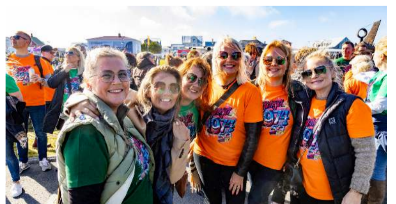
Árgangur 1974 er 50 ára á árinu og þau voru heiðruð sérstaklega á Ljósanótt.

Það var gríðarlegt mannhaf sem flæddi niður Hafnargötuna í árgangagöngunni sem er örugglega einn stærsti og fjölmennasti dagskrárliður Ljósanætur hvert ár. Árgangarnir safnast saman við sín húsnúmer við Hafnargötu en mínusa þó töluna 20 frá fæðingarári sínu. Þannig hóf árgangur 1988 gönguna við Hafnargötu 68 og árgangur 1959 byrjaði sína göngu við Hafnargötu 39. Á myndunum má sjá mannhafið í götunni og auðvitað flýgur farþegapöta yfir, hvað annað!