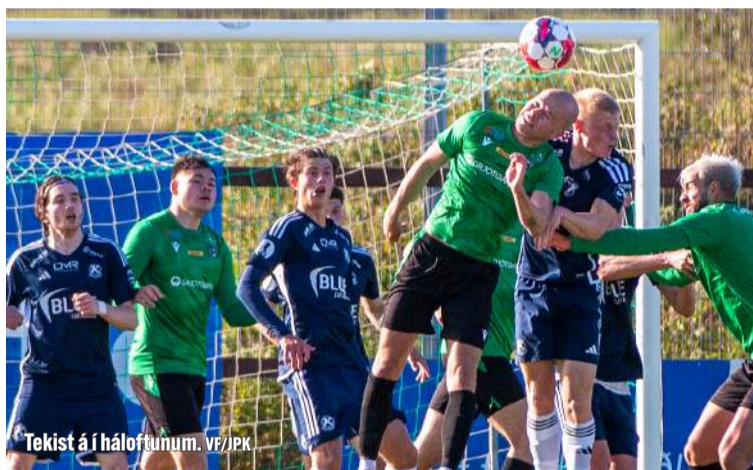
Tekist á í háloftunum.

Eyjamenn fóru langt með að tryggja sér deildarmeistaratilinn með stórsigri á Grindavík. Reyndar eru Fjölnir og Keflavík skammt frá ÍBV fyrir lokaumferðina, Fjölnismenn tveimur stigum á eftir þeim og Keflvíkingar þremur, þannig að