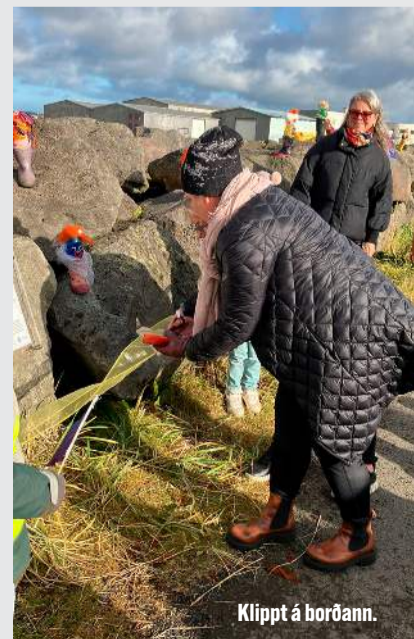
Klippt á borðann.

„Það er einlæg von okkar að garðurinn standi til frambúðar og við munum gera okkar besta til að halda honum við. Við hvetjum ykkur öll til að gera ykkur ferð og kíkja á garðinn góða,“ segir í frétt frá leikskólanum Holti.