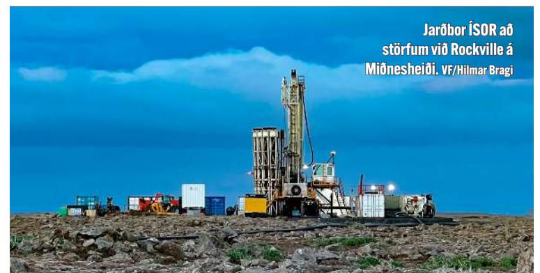
Jarðbor ÍSOR að störfum við Rockville á Miðnesheiði.