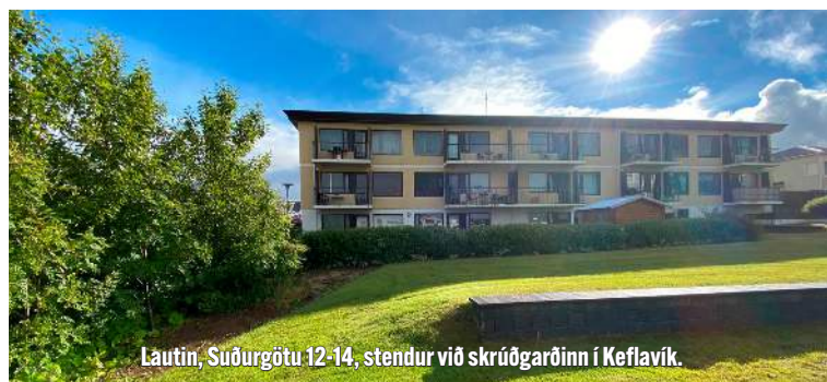
Lautin, Suðurgötu 12-14, stendur við skruðgarðinn í Keflavík.