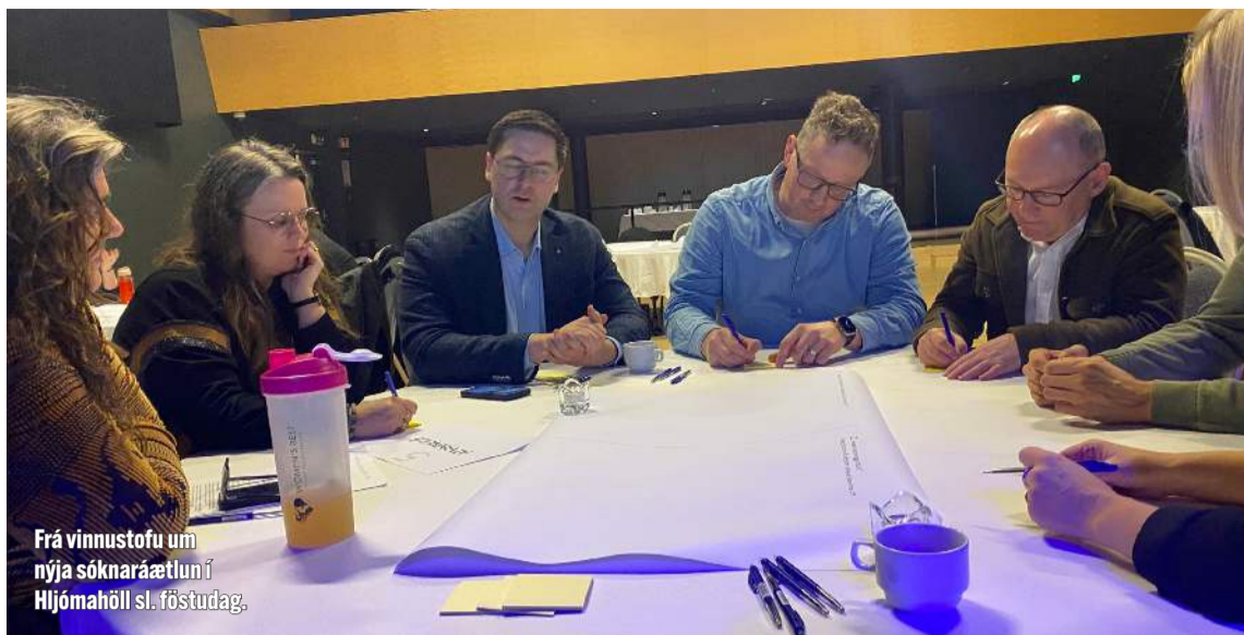
Frá vinnustofu um nýja sóknaráætlun í Hljómahöll sl. föstudag.