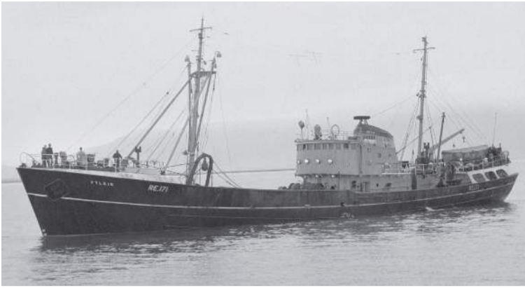
Togarinn Fylkir RE kemur inn til Reykjavíkur 7. júní 1958.