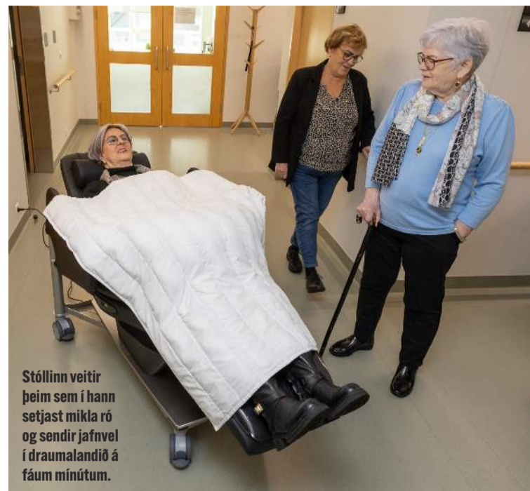
Stóllinn veitir þeim sem í hann setjast mikla ró og sendir jafnvel í draumalandið á fáum mínútum.