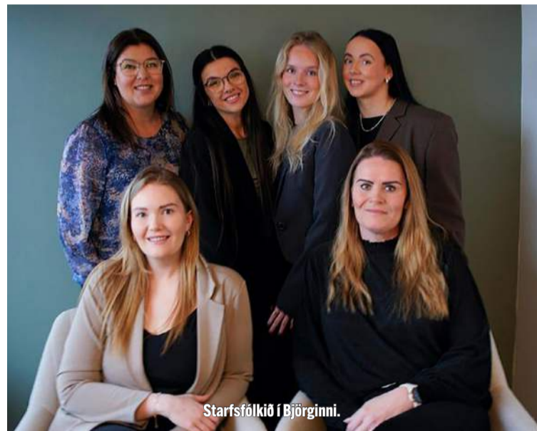
Starfsfólkið í Björginni.

Helstu markmið Bjargarinnar er að rjúfa félagslega einangrun, efla sjálfstæði einstaklinga, bæta lífsgæði, auka samfélagsþátttöku og draga úr stofnanainnlögnum. Björgin vinnur einnig að því að auka þekkingu almennings á geðheilbrigðismálum og stuðla að náungakærleika og skilningi í samfélaginu. Björgin er úrræði sem hefur mikla sérstöðu hér á svæðinu