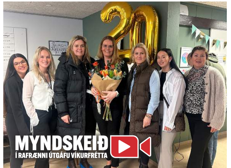
MYNDSKEIÐ Í RAFRÆNNI ÚTGÁFU VÍKURFRÉTTA