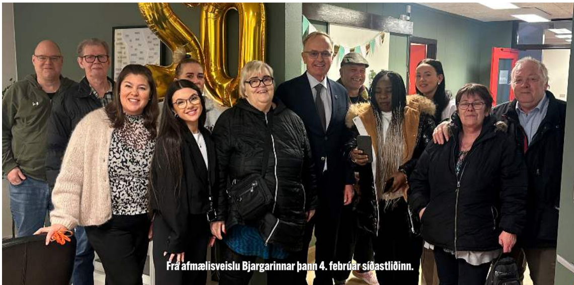
Frá afmælisveislu Bjargarinnar þann 4. febrúar síðastliðinn.