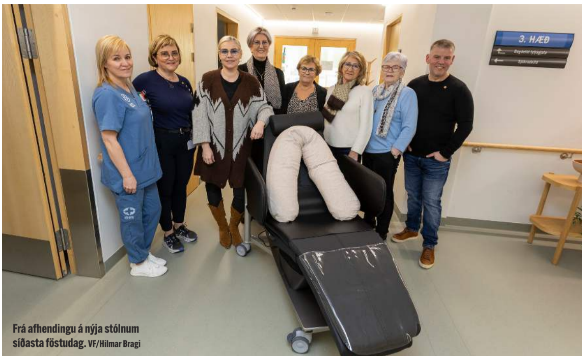
Frá afhendingu á nýja stólum síðasta föstudag.