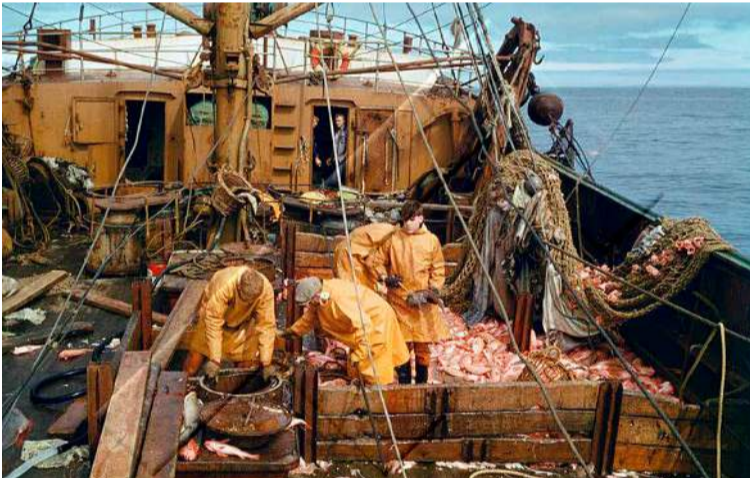
Þarna er núbúið að taka trollið en pokinn enn á lunningunni.