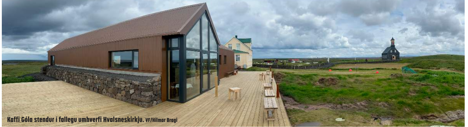
Kaffi Góla stendur í fallegu umhverfi Hvalsneskirkju.