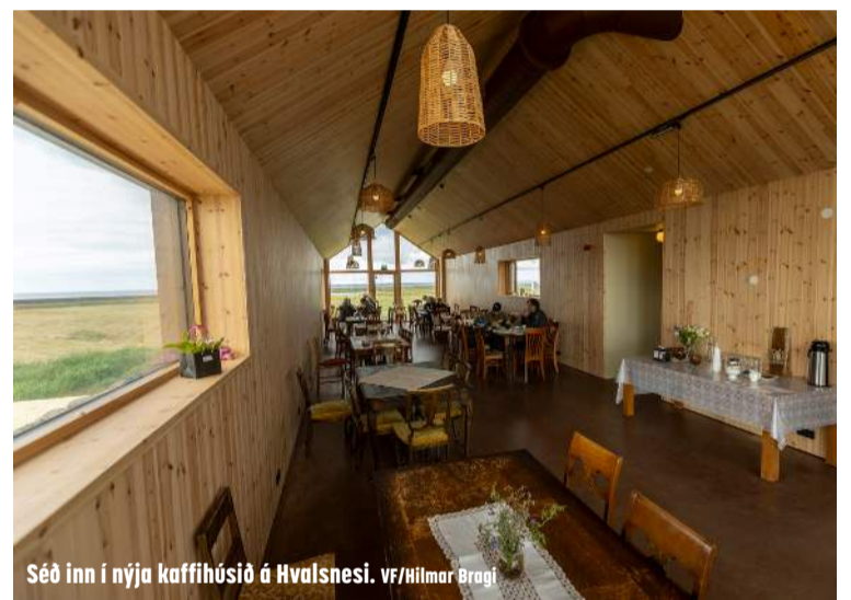
Séð inn í nýja kaffihúsið á Hvalsnesi.