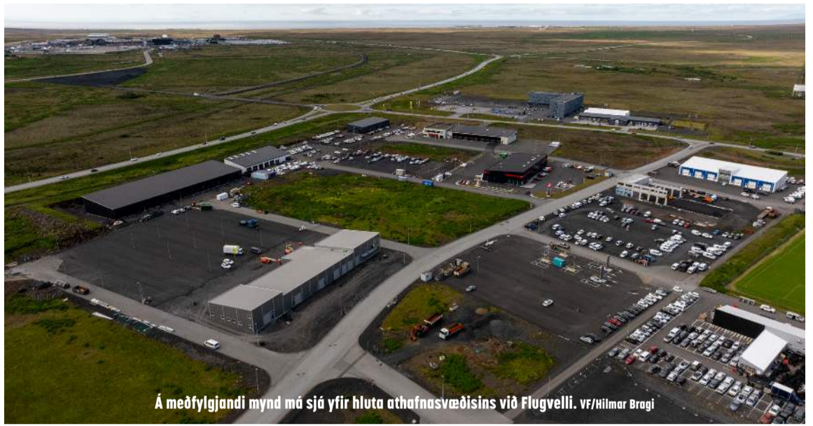
Á meðfylgjandi mynd má sjá yfir hluta athafnasvæðisins við Flugvelli.