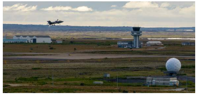
F-35 þota kemur til landingar á Keflavíkflugvelli á dögunum.