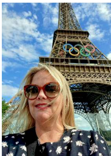
Sjá viðtal í miðopnu!