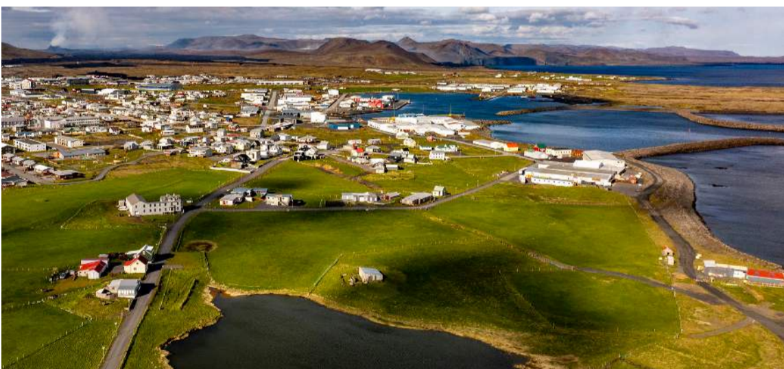
Svæðið þar sem flóð geta m.a. haft áhrif.

þá verður gott fyrir tónleikagesti að koma við hjá okkur áður og fá sér hressingu. Við munum vera með opið frá 9-17 alla daga, viljum geta boðið aðilum upp á að leigja salinn eftir klukkan fimm en hægt er að halda alls kyns viðburði hjá okkur,“ sagði Magnea að lokum.