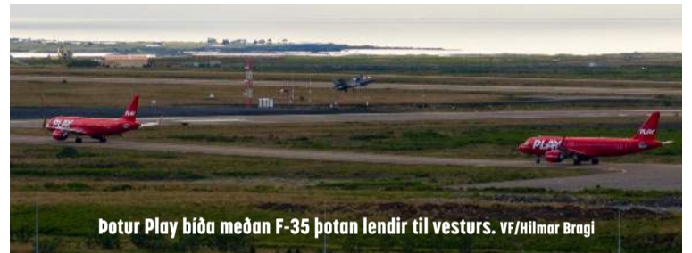
Þotur Play bíða meðan F-35 þotan lendir til vesturs. VF/Hilmar Bragi

Ráðgert er að loftrýmisgæslunni ljúki í byrjun september.