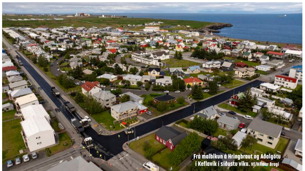
Frá malbikun á Hringbraut og Aðalgötu í Keflavík í síðustu viku.

Fyrirtækin á Flugvöllum eru flest í ferðaþjónustutengdri starfsemi og í þjónustu við bíla. Þar er líka að finna hleðslustöðvar, eldsneytisstöð, smurstöð og dekkjaverkstæði. Þá eru Brunavarnir Suðurnesja með slökkvistöð við Flugvelli, svo eitthvað sé nefnt.