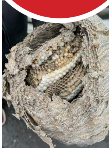
Geitungabúið er mikil listasmiði.

Hátíðin hefst á fimmtudag með tónleikum í Háabjalla. Aðalhátíðisdagurinn er svo á laugardag þar sem fer fram fjölbreytt dagskrá í Aragerði. Nánar má sjá um fjölskyldudagana á vef Víkurfretta, vf.is