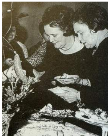
Þær eru ófáar veislurnar í gegnum tíðina.