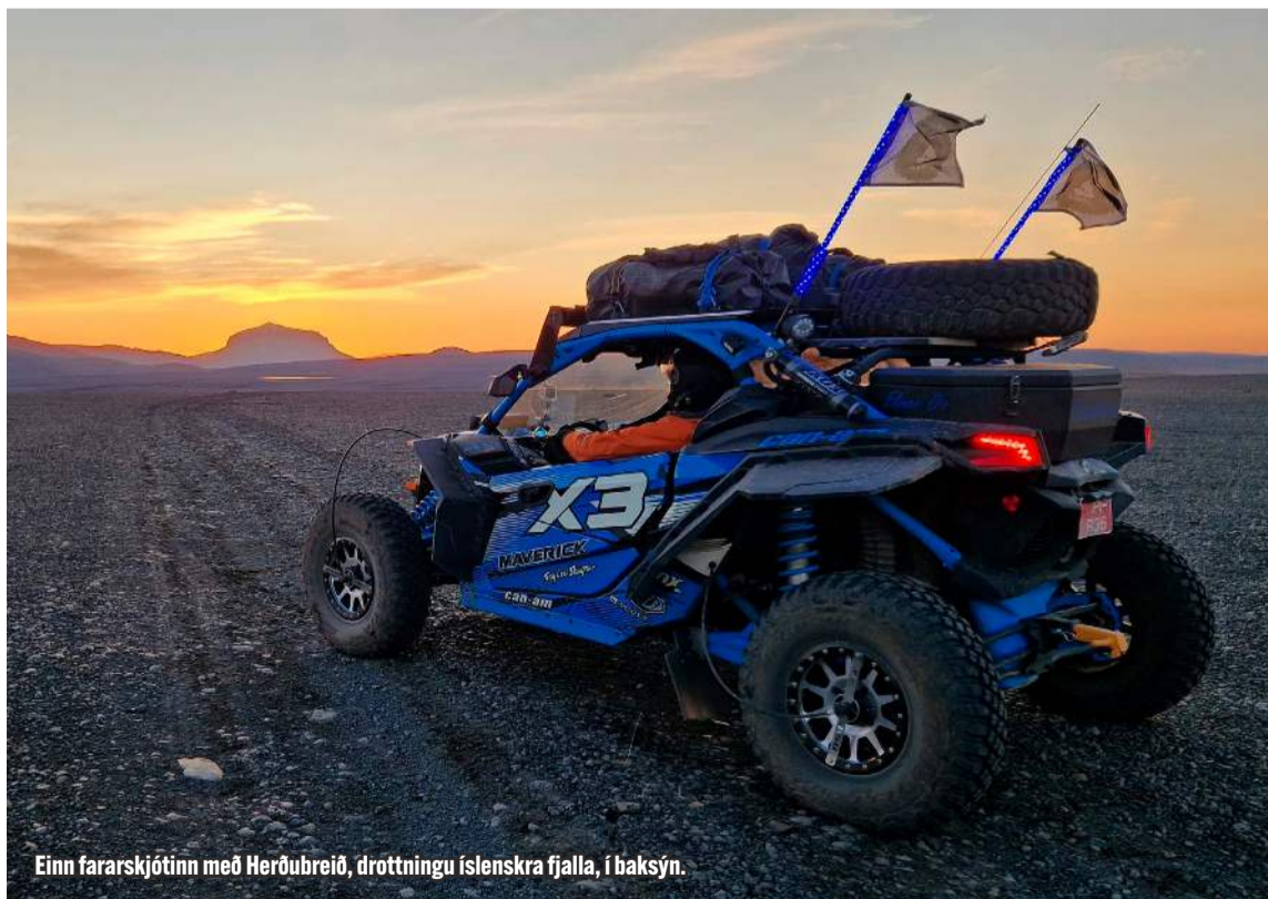
Einn fararskjóttinn með Herðubreið, drottningu íslenskra fjalla, í baksýn.

Dalatangi tók vel á móti hópnum og staldrað var lengi við í Mjóafirði. Þetta var einn lengsti dagur ferðalagsins í ferðatíma en frá Dalatanga var ferðinni heitið í Drekgil. Þangað var komið um nótt og þar gíst í fjallaskála. Í Drekgili þurfti að takast á við