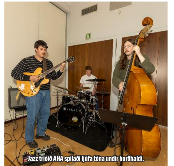
Jazz tríóið AHA spilaði ljúfa tóna undir borðhaldi.