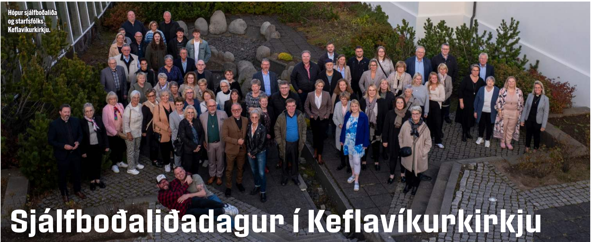
Hópur sjálfboðaliða og starfsfólks Keflavíkurkirkju.