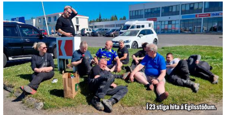
Í 23 stiga hita á Egilsstöðum.