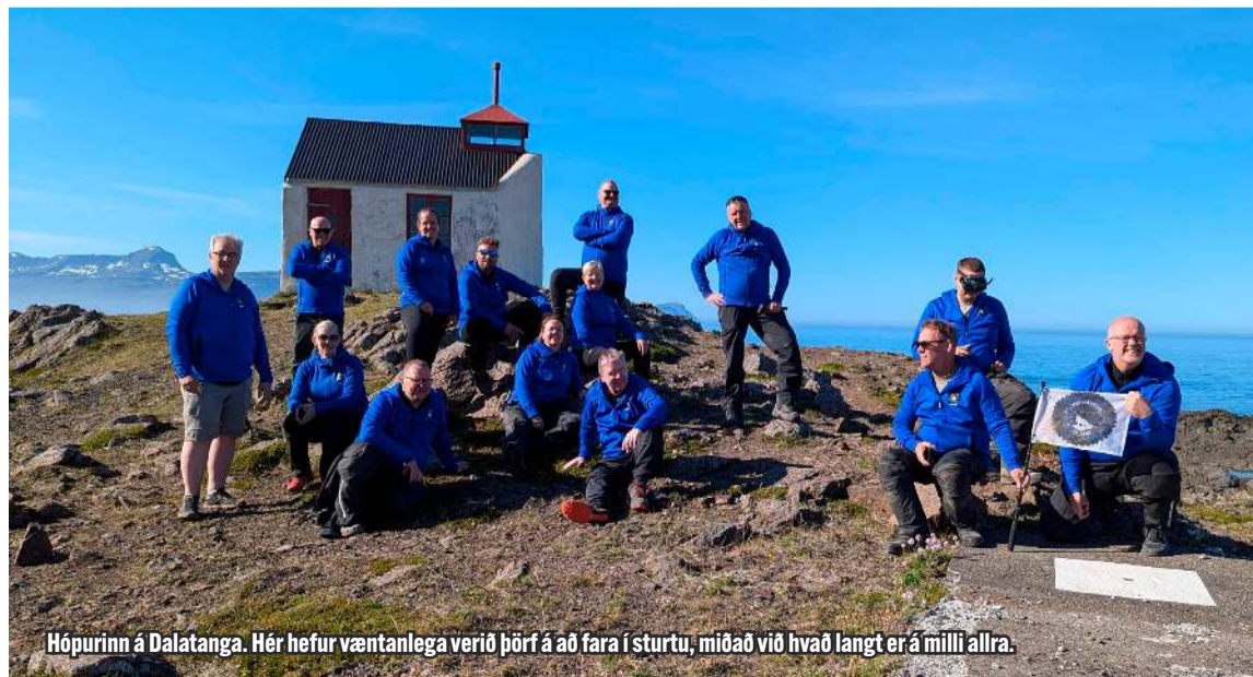
Hópurinn á Dalatanga. Hér hefur væntanlega verið þörf á að fara í sturtu, miðað við hvað langt er á milli allra.

Þegar blaðamaður spyr hvort landið hafi verið afgreitt með þessu ríflega 3.000 km. ferðalagi þvers og kruss, þá er það ekki raunin. Næsta stóra ferð hefur þegar verið ákveðin. Hún er frá Sauðanesi, austan við Höfn í Hornafirði og að Sauðanesi vestur á fjörðum frá 16. til 23. júlí 2025.