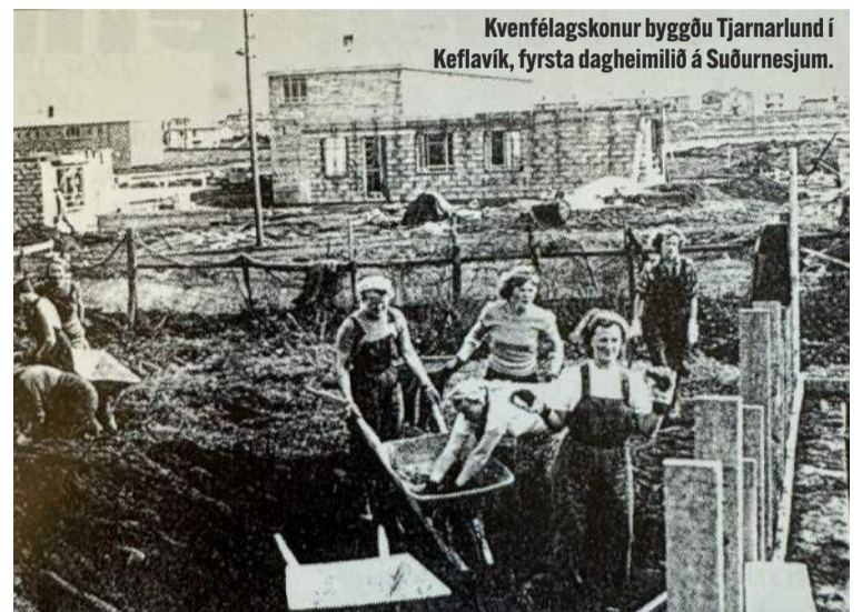
Kvenfélagskonur byggðu Tjarnarlund í Keflavík, fyrsta dagheimilið á Suðurnesjum.