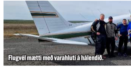
Flugvél mætti með varahluti á hálandið.