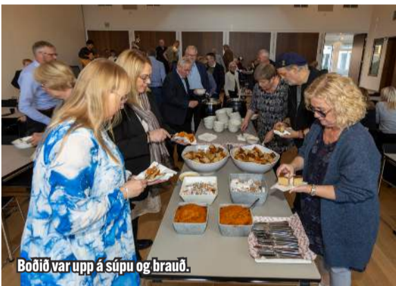
Borðið var upp á súpu og brauð.