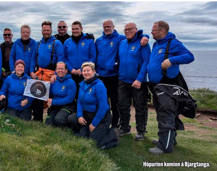
Hópurinn kominn á Bjargtanga.