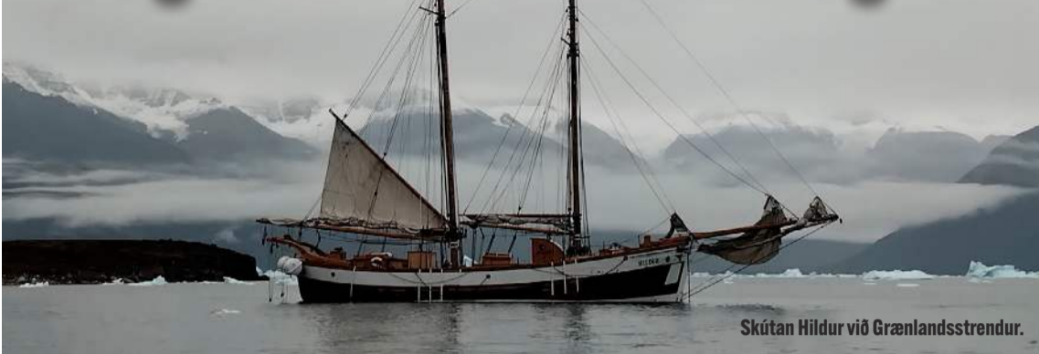
Skútan Hildur við Grænlandsstrendur.

Sagnastund á Garðskaga verður haldin laugardaginn 19. október 2024 kl. 15:00. Skútusigling við Grænland verður efni sagnastundar að þessu sinni.