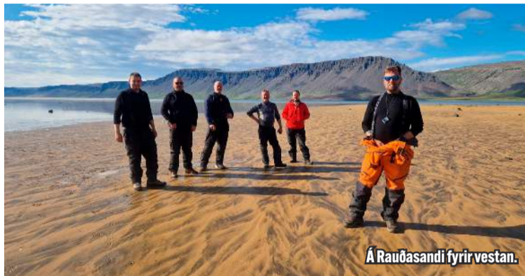
Á Rauðasandi fyrir vestan.