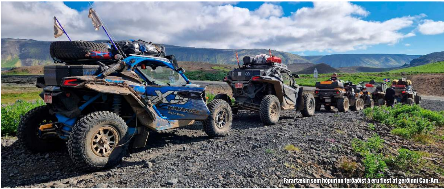
Farartækin sem hópurinn ferðaðist á eru flest af gerðinni Can-Am.