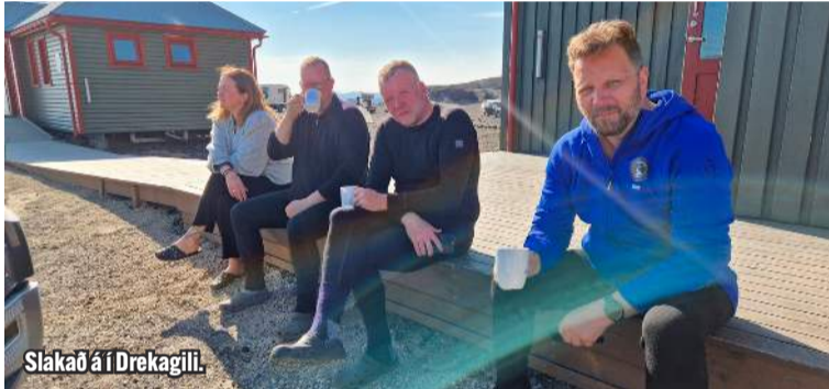
Slakað á í Drekgili.