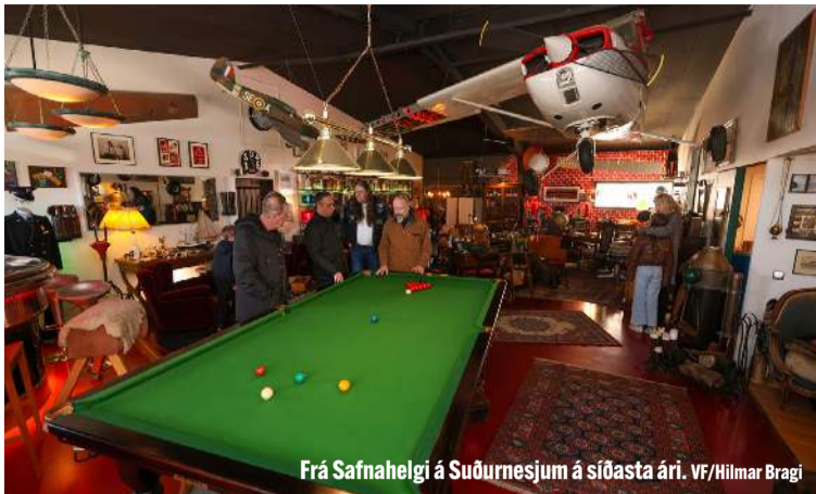
Frá Safnahelgi á Suðurnesjum á síðasta ári.

Sérstakur opnunarviðburður Safnahelgar verður haldinn í nýrri