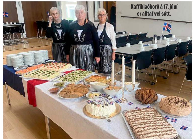
Kaffihlaðborð á 17. júní er alltaf vel sótt.