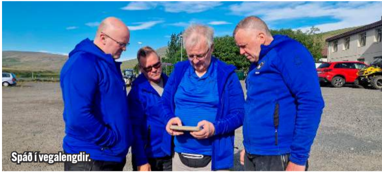
Spáð í vegalengdir.