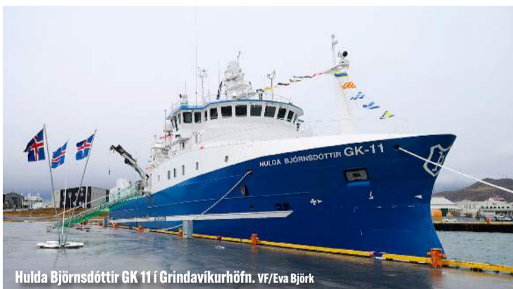
Hulda Björnsdóttir GK 11 í Grindavíkurhöfn.