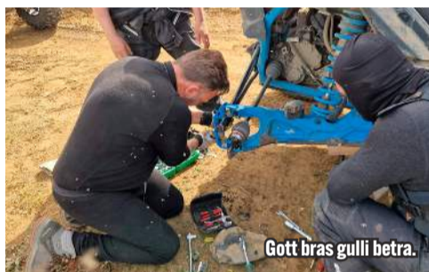
Gott bras gulli betra.