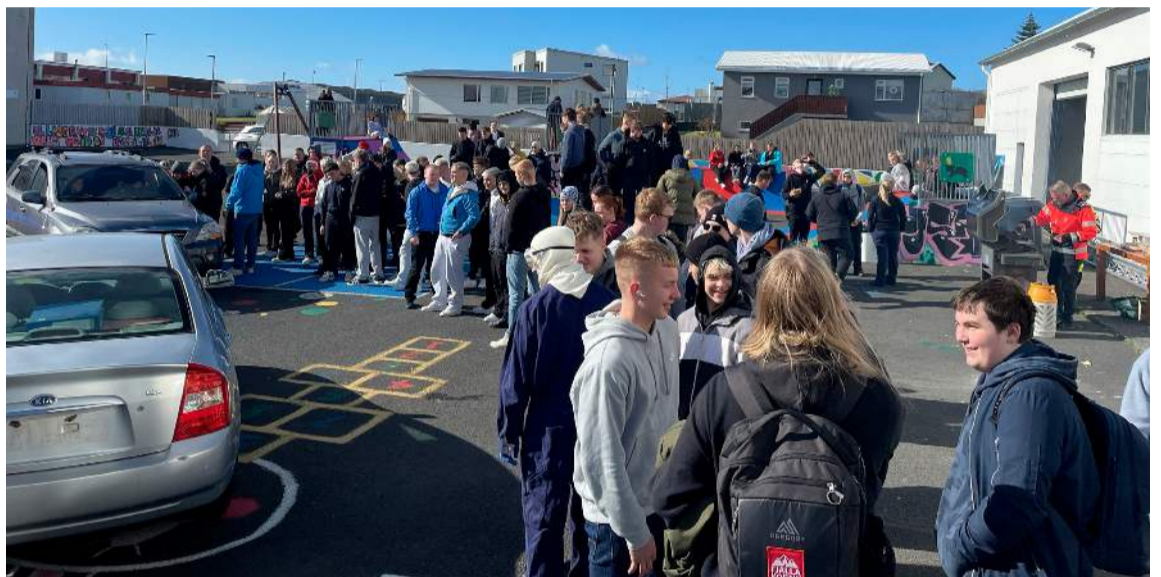
■ Forvarnardagur ungra ökumanna haldinn við 88 húsið

Töluverð vinna leggst á forstöðumenn frístundaheimilanna við skipulagningu og framkvæmd á frístundaakstrinum. Því fylgir óneitanlega aukið álag á starfsemi. Menntaráð hrósar forstöðumönnum frístundaheimilanna í fundargerð fyrir hversu vel þeir standa að þessari framkvæmd.