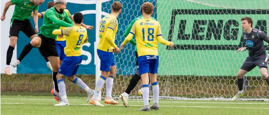
Njarðvíkingar voru hársbreidd frá því að tvöfalda forystuna snemma í seinni hálfleik en skalli eftir hornspyrnu fór naumlega framhjá marki Grindavíkur.