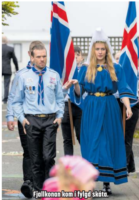
Fjallkonan kom í fylgd skáta.