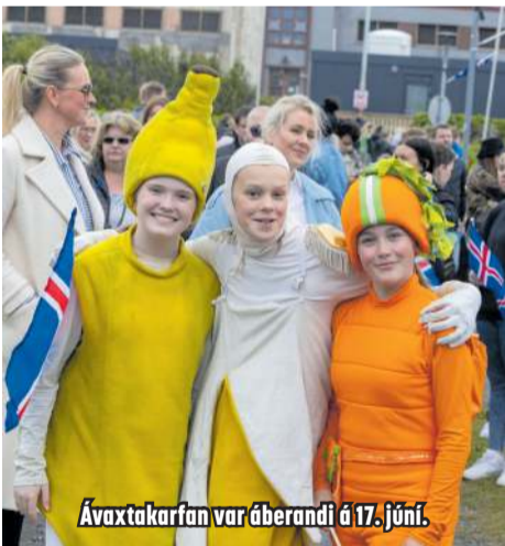
Ávaxtakarfan var áberandi á 17. júní.

Þegar formllegri hátíðardagskrá lauk tók við önnur og léttari dagskrá í skrúðgarðinum fram eftir degi.