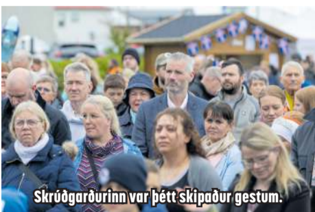
Skrúðgarðurinn var þétt skipaður gestum.