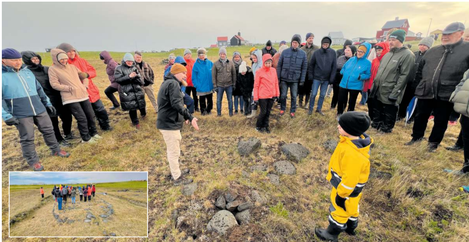
Fjölmennt var í sögugungunni í Höfnum þar sem fornleifar frá því fyrir landnám Íslands voru skoðaðar.

Bæjarstjórn Grindavíkur bindur miklar vonir við að fljótlega skapist aðstæður til að leggja niður lokunarpóstana. Sú framkvæmd og mat á þörf fyrir lokunarpósta liggur í höndum lögreglustjórans á Suðurnesjum og framkvæmdarnefndarinnar eins og lög kveða á um. Bæjarstjórn hvetur framangreinda aðila til að skoða áskorunina með jákvæðum augum.