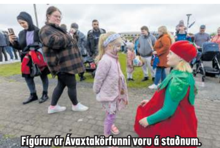
Fígúrir úr Ávaxtakörfunni voru á staðnum.