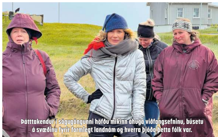
Þátttakendur í sögugöngunni höfðu mikinn áhuga viðfangsefninu, búsetu á svæðinu fyrir formlegt landnám og hverra þjóða þetta fólk var.