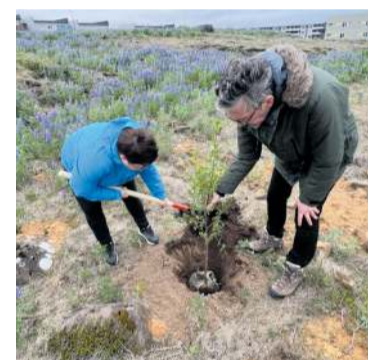
Frá gróðursetningunni við Kamb í síðustu viku.