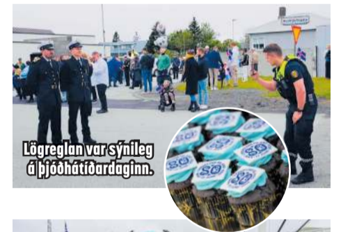
Lögreglan var sýnileg á þjóðhátíðardaginn.