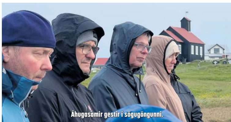
Áhugasamir gestir í sögugöngunni.

Landnámsskálinn fannst við Kirkjuvogskirkju árið 2003 þegar unnið var að fornleifaskráningu í bæjarlandinu. Þegar prufuholur voru gerðar kom í ljós að skálinn gæti ekki verið yngri en frá aldamótunum 900 sem setur hann í flokk meðal elstu byggðarleifa á Íslandi. Jarðvegsmæling á öllu svæðinu sýndi svo fleiri rústir og þykir það sérstaklega áhugavert þar sem ekki hefur verið byggt ofan á rústirnar eins og venja hefur verið. Talið er að íbúarnir hafi búið á staðnum í nokkra áratugi en síðan flutt í burt eða flutt bæjarstæðið til.