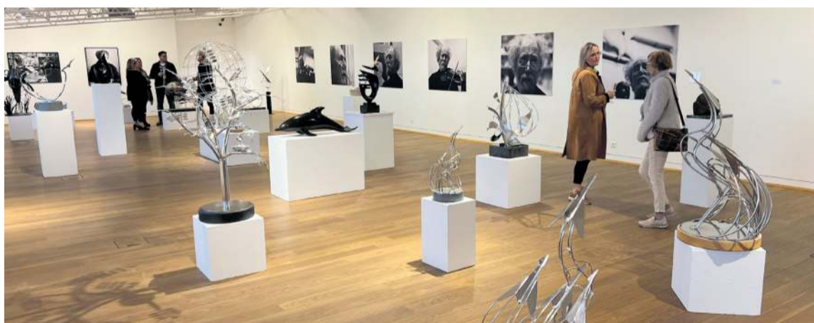
Frá sýningu Erlings Jónssonar í innri sal Listasafns Reykjanesbæjar.