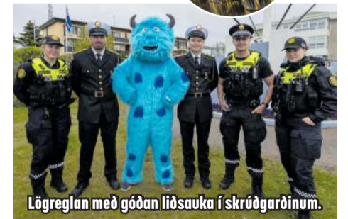
Lögreglan með góðan liðsauka í skrúðgarðinum.