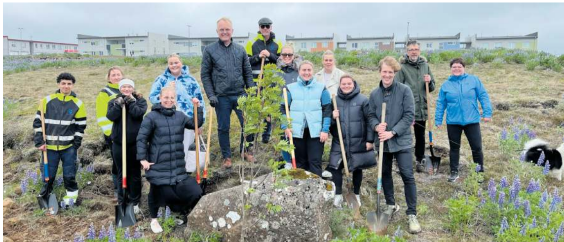
Myndarlegur hópur sem tók að sér að gróðursetja plönturnar í Innri-Njarðvík.