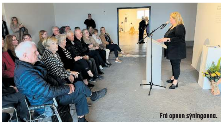
Frá opnun sýninganna.

Sýningarnar munu standa til 18. ágúst 2024.