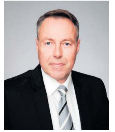
Birgir Þórarinnsson Höfundur er alþingismaður Sjálfstæðisflokksins og situr í flóttamannanefnd Evrópuráðsins.

Áhyggjuefni er að Samfylkingin, sem mælt hefur stærsti stjórnmálaflokkurinn í könnunum, skuli hvorki hafa burði né vilja til að styðja herta löggjöf í útlendingamálum. Í febrúar sagði formaður Samfylkingarinnar í ræðu á Alþingi að hún tæki mark á áhyggjum almennings í útlendingamálum. Þegar á hólminn var komið var ekki að marka þau orð. Samfylkingin stóð ekki með almenningi og sat hjá í atkvæðagreiðslunni. Engin rök mæla með því að Ísland, fámennasta land Evrópu, skuli taka á móti hlutfallslega flestum hælisleitendum. Örugg landamæri eru forsenda velferðarkerfis, sjálfbæra ríkisfjármála og traustra innviða. Regluverkið á Íslandi í útlendingamálum verður að taka mið af fámenni þjóðarinnar.