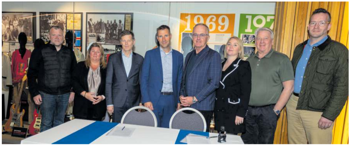
Frá undirritun samkomulagsins. Fulltrúar Reykjanesbæjar og Samherja fiskeldis samankomnir í Rokksafni Íslands.