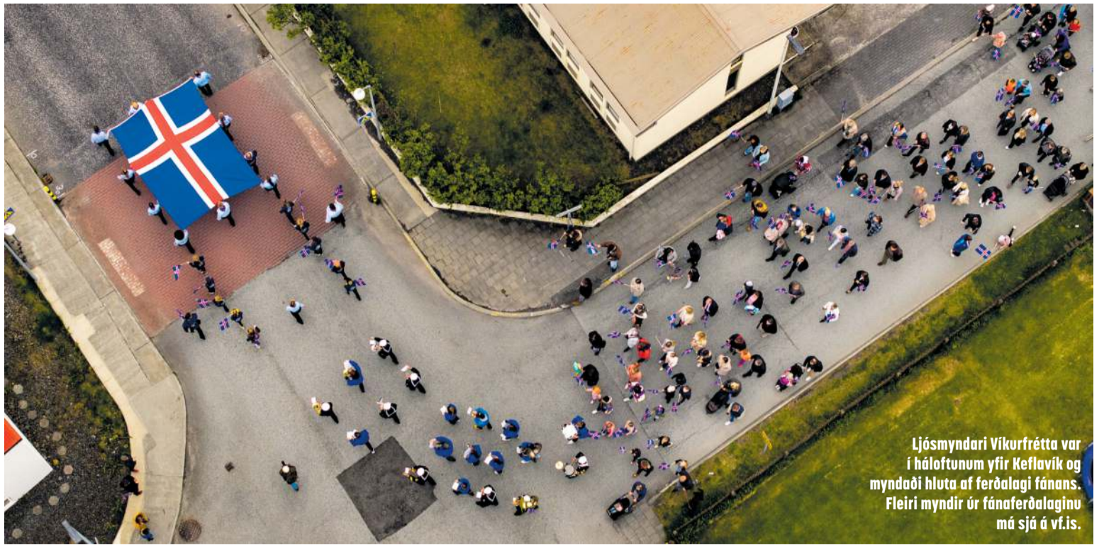
Ljósmyndari Víkurfrétta var í háloftunum yfir Keflavík og myndaði hluta af ferðalagi fánans. Fleiri myndir úr fánuferðalaginu má sjá á vf.is.

Að lokinni hátíðarguðsþjónustu í Keflavík-urkirkju var gengið fylktu liði með hátíðarfánann í skrúðgarðinn í Keflavík undir forystu skáta úr Heiðabúum og Lúðra-sveitar Tónlistarskóla Reykjanes-bæjar ásamt sérstökum gestum úr U.S. Naval Forces Europe and Africa Band sem eru í heimsókn hér á landi á vegum bandaríska sendi-ráðsins.