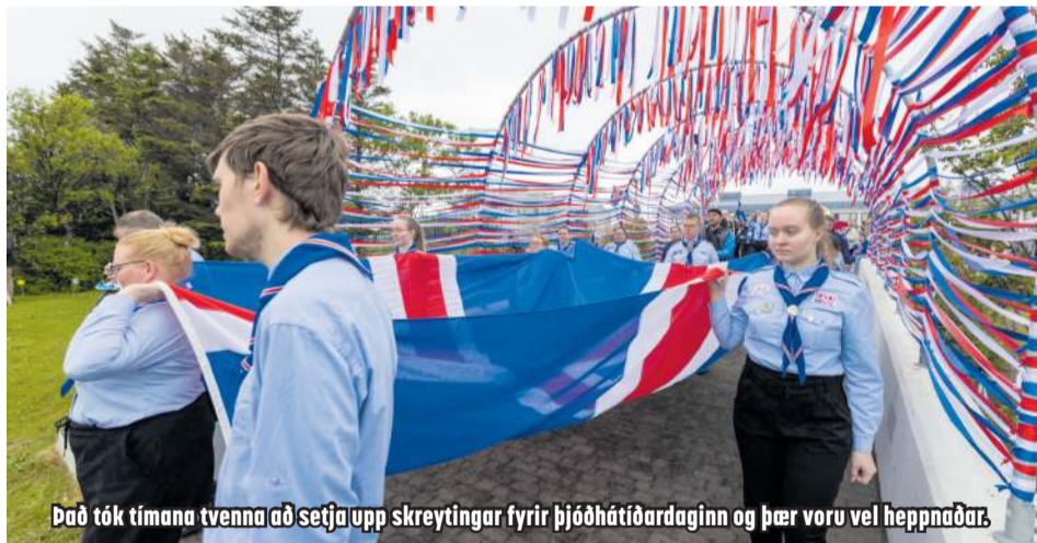
Það tók tímana tvenna að setja upp skreytingar fyrir þjóðhátíðardaginn og þær voru vel heppnaðar.