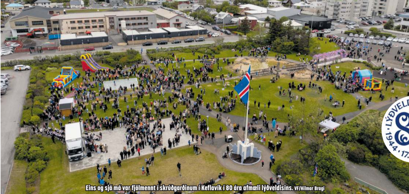
Eins og sjá má var fjöldmennt í skrúðgarðinum í Keflavík í 80 ára afmæli lýðveldisins.