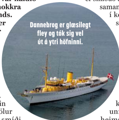
Dannebrog er glæsilegt fley og tók sig vel út á ytri höfninni.

skip, Bata- og bryggjubrólt, með myndum Víkurfréttanna. Snekkjan er öll hin glæsilegasta. Kjölur var lagður að smíði hennar árið 1931 og hleypt af stokkunum í ársbyrjun 1932 af Alexandrine drottningu Dana sem ríkti frá 1912 til 1947 en hún var gift Kristjáni X Danakonungi. Þetta segir okkur það að drottning þessi ríkti einnig yfir okkur Íslendingum frá 1918 til 1944 en það er