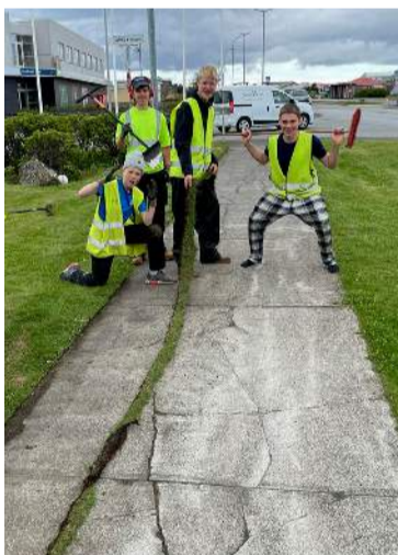
Úr starfsemi vinnuskólans í Suðurnesjabæ.