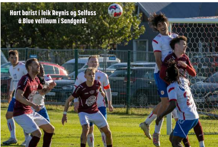
Hart barist í leik Reynis og Selfoss á Blue velli í Sandgerði.