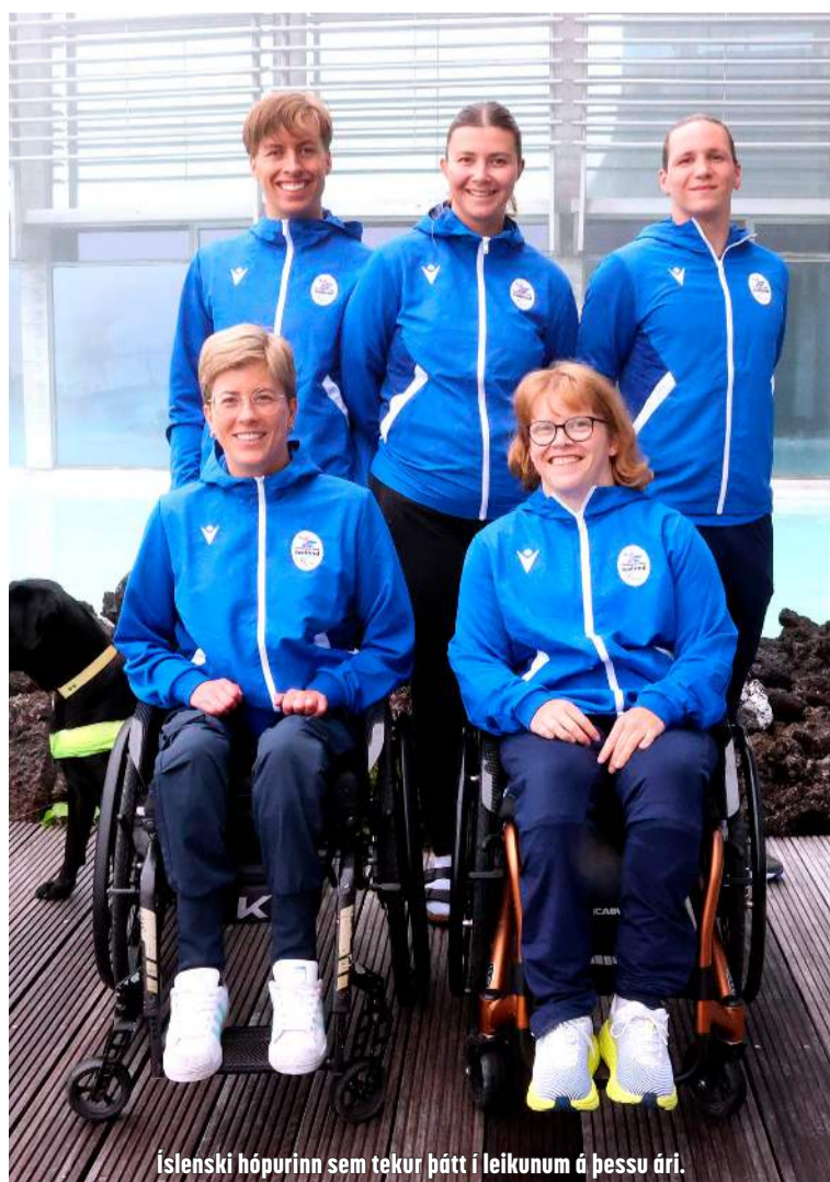
Íslenski hópurinn sem tekur þátt í leikunum á þessu ári.

Már er með mörg járn í eldinum. Samhliða æfingum fyrir Ólympíuleikana er hann að taka upp plötu og skipuleggja þrenna stórtónleika ásamt the Royal Northern College