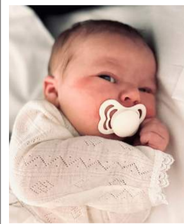
Stúlka fædd 6. ágúst 2024 á ljós-mæðravakt Heilbrigðisstofnunar Suðurnesja.

Hvað segið þið hjá ÍRB – einhverjir aukamiðar hjá ykkur til sölu?