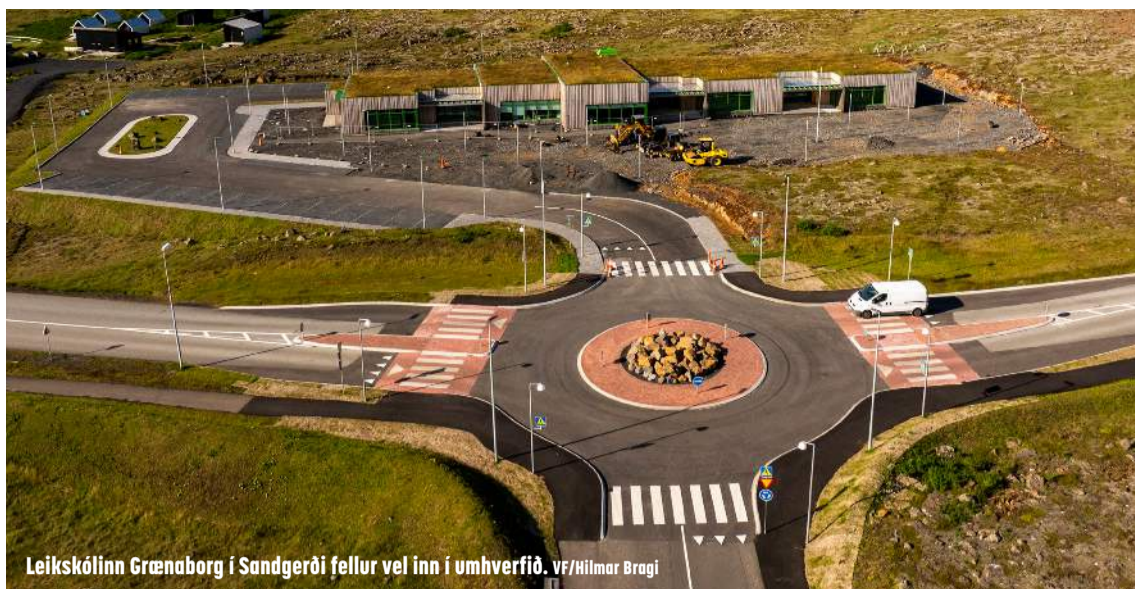
Leikskólinn Grænaborg í Sandgerði fellur vel inn í umhverfið.