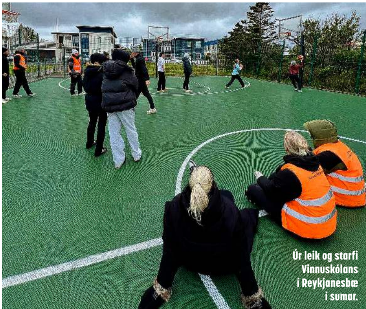
Úr leik og starfi Vinnuskólans í Reykjaneshæ í sumar.