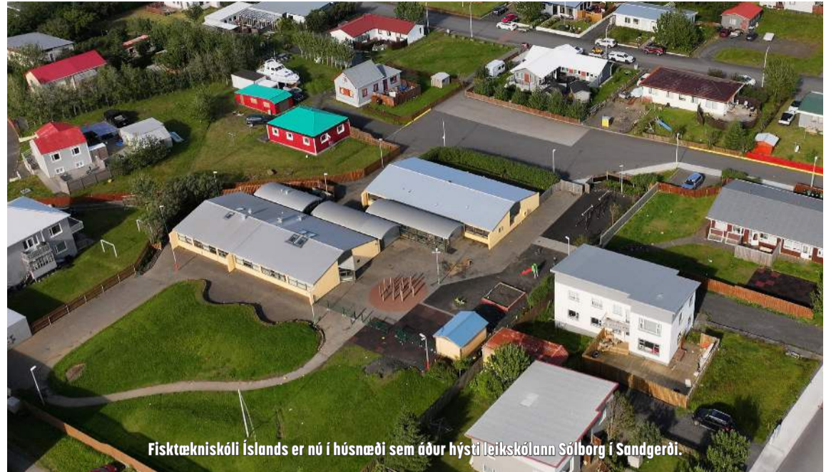
Fisktækniskóli Íslands er nú í húsnæði sem áður hýsti leikskólann Sólborg í Sandgerði.

þakklát fyrir. Í ársbyrjun fórum við að horfa í kringum okkur með húsnæði fyrir þessa haustönn og var bent á þetta húsnæði hér sem áður hýsti leikskólann Sólborg. Byggður var nýr leikskóli, Grænaborg, og hófst starfsemi þar fyrir stuttu og því bauðst okkur þetta húsnæði. Það vill líka svo skemmtilega til að meirihluti nemenda kemur frá Sandgerði svo þetta hentar öllum mjög vel núna.