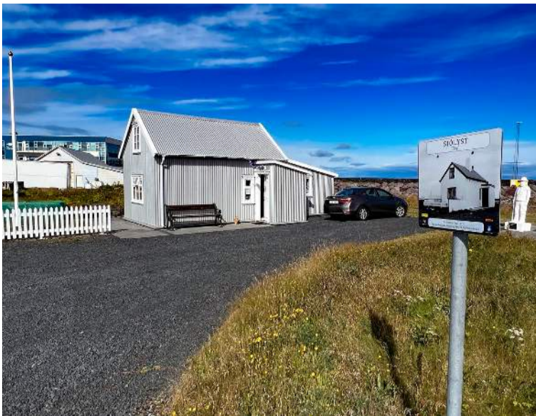
Sjólyst í Garði, einnig kölluð Unuhús, stendur í Gerðum í Garði.