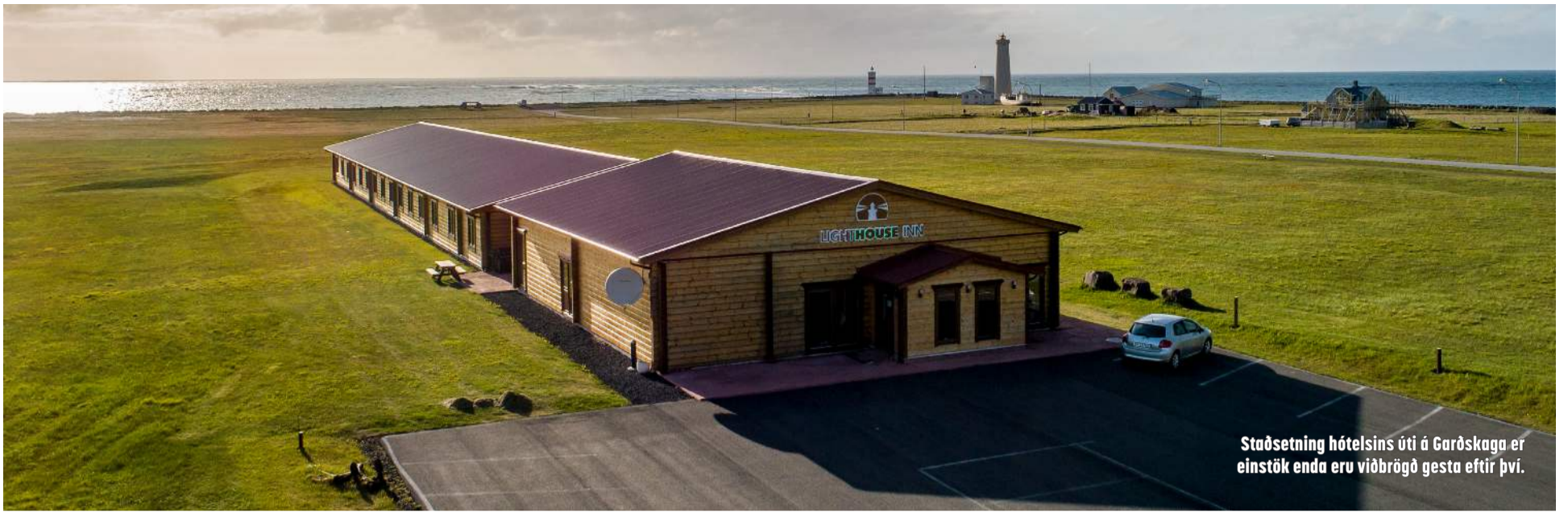
Staðsetning hótelsins úti á Garðskaga er einstök enda eru viðbrögð gesta eftir því.