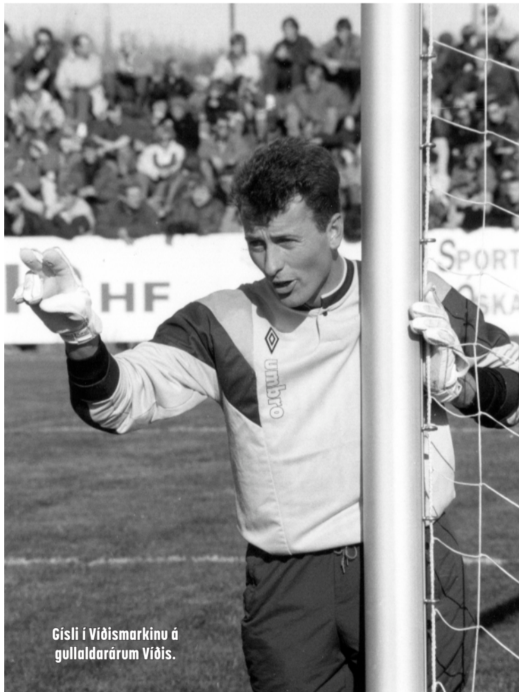
Gísli í Víðismarkinu á gullaldarárnum Víðis.

Svo er spennandi verkefni að fara í gang við hliðina á okkur, nálægt fjörunni á Garðskaga, Mermaid geothermal seaweed spa. Þetta verður baðaðstaða með heitum potti, sjósundi, nuddi o.fl. og þarinn og þangið er m.a. notað. Þetta er mjög spennandi verkefni og mun styðja vel við okkur á hótelinu og aðra í ferðaþjónustugeir-