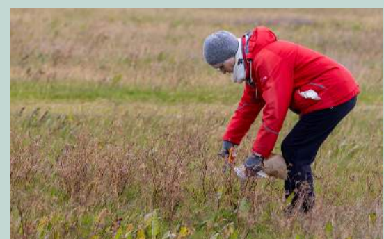
Frá kúmentinslu á Garðskaga síðasta sunnudagsmorgun.