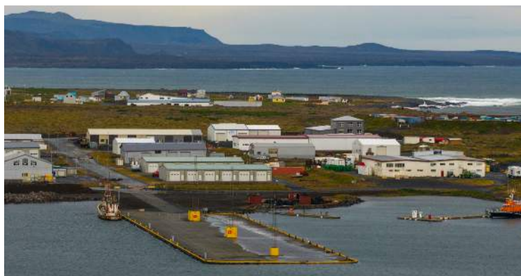
Eyjabakkinn í Grindavík á stórsstraumsflóði í Grindavík í síðustu viku.