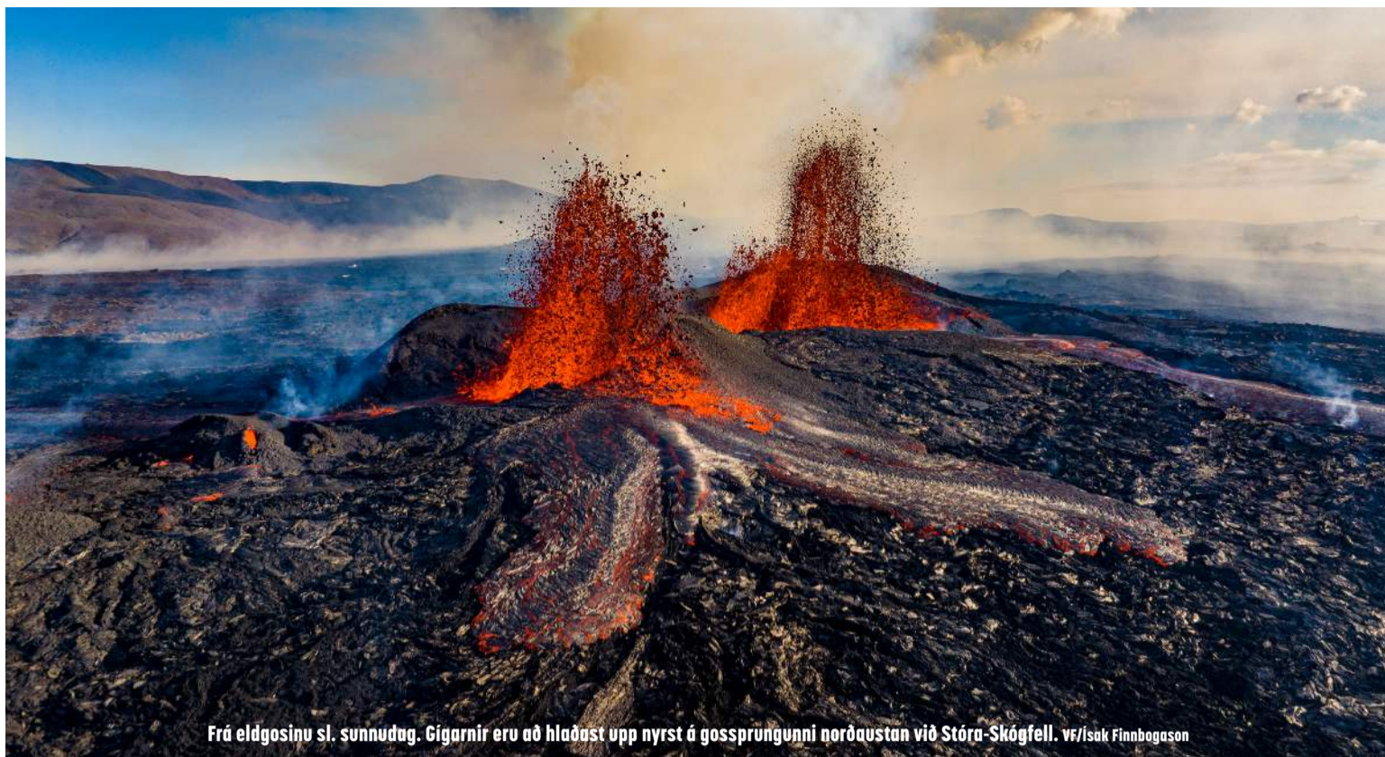
Frá eldgosinu sl. sunnudag. Gígarnir eru að hlaðast upp nyrst á gossprungunni norðaustan við Stóra-Skógfell.

Þorvaldur segir að annað sem er athyglisvert við þetta sjötta gos á Sundhnúkareininni er hversu langt gossprungan hefur teygst sig til norðurs eftir Sundhnúkareininni. Gosið á reininni fyrir 2500 árum gerði slíkt hið sama og viðheldur virkninni á þeim hluta reinarinnar. Á sama tíma slökknadi á syðri hluta reinarinnar, þar sem meginþungi virkninnar hefur verið í fimm undanförunum gosum, þ.e. frá 18. desember 2023 til 22. júní 2024. Þorvaldur segir það vera hugsanlegt að þessi tilfærsla á virkninni stafi af breytingum á gosrásarkerfinu neðanjarðar og að stóri skjálftinn seint þann 22. ágúst 2024 (kl. 22:37:38; stærð 4.1) og þeir sem á eftir fylgdu séu tengdir hreyfingunum sem ollu þessum breytingum.