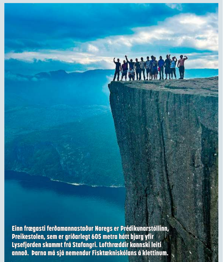
Einn frægasti ferðamannastaður Noregs er Prédikunarstóllinn, Preikestolen, sem er gríðarlegt 605 metra hátt bjarg yfir Lysefjorden skammt frá Stafangri. Lofthæddir kannski leiti annað. Þarna má sjá nemendur Fisktækniskólans á klettinum.

Gríðarleg eftirspurn er eftir fólki sem hefur sérhæft sig í þessum greinum sjávarútvegsins og má með sanni segja að framtíðin sé björt hvað varðar vel launuð störf í sjávarútvegi, fiskvinnslu, veiðar-