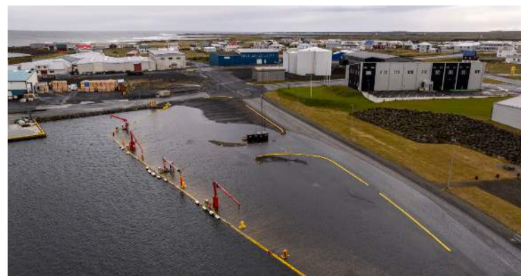
Sjór flæddi upp á Seljabót við Kviabryggjuna á stórsstraumsflóðinu í síðustu viku.

16 SÍÐUR Í ÞESSARI VIKU • STÆRSTA FRÉTTA- OG AUGLÝSINGABLAÐIÐ Á SUÐURNESJUM