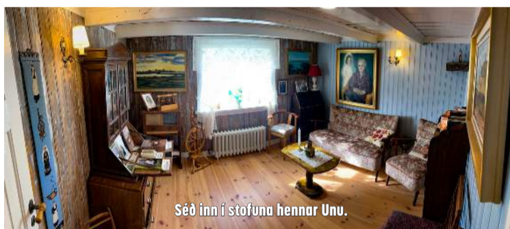
Séð inn í stofuna hennar Unu.

Í Unuhúsi/Sjólyst verður opið allar helgar út september. Þar er hægt að