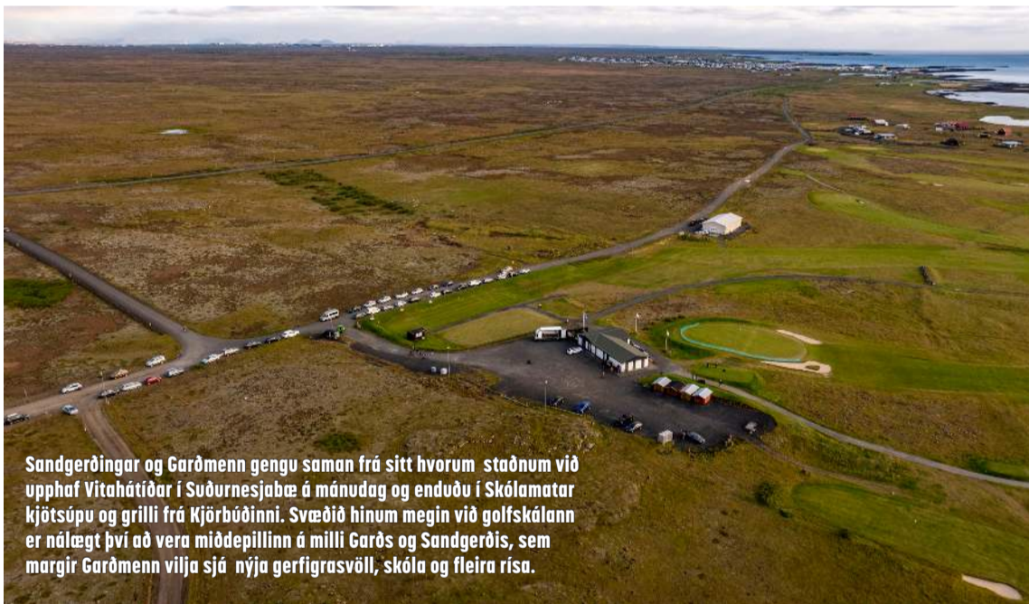
Sandgerðingar og Garðmenn gengu saman frá sitt hvorum staðnum við upphaf Vítahátíðar í Suðurnesjabæ á mánudag og enduðu í Skólamatar kjötsúpu og grilli frá Kjörbúðinni. Svæðið hinum megin við golfskálann er nálægt því að vera miðepillinn á milli Garðs og Sandgerðis, sem margir Garðmenn vilja sjá nýja gervigrasvöll, skóla og fleira rísa.