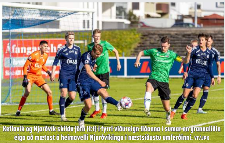
Keflavík og Njarðvík skildu jöfn (1:1) í fyrri viðureign liðanna í sumar en grannaliðin eiga að mætast á heimavelli Njarðvíkinga í næstsíðustu umferðinni.

Njarðvík og Keflavík eru meðal efstu liða í Lengjudeildinni þegar þrjár umferðir eru óleiknar. Bæði lið hafa 31 stig og eru með sama markahlutfall en Njarðvíkingar hafa skorað einu marki fleiri, nýliðar ÍR eru einnig með 31 stig en lakara markahlutfall.