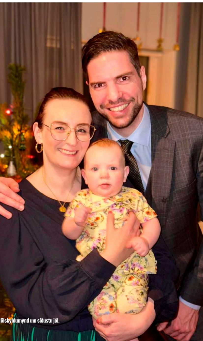
Ljósmynd um síðustu jól.