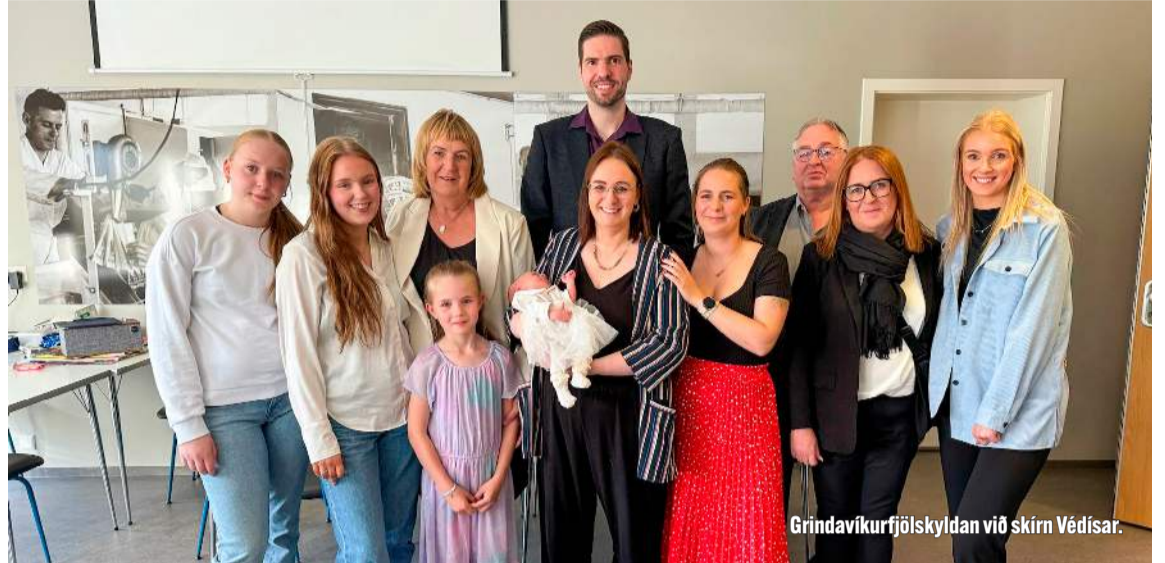
Grindavíkurfjölskyldan við skirn Védísar.

Ég veit að ég særði þá sem misstu húsin sín í þessu eldgosi og mér þykir það mjög leitt og vil biðja þau innilega afsökunar. Ég veit að þau eru að ganga í gegnum ólýsanlega erfiðleika og hafa þurft að þola óþolandi skrifræði og flókna stjórnslu í framhaldinu. Ég vildi alls ekki særa þetta fólk en mér fannst ég verða að segja heiðarlega frá minni upplifun, að vera föst með allt mitt í húsi í Grindavík í miðjum náttúruhamförum og geta ekki byggt upp nýtt líf.