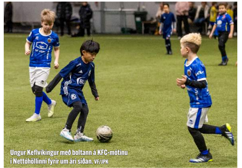
Ungur Keflvíkingur með boltann á KFC-mótinu í Nettóhöllinni fyrir um ári síðan.