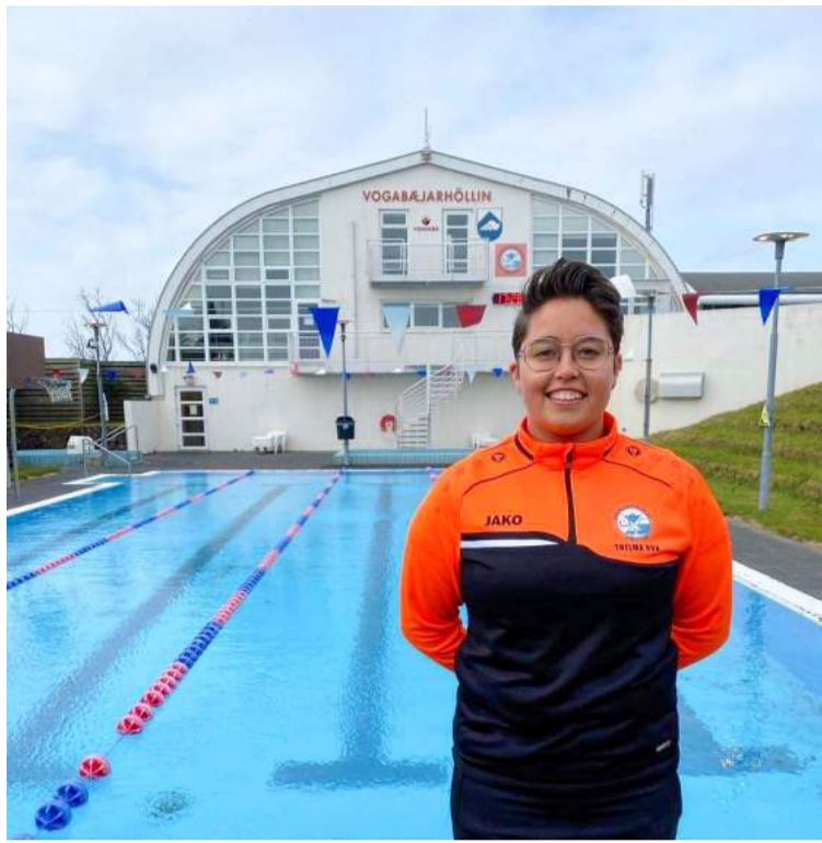
Flottir sundkrakkar í sunddeild Þróttar.

„Við tókum þátt í Speedómótinu hjá ÍRB í fyrra auk þess sem við höldum tvö innanfélagsmót, bæði jóla- og páskamót,“ sagði Thelma að lokum en upplýsingar um starf sunddeildarinnar er að finna á vefsíðu Þróttar Vogum, throttur.vogum.is/sund .