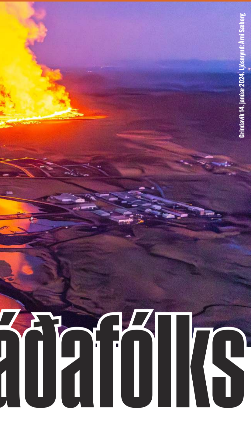
Grindavík 14. janúar 2024.