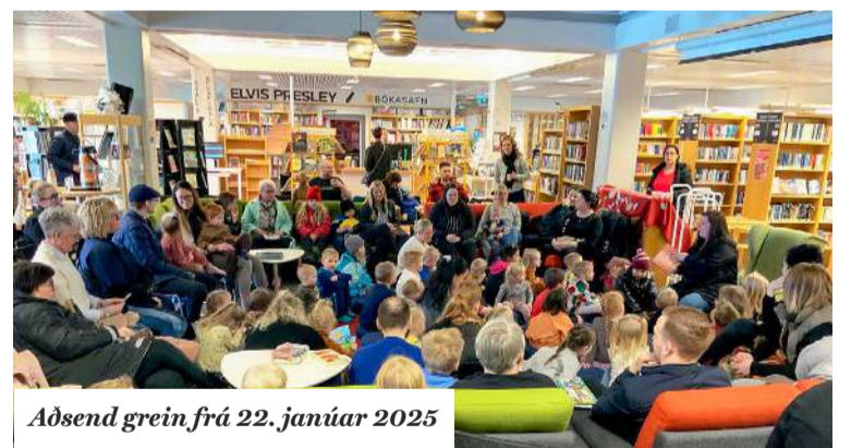
Aðsend grein frá 22. janúar 2025

Nútímabókasöfn eru orðin menningarhús og framtíðarmenningarhúsin okkar allra í Reykjaneshæjar eiga að geta rúmað þá fjölmörgu gesti sem sækja safnið