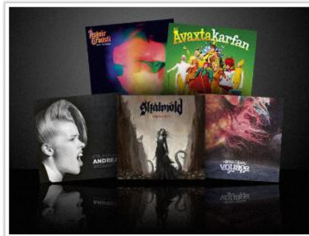
Jólagjöfin í ár er íslensk tónlist

Jólagjöfina í ár er hægt að gefa á ýmsu formi, á geisladisk, á rafrænu formi auk þess sem vinsældir víníplátna hafa einnig verið endurvaktar og tónlist er nú ósjaldan gefin út á því gamla og góða formi.