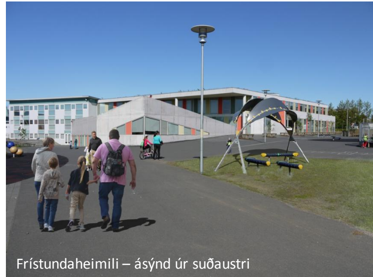
Frístundaheimili – ásýnd úr suðaustri

UMHVERFIS- OG SKIPULAGSSVIÐ • SKRIFSTOFA FRAMKVÆMDA OG VIÐHALDS • BYGGINGAÐEILD