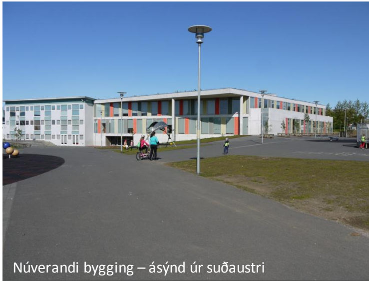
Núverandi bygging – ásýnd úr suðaustri